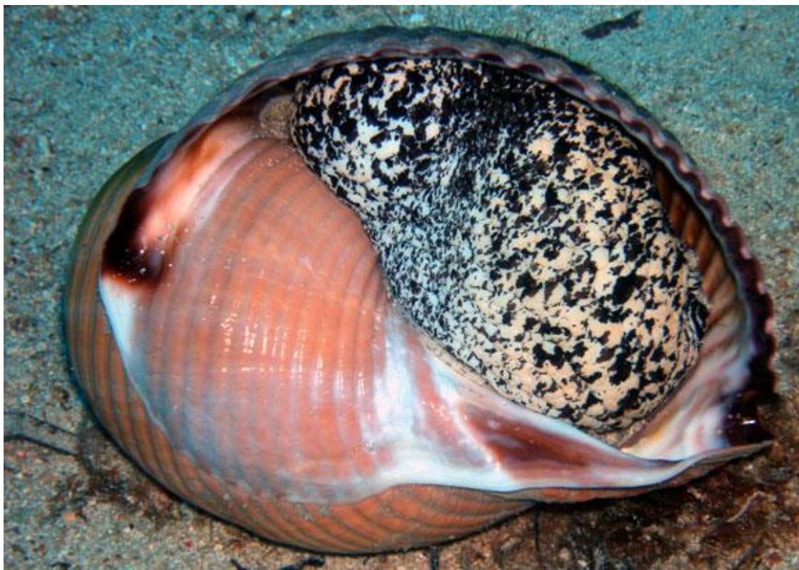
Slika 1. Puž bačvaš ( Tonna galea ) 22