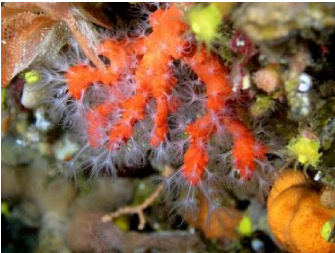
Slika 10. Crveni koralj ( Corallium rubrum ) 56