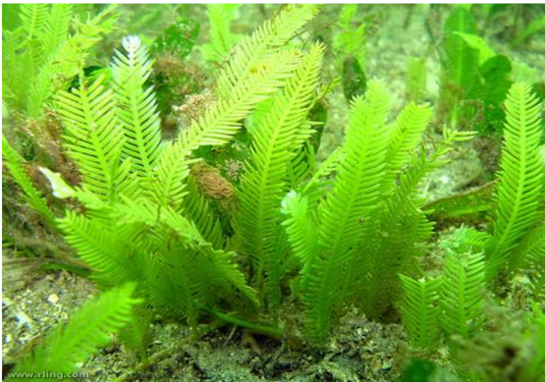
Slika 19. Alga Caulerpa taxifolia 82

Prijeko je potrebno da se sve zemlje Sredozemlja ravnopravno uključe i ulože zajedničke snage i mogućnosti kako bi ustrajale u tome da stanu na kraj opasnom i negativnom utjecaju algi na ostale morske organizme vrijedne očuvanja i zaštite te se potrude u pronalaženju učinkovitog rješenja za smanjenje njihova širenja diljem ostalih morskih krajeva. Upravo se na takav način autohtone vrste Sredozemnog mora, a također i Jadrana, mogu uspješno očuvati. Ukoliko nautičari pronađu Caulerpa taxifoliu obavezno trebaju dojaviti mjesto nalaza nekoj stručnoj osobi ili nadzornoj službi. Takvim postupkom mogle bi se pravovremeno spriječiti štetne posljedice koje je u veoma kratkom periodu sposobna učiniti ova opasna alga. 83