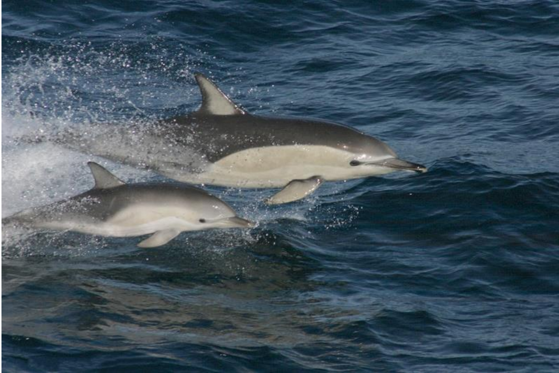
Slika 8. Obični dupin ( Delphinus delphis ) 49