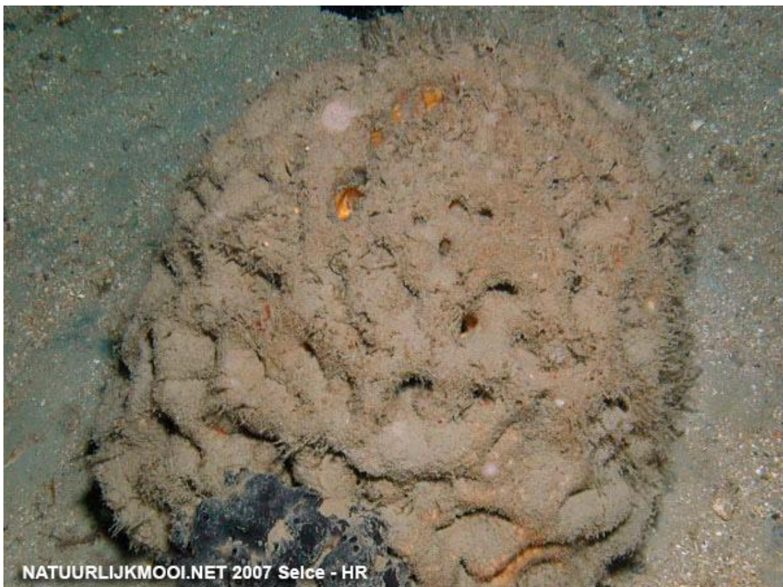
Slika 15. Velika kremenjača ( Geodia cydonium ) 69

Strogo je zaštićena zavičajna svojta (Pravilnik o proglašavanju divljih svojti zaštićenim i strogo zaštićenim, NN 99/09). Nije procijenjena ugroženost prema IUCN (International Union of Nature Conservation). 68