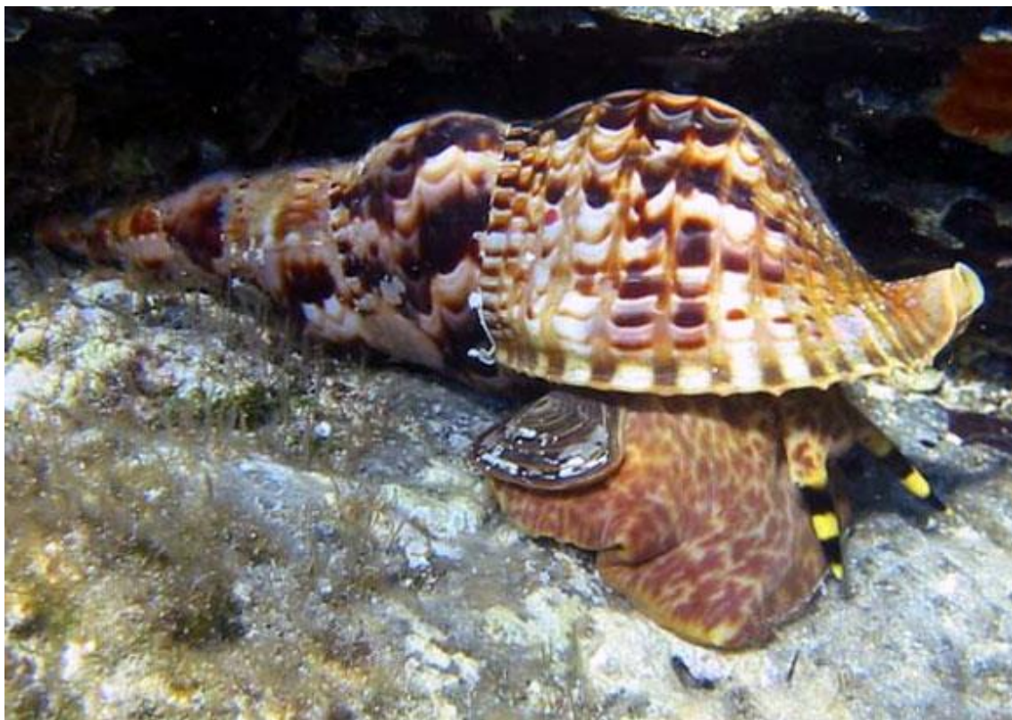
Slika 3. Tritonova truba ( Charonia tritonis sequenza ) 27