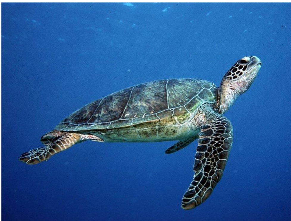
Slika 6. Golema želva ( Chelonia mydas ) 38

Golema želva naziva se još i zelena želva. Razlog tome su njezina boja i njezina veličina. Naime, zelena želva je najveća morska kornjača iz porodice chelonidae . Odrasla jedinka ima oklop dužine i do 150 cm, a može težiti i do 317 kg. Ime je dobila po obojenju masnog tkiva koje je zeleno. To je obojenje rezultat njezine prehrane. Zelena želva je jedina morska kornjača vegetarijanac. Hrani se morskom travom i algama, čiji je sastavni dio klorofil, koji daje zeleno obojenje njezinom oklopu. Tijekom odrastanja, male zelene želve se hrane meduzama i glavonošcima, a na vegetarijanski način prehrane prelaze tek u nekritičkoj fazi života. Područja ishrane najčešće su mjesta u kojima prevladavaju livade morskih trava i cvjetnica te mjesta s velikom količinom morskih algi. Može ih se naći i na području koraljnih grebena i stjenovitog dna. Time što pase morsku travu i alge, zelena želva pomaže u očuvanju ove značajne životne zajednice, održavajući je bujnom i zdravom, a time poboljšava kvalitetu života životinja koje tamo obitavaju. Mnogo je rjeđa u Jadranu od glavate želve. 37