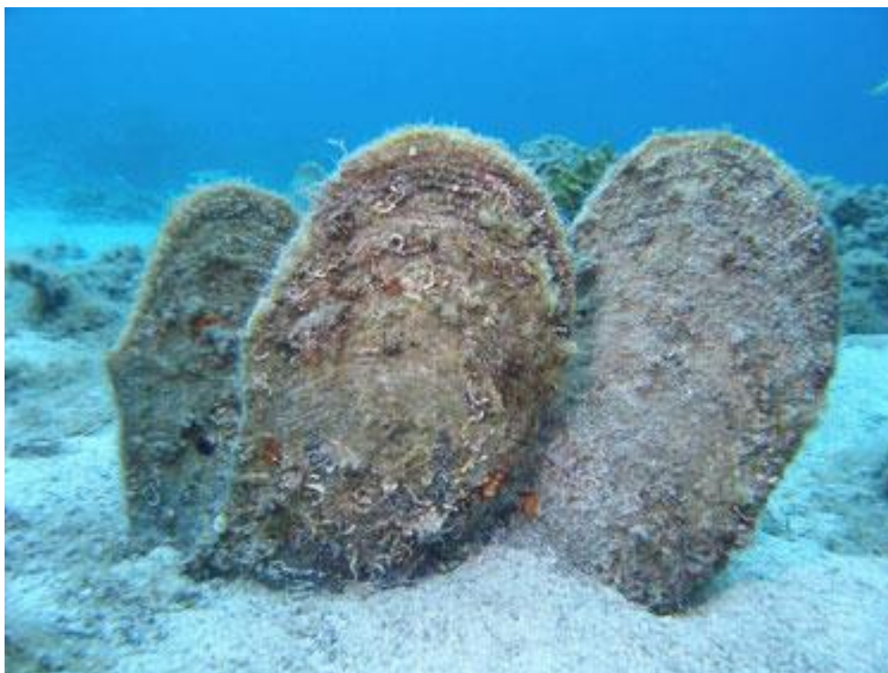
Slika 12. Plemenita periska ( Pinna nobilis ) 61

djeluje robusno, periska je poprilično krhka. Za razliku od većine školjkaša, ne leži položena na dnu, već strši. Unutrašnjost je ljuske glatka i sedefasta, a školjka stvara i bisere. Hrani se fitoplanktonom, filtrirajući vodu, pa na dan kroz njih prolazi oko 2000 litara vode. Periske su hermafroditi ali muški spol dominira kad su mlađe, a ženski kad su starije. Školjke ispuštaju spermije i jajašca te se poslije oplodnje u moru razvijaju ličinke. One koje prežive brojne grabežljivce poslije kraćeg života u slobodnoj vodi usidre se i iz njih tokom godina izraste velika školjka. Periska je svojom veličinom oduvijek privlačila ljude. Meso joj je jestivo, od rastezljivih, ali čvrstih niti izrađuje se odjeća, ukrasi, rukavice, a moguće je i da je od tog materijala napravljeno i legendarno zlatno runo iz grčke mitologije. Također, periska stvara bisere, od kojih je najveći crvenkast i u obliku je suze. Danas je ovaj školjkaš ukras mnogih konoba, ali i domova. Zbog toga su opustošene populacije periske u plićim vodama, pa je od 1994. godine zakonom zaštićena te su skupljanje, izlov i trgovina ovom vrstom strogo zabranjeni. 60