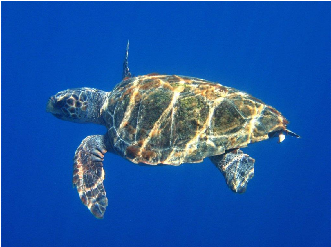
Slika 4. Glavata želva ( Caretta caretta ) 34