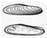
prstac ( Litophaga litophaga )