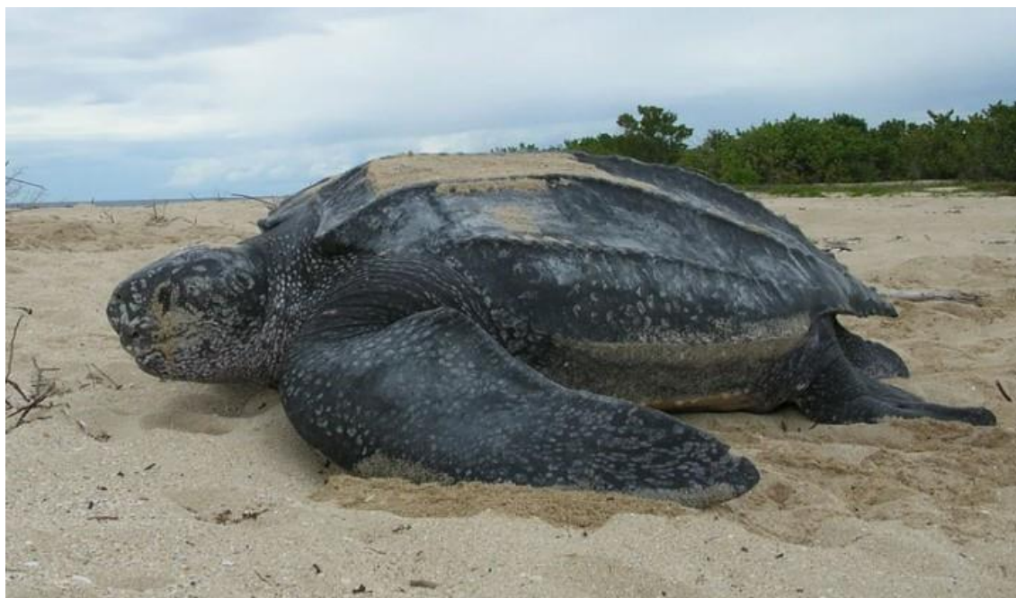
Slika 5. Sedmopruga usminjača ( Dermochelys coriacea ) 36

div ima na sebi još samo ostatke koštanog oklopa prekrivene mekom kožastom prevlakom što sedmoprugoj usminjači osigurava bolju mobilnost u vodi. Kako jaja polaže na obali, izložena je pogledima znatiželjnih turista i opasnosti koja joj prijete od sakupljača jaja. Nakon više mjeseci iz jaja se izvale male kornjače koje, probijajući se kroz pijesak, žure prema moru. Mnoge od njih postaju žrtvom gladnih galebova. Samo malen broj mladunaca preživi do spolne zrelosti. Mnogo godina kasnije vraćaju se kao spolno zrele kornjače na istu obalu kako bi osnovala novi naraštaj. Sakupljači jaja iz obližnjih naselja ugrožavaju populacije ovih kornjača koje na tradicionalnim mjestima polažu jaja. Za opstanak sedmopruge usminjače problematičan je i sve razvijeniji turizam pa se stoga svrstava među ugrožene vrste. 35