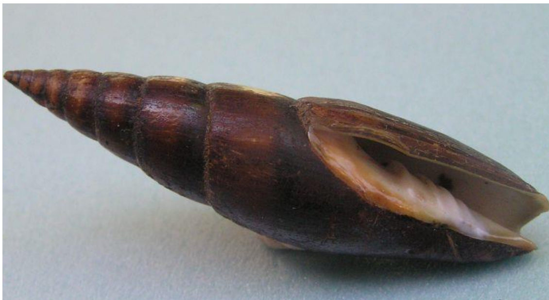
Slika 2. Prugasta mitra ( Mitra zonata ) 24