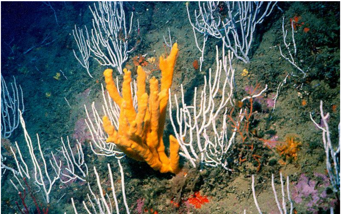
Slika 16. Zvezdasta rogljača ( Axinella polypoides ) 71

Spužva zvezdasta rogljača, jadranska je spužva, dugog, razgranatog i uzdignutog valjkastog oblika, žute, narančaste do crvene boje. Veći otvori pravilno su raspoređeni po površini spužve žute. Čvrste je građe i naraste do veličine od 70 cm. U Jadranu dolazi na dubinama od 15 do 85m. Česta je na strmom hridinastom dnu naših otoka u koraligenskoj zajednici, a nalazi se i na ljušturim dnima otvorenog mora. Kao i većina spužava spada u filtratore, hrani se planktonom i organskim česticama. Strogo je zaštićena zavičajna svojta (Pravilnik o proglašavanju divljih svojti zaštićenim i strogo zaštićenim, NN 99/09). Nije procjenjena ugroženost prema IUCN (International Union of Nature Conservation). 70