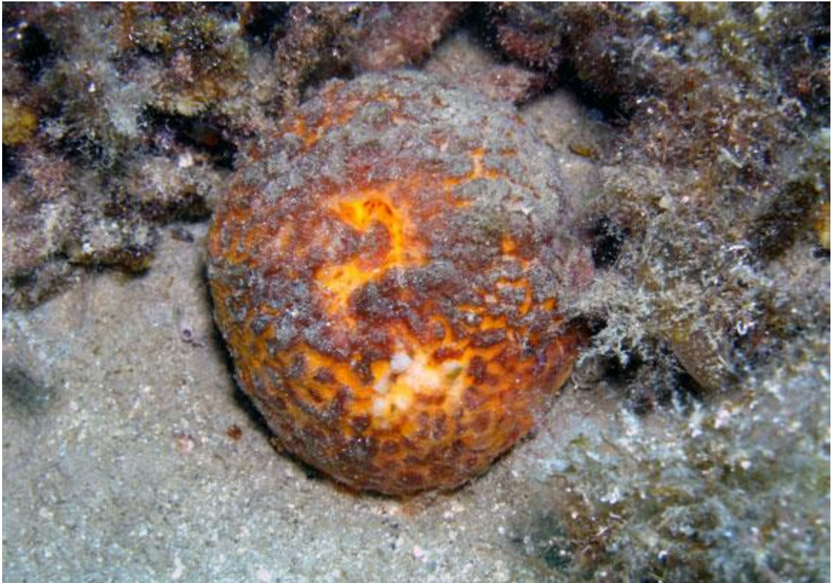
Slika 18. Morska naranča ( Tethya aurantium ) 75

Karakterističnog je okruglog oblika, s vidljivim apikalnim oskulumom, izvana i u prerezu nalikuje na naranču. Narančaste je boje, promjera 6-10 cm, čvrsta je i elastična, živi pojedinačno. Raste na čvrstim dnima, podnosi sedimentaciju. 74