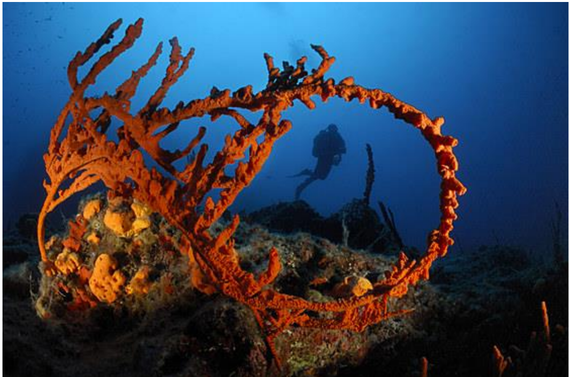
Slika 17. Mekana rogljača ( Axinella cannabina ) 73

Spužva mekana rogljača, jadranska je spužva, valjkastog je i izbrazdanog oblika s većim glavnim otvorima od žute, narančaste do crvene boje. Čvrste je građe i naraste do veličine od 50 cm. U Jadranu dolazi na dubinama od 15 do 85m. Česta je na strmom hridinastom dnu naših otoka u koraligenskoj zajednici, rjeđa uz oble kopna, a nalazi se i na ljušturnim dnima otvorenog mora. Kao i većina spužava spada u filtratore, hrani se planktonom i organskim česticama. Strogo je zaštićena zavičajna svojta (Pravilnik o proglašavanju divljih svojti zaštićenim i strogo zaštićenim, NN 99/09). Nije procjenjena ugroženost prema IUCN (International Union of Nature Conservation). 72