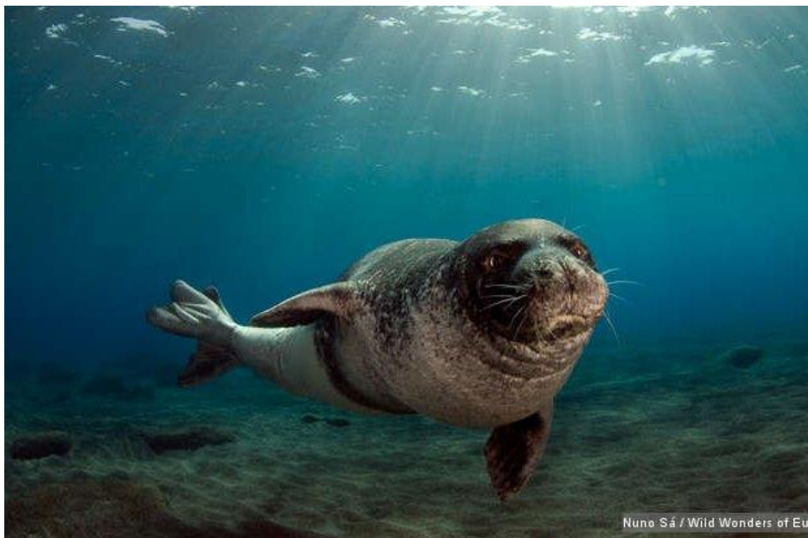
Slika 9. Sredozemna medvjedica ( Monachus monachus ) 52

povremena pojavljivanja zabilježena su 2010. godine u blizini rta Kamenjak 50 , dok je 2014. godine bila čest gost istarskih plaža pojavivši se tako u Gortanovoj uvali u Puli, na Stoji, plaži u Banjolama, Premanturi, na Valkanama te Vrsaru. 51