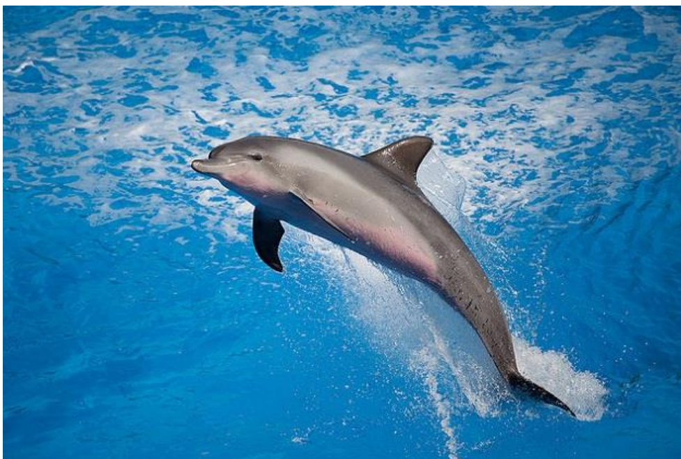
Slika 7. Dobri dupin ( Tursiops truncatus ) 44

Vrsta dupina koju obično vidimo u Jadranskom moru naziva se dobri dupin. Dobri dupin je najveća vrsta iz porodice pliskavica u Sredozemnom moru, te je i jedina stalno živuća vrsta pliskavica u Jadranu. Tamnosive je do crne boje na leđima, svjetlosive na bokovima i bijele na trbuhu. Prosječna je veličina odraslih jedinki u Jadranu oko 2,5 metra, a težina oko 250 – 300 kilograma. Hidrodinamičnog je tijela pa brzo pliva. 43