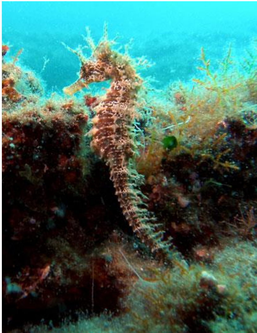
Slika 13. Morski konjic ( Hippocampus ) 63

Morski konjic ugrožena je vrsta u Jadranu. Ovo dobroćudno i nježno morsko biće vrlo je lak plijen, posebice nesavjesnih i nemarnih ronioaca koji ne shvaćaju da živa bića nisu suveniri koje treba prodavati. 62