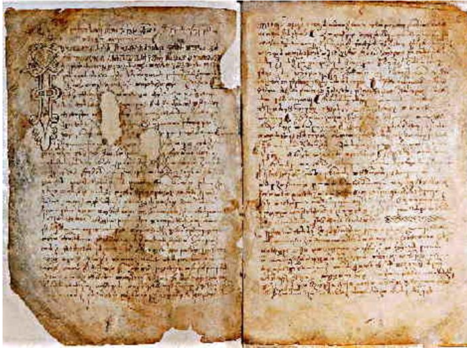
Slika 1 Vinodolski zakonik

Ti rani spomenici imaju veliku povijesnu važnost za hrvatski jezik i nacionalnu svijest. Najznačajniji među njima je Bašćanska ploča, koja je služila kao izvorna pregrada koja je simbolizirala odnos između puka i svećenstva. Bašćanska ploča daje uvid u postojanje hrvatskog naroda, njihov jezik te kulturni i jezični razvoj. Pismenost je omogućila razvoj vlastitog identiteta naroda, ali i individualaca. Razumijevanje i znanje o povijest pismenosti bitno je kako bi se shvatila važnost u smislu razvoja ljudske vrste. Obrazovanje tako čini bitnu varijablu u oblikovanju društva i kulture, ostavljajući nasljeđe koje obogaćuje kolektivnu svijest o prošlosti.