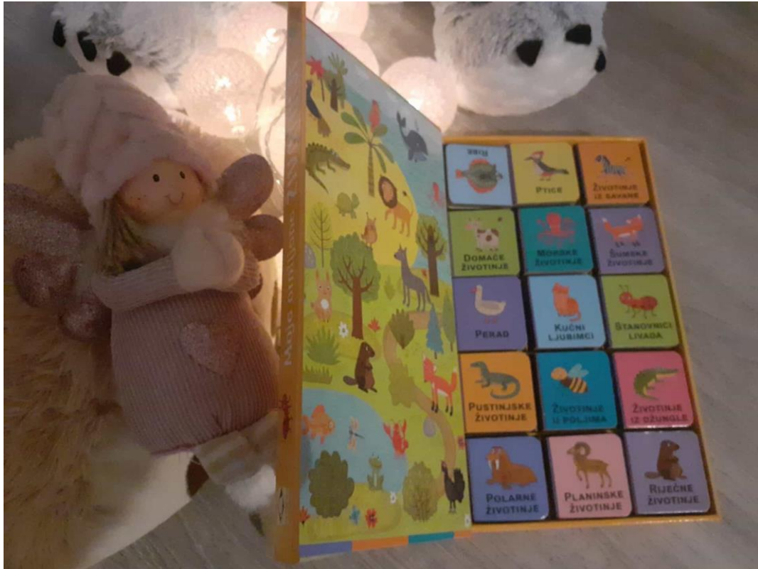
Slika 5 Unutrašnjost knjige Moje omiljene životinje (izvor: https://delfi.rs/knjige/182728_moje_omiljene_zivotinje_-_ucimo_reci_knjiga_delfi_knjizare.html , pogledano: 19.6.2024.)

Potiče djecu na aktivno učenje, istraživanje i postavljanje pitanja, što je osnovni element u ranoj fazi obrazovanja. Također, djeca razvijaju i vještine prepoznavanja oblika i boja, što je bitan aspekt njihovog kognitivnog razvoja.