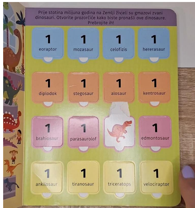
Slika 4 Moje omiljene životinje - dinosauri

Opisi su prilagođeni dječjem uzrastu, omogućujući im da kroz igru i zabavu nauče prepoznati i imenovati različite životinje. Opisi su napisani jednostavnim jezikom, što potiče razvoj rane pismenosti i proširenje vokabulara kod djece. Kroz ilustracije i opise, slikovnica pomaže djeci da razviju osnovno razumijevanje o različitim vrstama životinja, njihovim karakteristikama i staništima.