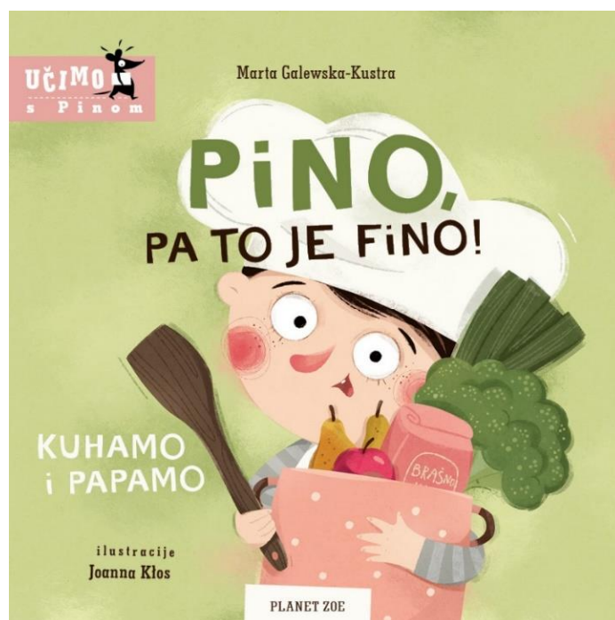
Slika 6 Slikovnica Pino, pa to je fino! (izvor: https://planetzoe.hr/shop/cijena/pino-pa-to-je-fino , pogledano: 19.6.2024.)

Priča prati dječaka Pina koji odluči kušati novo jelo u poznatom restoranu „Vesela mrkvice“. Pino naručuje tjesteninu koja se razlikuje od one koju jede kod kuće, ali mu se svejedno jako svidjela. Nakon obroka, glavni kuhar daruje djeci recept za palačinke. Kada se Pino vrati kući, cijela obitelj zajednički priprema palačinke, a svaki član ima svoj zadatak: tata usitnjuje voće, Pino miješa osnovne sastojke, a njegova sestra Maja postupno ulijeva nove. Tata na kraju peče i podnevni obrok je spreman, Slikovnica pruža mnoge mogućnosti za razvoj rane pismenosti kao što su učenje novih riječi i pojmova, poticanje zajedničkog čitanja i razgovora, razvoj motoričkih vještina i sl. Djeca koja su uključena u pripremu hrane češće će pokazati interes za isprobavanje novih jela, što može pomoći u razvijanju zdravih prehrambenih navika. U ovoj slikovnici nalazi se i recept za palačinke s voćem, što dodatno motivira djecu da sudjeluju u pripremi hrane.