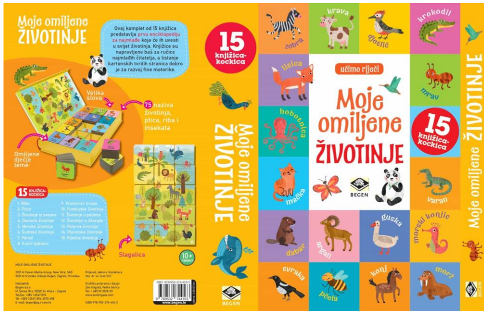
Slika 3 Slikovnica Moje omiljene životinje (izvor: https://www.begen.hr/proizvod/moje-omiljene-zivotinje/ , pogledano: 19.6.2024.)

Opisi su prilagođeni dječjem uzrastu, omogućujući im da kroz igru i zabavu nauče prepoznati i imenovati različite životinje. Opisi su napisani jednostavnim jezikom, što potiče razvoj rane pismenosti i proširenje vokabulara kod djece. Kroz ilustracije i opise, slikovnica pomaže djeci da razviju osnovno razumijevanje o različitim vrstama životinja, njihovim karakteristikama i staništima.