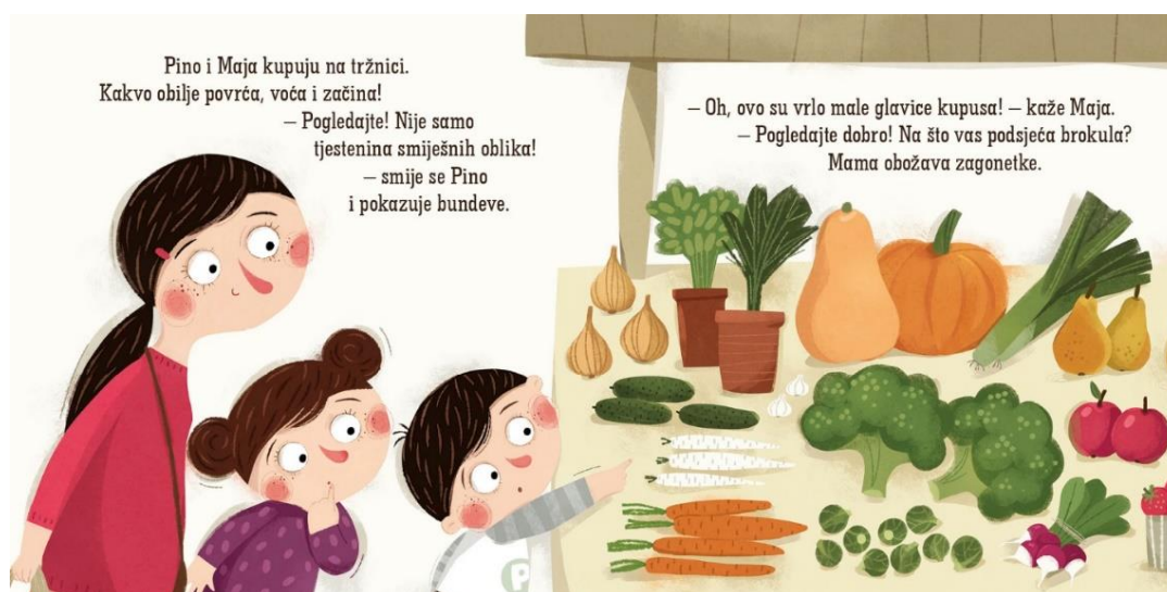
Slika 8 Unutrašnjost slikovnice Pino, pa to je fino! (izvor: https://planetzoe.hr/shop/cijena/pino-pa-to-je-fino , pogledano: 19.6.2024.)

Autorica preporuča zajedničku obiteljsku pripremu, osobito za djecu koja su manje sklona isprobavanju novih jela. Kroz ovu aktivnost, djeca ne samo da uče o hrani i kuhanju, već također razvijaju osjećaj zajedništva i suradnje unutar obitelji.