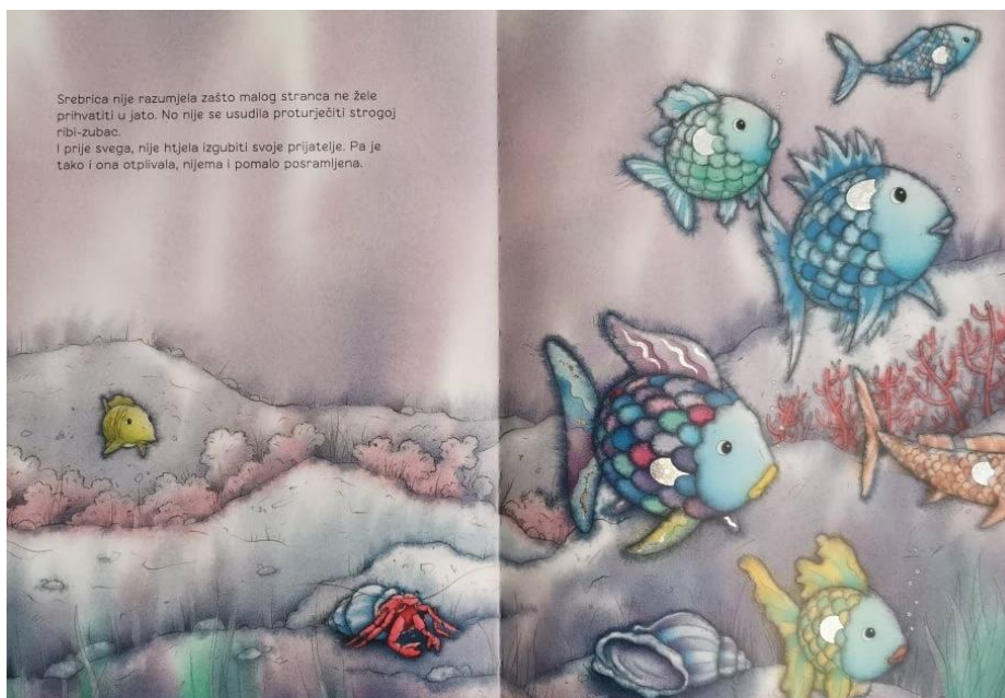
Slika 2 Primjer slikovnice - Riba duginih boja