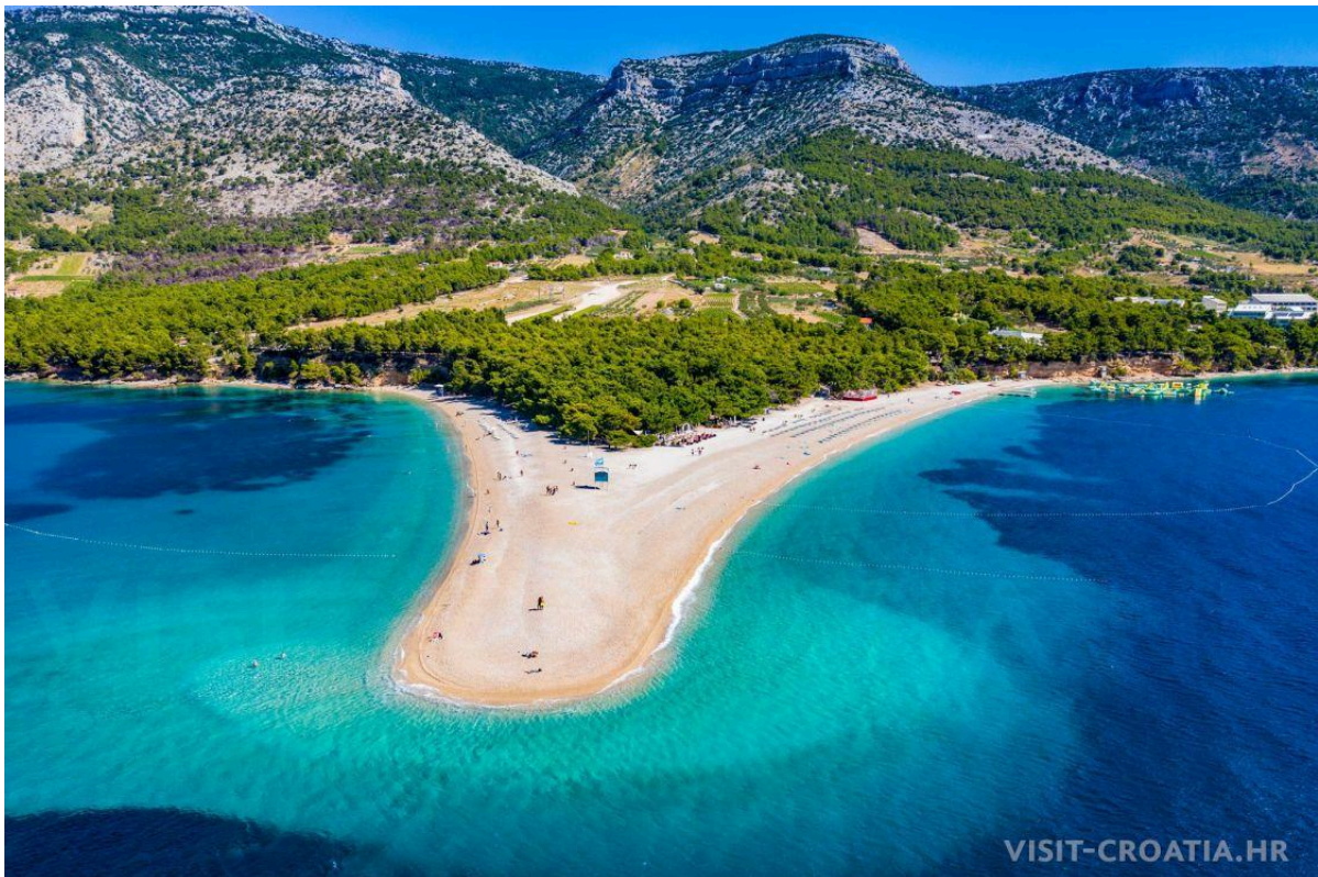
Slika 7. Otok Brač

zanimljivu povijest koja počinje tisućama godina unazad. Tradicionalni način života, običaji, more, kultura duboko su ukorijenjeni u život ljudi koji žive na tom području i danas. Maldivi se suočavaju sa održivim razvojem, podizanjem razine mora i klimatskim promjenama. Osviješteni turizam, održivi razvoj i moderna tehnologija najveći su izazovi Maldiva za budućnost. Oba otoka moraju pažljivo balansirati povijest i budućnost i naći zajedničku crtu kako bi u budućnosti opstala ( https://www.otok-brac.hr , 2023).