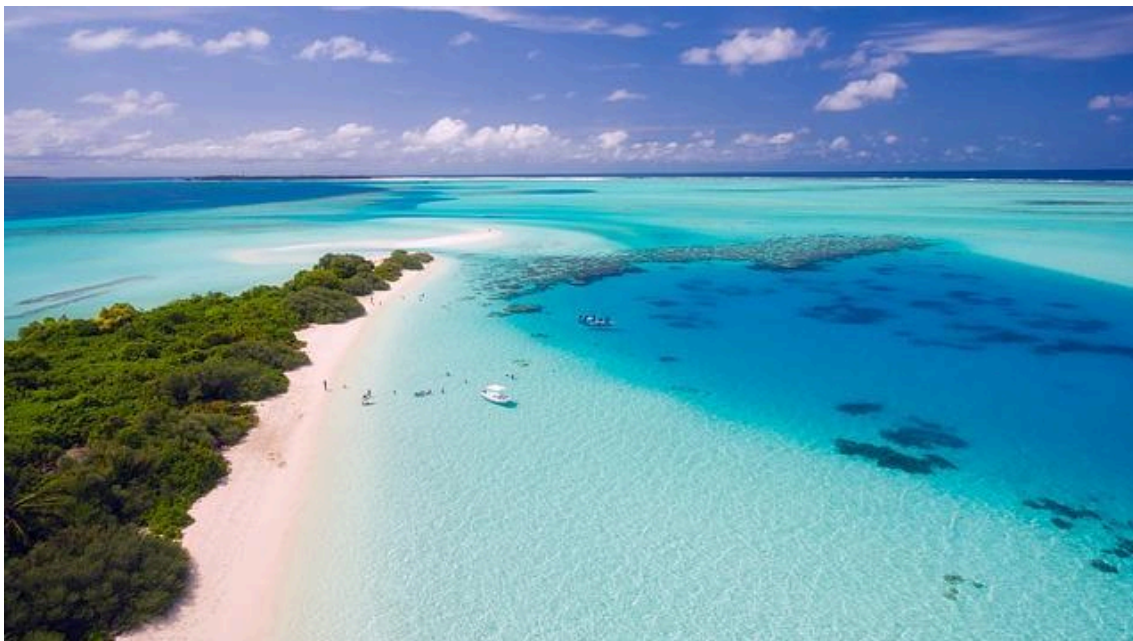
Slika 8. Otočje Maldivi