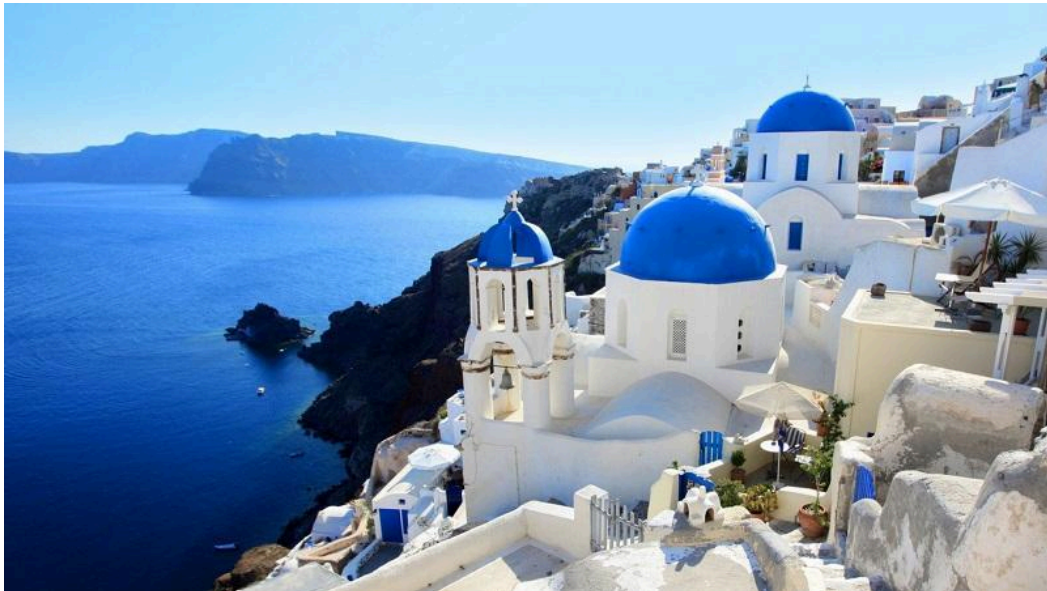
Slika 10. Otok Santorini