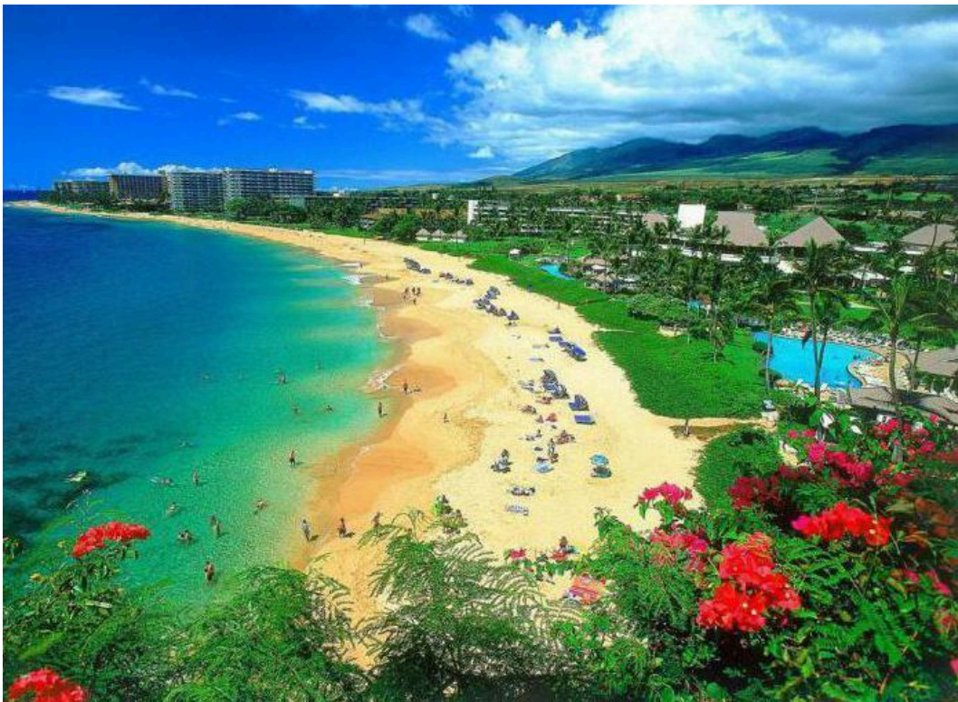
Slika 6. Otok Maui

Maui je otok u srednjem Pacifiku i pripada skupini Havajskog otočja. Prema mnogim parametrima otok Maui smatran je reprezentativnim primjerom svjetske turističke destinacije. Otok krasi raznoliki ekosustavi, tropske šume, vulkanske planine i prekrasne plaže. Raznovrsne turističke aktivnosti protežu se od planinarenja i promatranja kitova, do ronjenja i surfanja. Kultura i tradicija koje uključuju lokalnu kuhinju i ples hula jedno su od posebnosti ponude otoka. No prebrzi razvoj otoka predstavlja i izazov očuvanja prirode i održivosti potreba lokalne zajednice sa turistima ( https://www.gohawaii.com , 2023.)