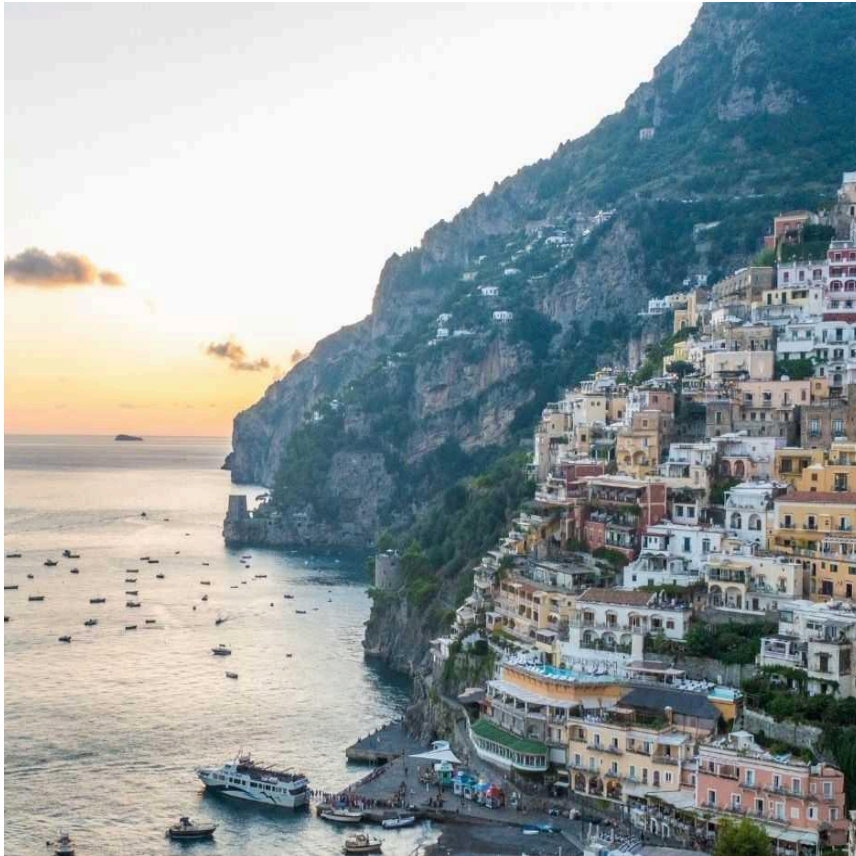
Slika 5. Otok Kapri

Otok Kapri je luksuzni talijanski otok, nalazi se u Tirenskom moru blizu Napuljskog zaljeva. Otok je svjetski poznata destinacija po luksuznim vilama, elegantnoj atmosferi i prekrasnim krajolicima i prirodnim ljepotama. Plava špilja koja se nalazi na otoku privlači posjetitelje jedinstvenom plavom svijetlošću. Na otoku se nalaze luksuzni i ekskluzivni restorani najvišeg ranga, ekskluzivni butici, te luksuzni hoteli i apartmani. Također turistička ponuda otoka nudi obilaske vrtu Auguste, Ancapriju i prirodnim krajolicima od kojih je najznačajniji krajolik Faraglioni. Unatoč luksuznom turizmu i standardima najvišeg svjetskog ranga otok se bori sa očuvanjem okoliša i održivosti ( https://www.capri.com/ , 2023).