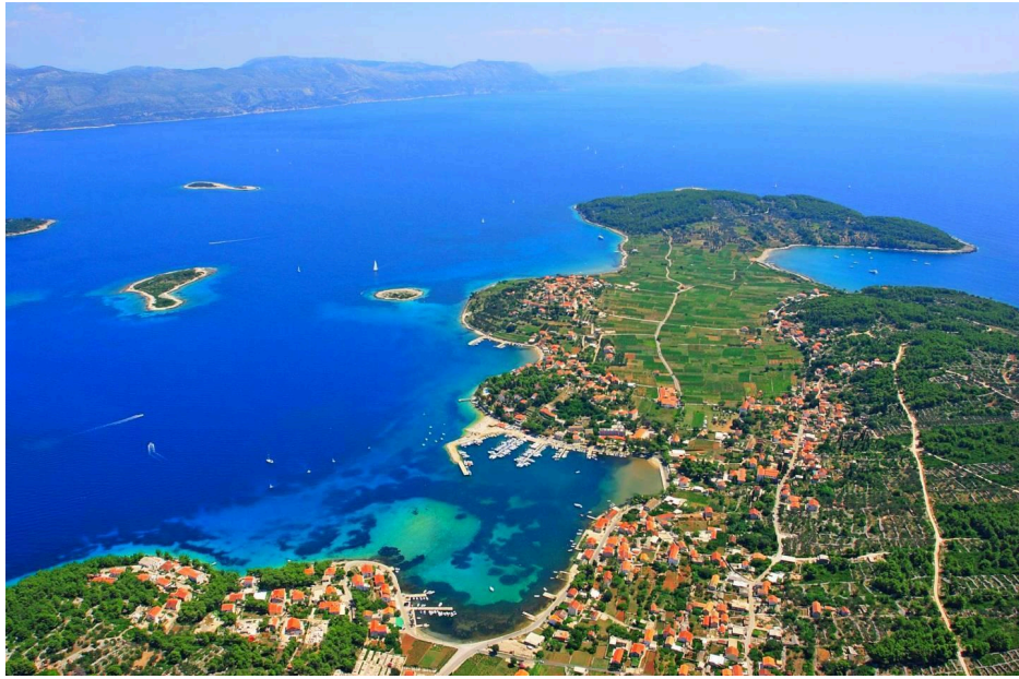
Slika 9. Otok Korčula