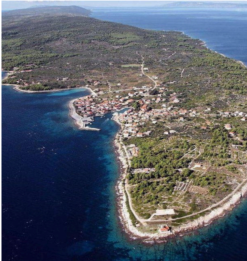
Slika 4. Otok Hvar

destinacija, noćni život je iznimno uzbudljiv. Također posjetitelji mogu obići tvrđavu Forticu, te uživati na predstavama u Hvarskom teatru. Sa sve većim priljevom turista dolazi do problema održivosti, potrebno je kvalitetno održivo upravljanje turizmom kako bi se sačuvale kulturne i prirodne ljepote ( https://www.hvarinfo.com/hr/ , 2023).