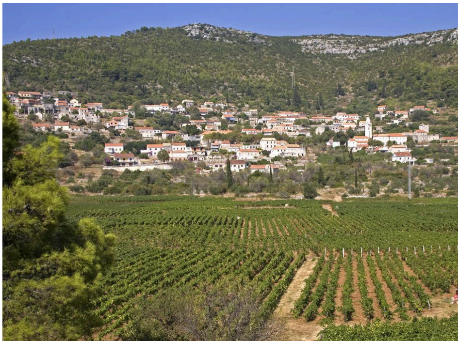
Slika 1. Vinograd na otoku Korčuli