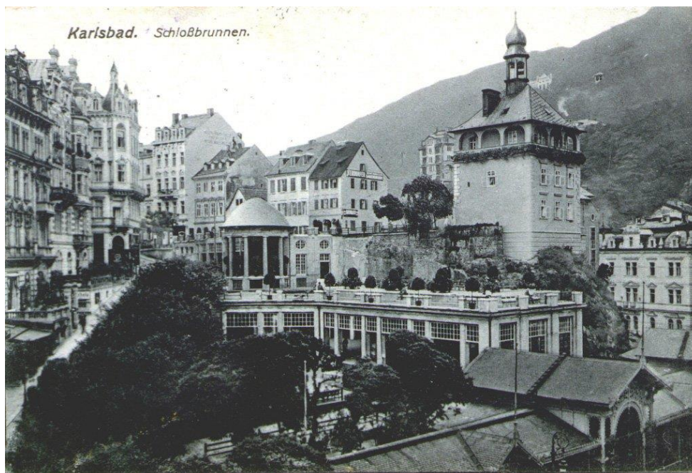
Slika 3 Karlovy Vary (Karlsbad)