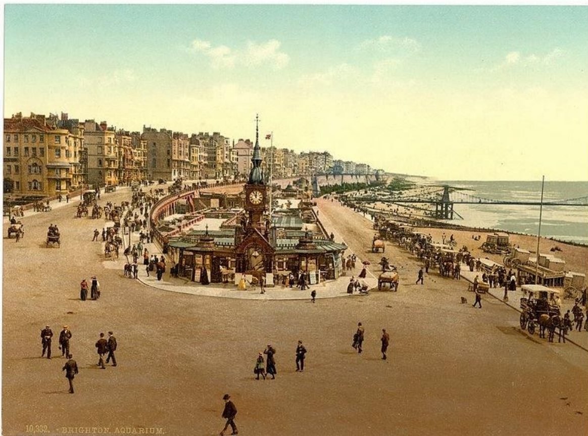
Slika 2 Razglednica iz Brightona u periodu između 1883. i 1896.