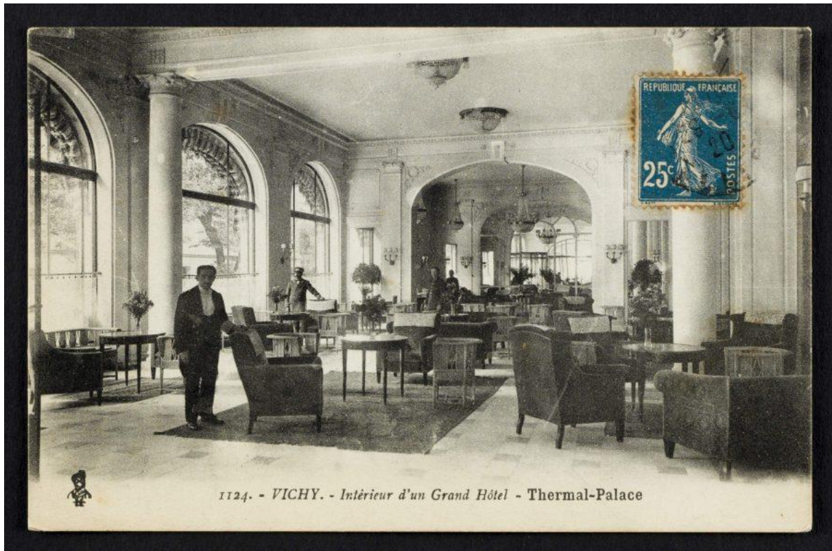
Slika 4 Veliki salon u termalnoj palači Vichy