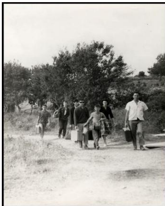
Slika 4. Dolazak novih gostiju u kamp