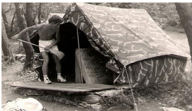
Slika 2. Šatori u kampu