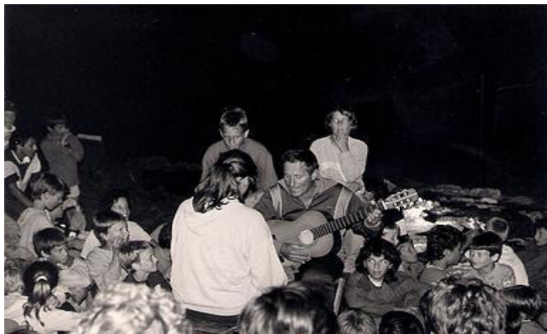
Slika 1. Večernje druženje

Članovi TVD-a Partizan, danas Sportskog društva Narodni dom iz Ljubljane, u Premanturu su došli nakon što su nekoliko godina boravili na pulskim Valovinama. Nakon što je Valovine kupio Savez boraca iz Maribora, u današnjem kampu Tašalera kupili su oko 2000 metara kvadratnih zapuštenog i u makiju zaraslog zemljišta, tik uz more, koje su sami uređivali. S vremenom su tako izgradili kuhinju, sanitarije, ambulantu, plesni podij, stolove za stolni tenis, košarkaški i odbojkaški teren, kafić... 47