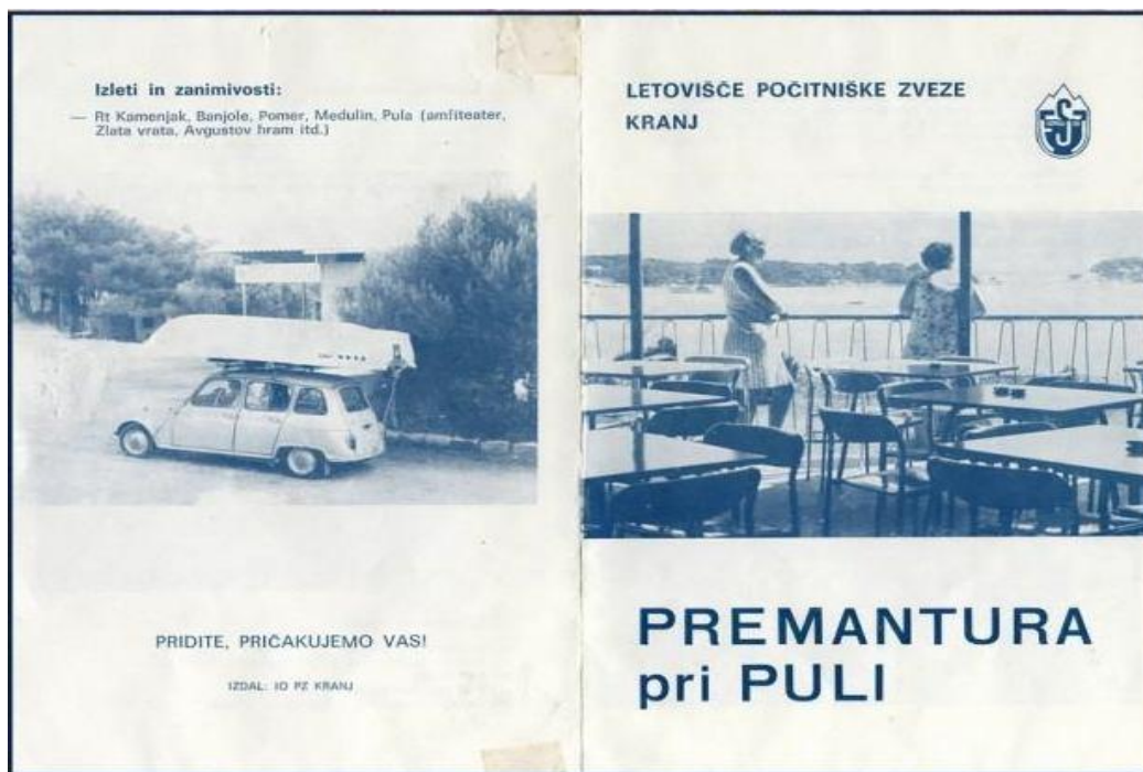
Slika 5. Prvi tiskani prospekt Kranjskog kampa