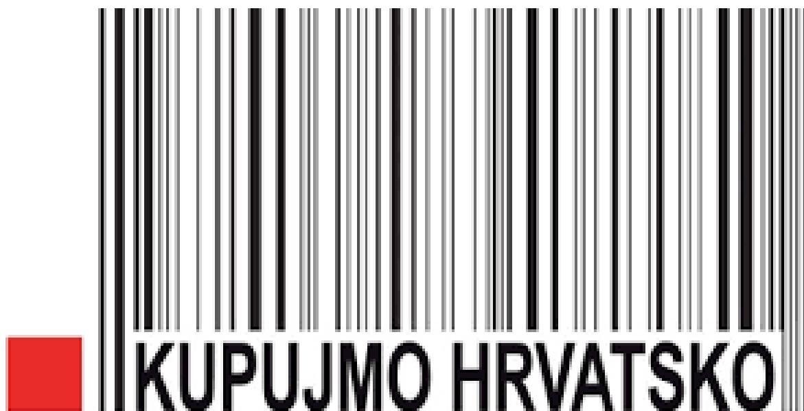
Slika 3: Znak akcije „ Kupujmo hrvatsko“ 29

Akcija „Kupujmo hrvatsko“ Hrvatske gospodarske komore predstavlja akciju opće društvene namjene koja snažno promovira i podupire domaće gospodarstvo s osnovnom namjerom osvještavanja važnosti kupovine domaćih proizvoda kako bi se pridonijelo jačanju hrvatskoga gospodarstva, povećanju njegove ukupne konkurentnosti, te posljedičnog jačanja i očuvanja nacionalnog identiteta. Glavni cilj akcije je sveobuhvatna promocija hrvatskog gospodarstva, odnosno podizanje svijesti građana o važnosti kupovine hrvatskih proizvoda.