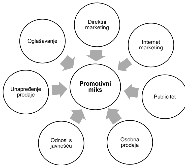
Slika 3. Elementi promotivnog miksa