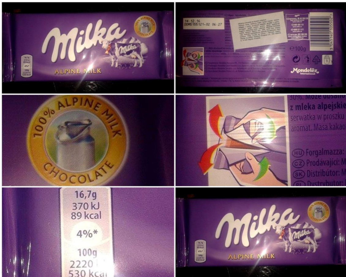
Slika 20. Milka mliječna čokolada 1000g

Od prvoga dana kada se poduzeće opredijelilo za ljubičastu boju i zatražilo pravnu zaštitu, ostala je zaštitni znak svakog proizvoda „Milke“. Možemo primijetiti da je pakiranje prvog proizvoda s kojim je stekla svoji renome i lojalnost kod korisnika istaknut ljubičastom bojom. Pakiranje ispunjava svoju glavnu funkciju zaštite proizvoda i pruža potrebne informacije o proizvodu.