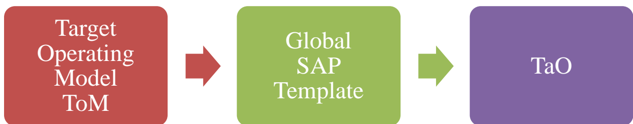
Slika 6. TaO projekt

ToM i oneSAP programi spojena su u jedinstveni poslovni program – TaO te unose promjene u cijeli BAT. Način spajanja u jedinstveni program prikazani su na slici 6.