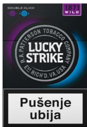
LUCKY STRIKE WILD