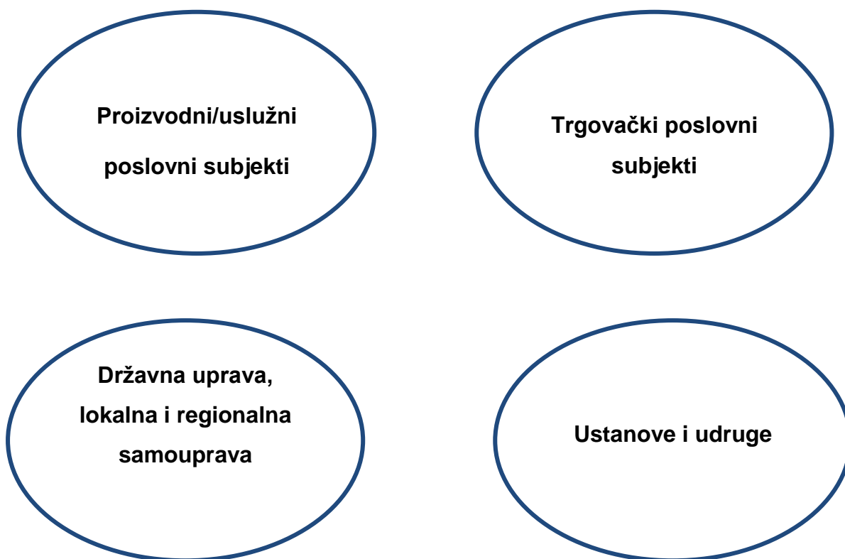
Slika 1. Shema poslovnog tržišta

Poslovno tržište je tržište na kojem djeluju poslovni subjekti kojima je osnovni cilj ostvarivanje dobiti, ali i onima kojima to nije svrha poslovanja već djeluju na neprofitnoj osnovi. Tako npr. na poslovnom tržištu djeluju i poslovni kupci koji kupuju opremu za unapređenje vlastitog poslovanja kako bi ostvarili dobit, ali i udruge građana i znanstvene ustanove – koje su neprofitno orijentirani poslovni subjekti. 1 Na slici 1. prikazana je shema strukture poslovnog tržišta.