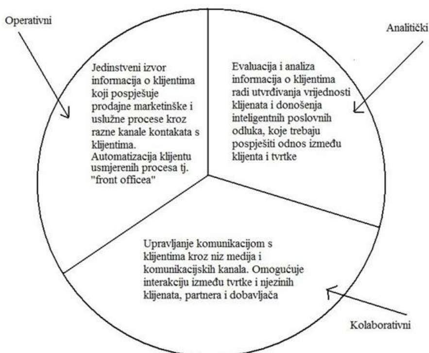
Slika 3. Komponente upravljanja odnosima s korisnicima

Izvor: Muller, J. i V Srića Upravljanje odnosima s klijentima primjenom CRM poslovne strategije do povećanja konkurentnosti , Zagreb, Delfin, 2005