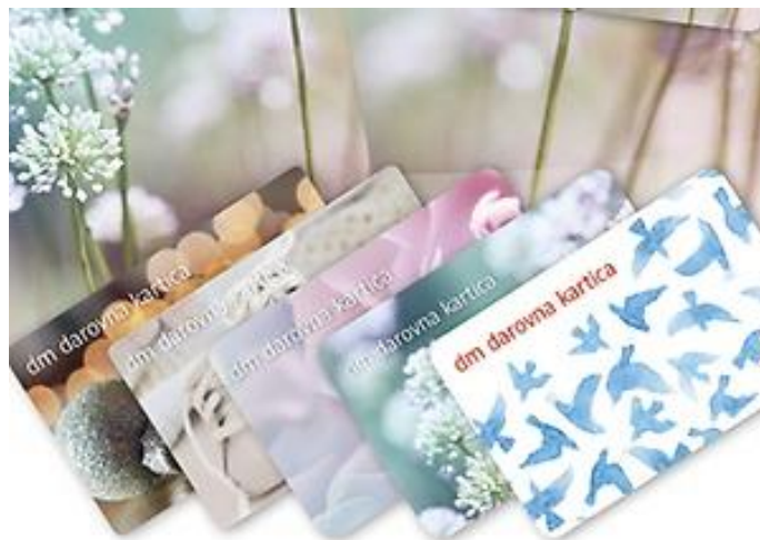
dm darovna kartica