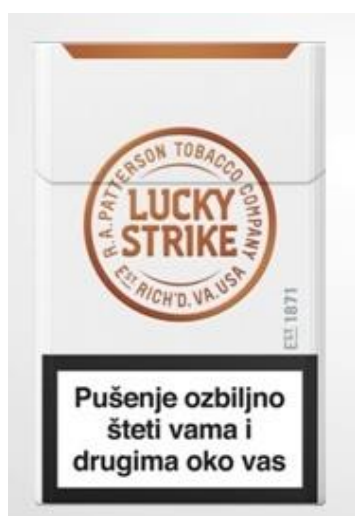
LUCKY STRIKE FLOW FILTER RESIZED