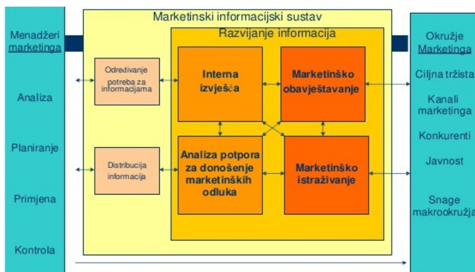
Slika 3 Marketinški informacijski sustav