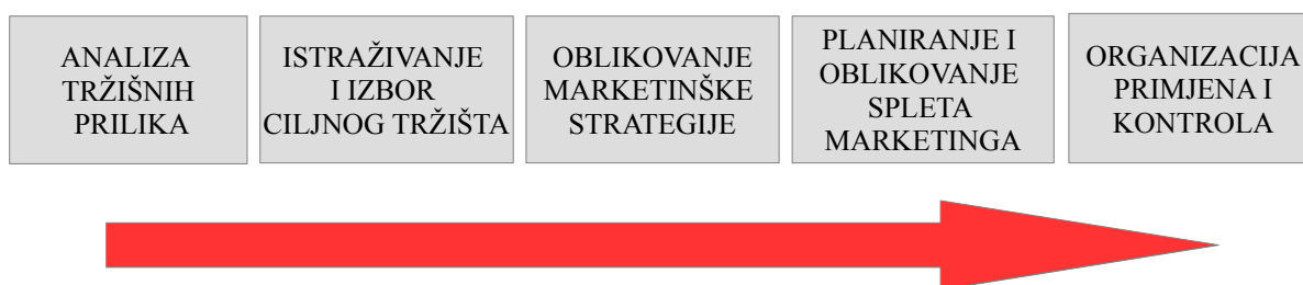
Slika 1. Marketinški proces