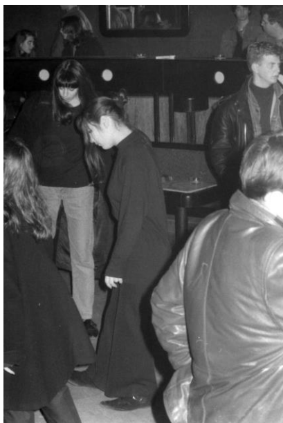
Slika 3. Hotel Pula 1990., disco Colloseum, „darkerice“.