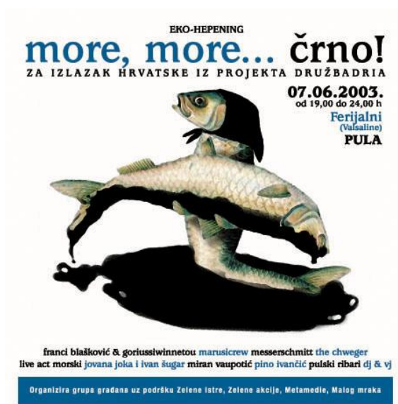
Slika 10. Plakat za zajednički eko hepening protiv projekta Družba Adria.