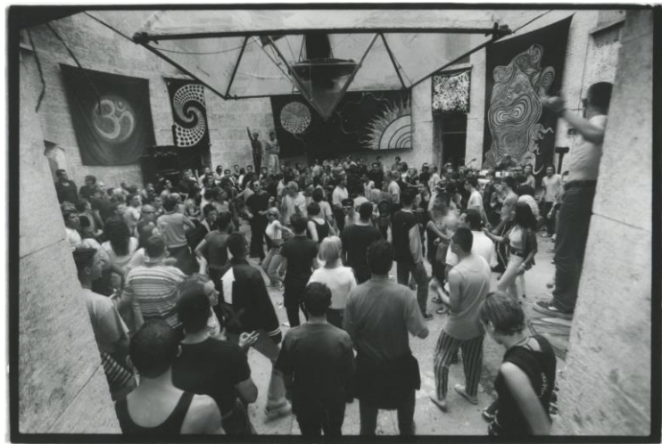
Slika 8. Goa trance party u Fort Bourguignonu.

partyji u Piramidi i Bourguignonu su imali toliko nevinu notu, bez droge, plesalo se do ranih jutarnjih sati, sve je odimalo nekom čudnom pozitivnom energijom koju je najlakše objasniti osjećajem izabranosti i ekstatičnom (ironično) kohezijom nove grupe u formiranju. Ljudi koji su sredinom prema kraju 90-ih živjeli techno, jako mali broj njih, tek oko 40-ak, su uglavnom bili imuni na asocijaciju techna s težim i teškim drogama"... (Kalčić; 2009:47-51)