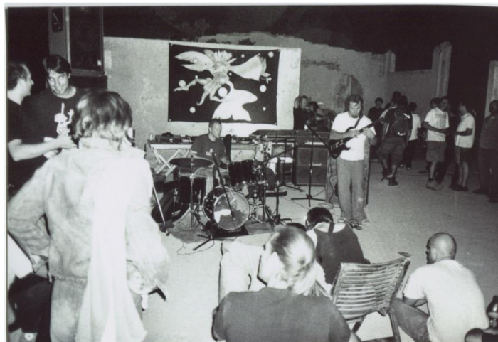
Slika 9. Media Mediterranea, 1999. na Marleri.