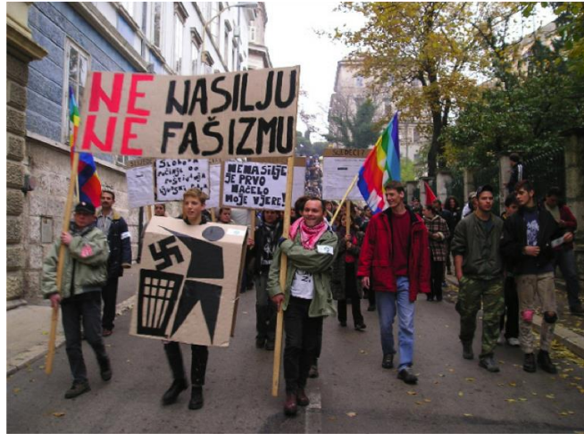
Slika 11. Organizacija Mirnohoda u središtu Pule, studeni 2004.

10.000 ljudi, bilo je izuzetno važno. Pritisak javnosti urodio je vrlo brzim suđenjem, napadač je dobio nekih 6 godina, obranilo se multietničnost Pule. Skins scena se smirila nakon toga. Ima i dalje sporadičnih slučajeva, ali policija je poduzela mjere da se to ne razvija i da se suzbije. Međutim, nesreća Pule je da bez obzira na potencijale i jaku alternativnu scenu, često smo mali i provincijalni. Često postoji ljubomora, zloba, ekipa je posvađana, u stilu "ja sam prvi, ti si prvi i sl." (Kulturpunkt razgovor, vođen 2011)