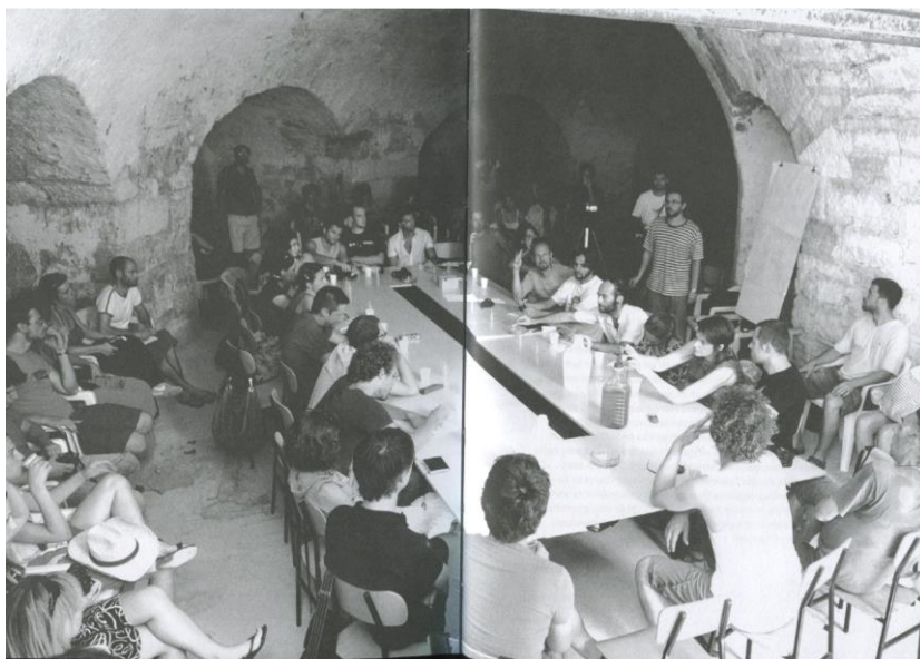
Slika 13. Radionica Pulske grupe na Muzilu na konferenciji Grad postkapitalizma 2009.

Monumenti, odnosno vojne zone, Brijuni rivijera i sl. Oko toga smo se angažirali. Kako smo tada postavili stvari bilo nam je važno identificirati što je tu ključni društveno politički problem i kako na njega reagirati. Budući da nikad nismo imali političku moć ili društvenu moć kao neki „movimento popolare“, najčešći je alat onaj koji je na raspolaganju u nekoj kulturnoj domeni. Glazba, izložba, filmovi, u našem slučaju mape. Koristi se vlastita kreativnost, resurse, rad i onda se koristi te alate. Umjetnost ima tu domenu da predočava drugačiju realnost, neku alternativu postojećoj situaciji. Tu postoji spona društvenog angažmana i kulture. Društveni angažman je ono što prethodi, a kultura je neki medij kojima se kanalizira stav.