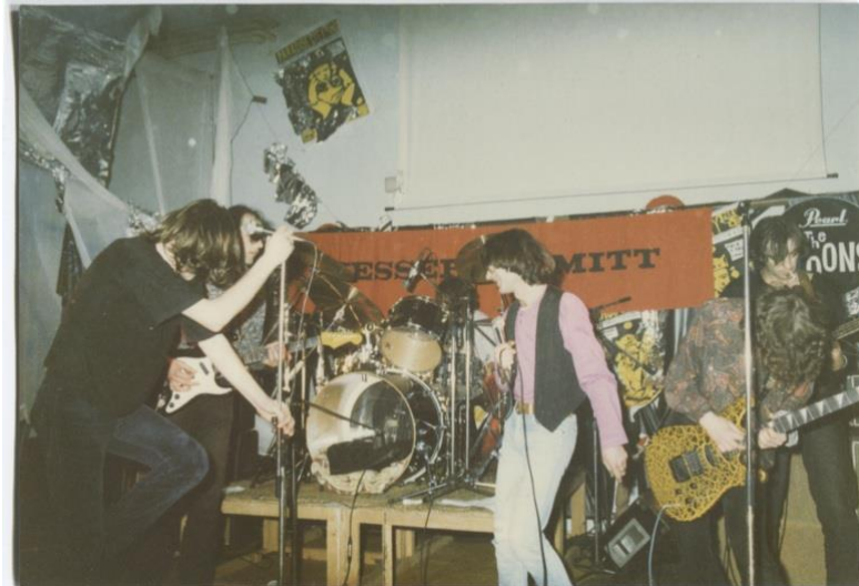
Slika 4. Koncert Messershmitta u Uljanika, jam session sa gostima iz Spoonsa, 1990. na Paradise cityju.