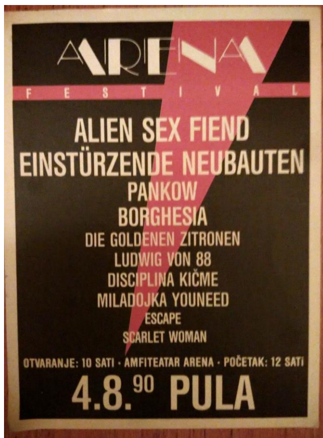
Slika 5. Plakat Arena festivala. 19