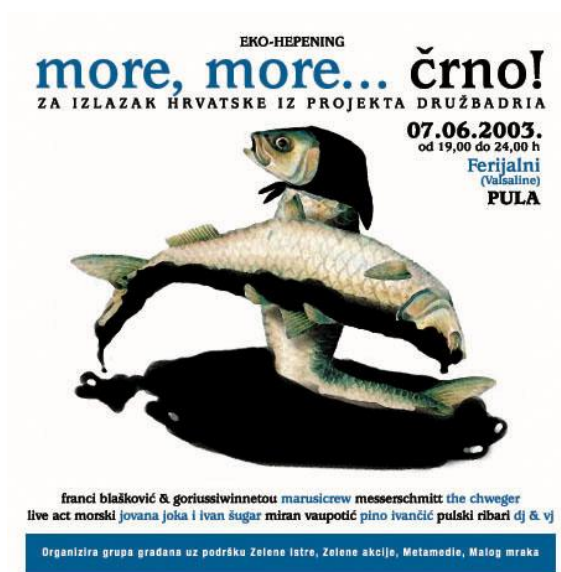
Slika 10. Plakat za zajednički eko hepening protiv projekta Družba Adria.