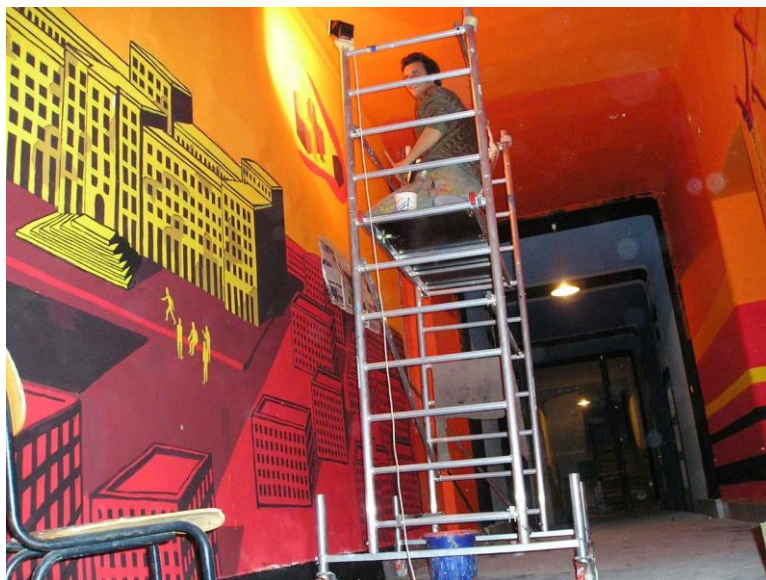
Slika 14. Projekt Krojčberg, oslikavanje zajedničkih prostora Rojca. Izvor; arhiva udruge Metamedij, 2004., autor D. Štifanić

prostorija. U listopadu 2004. završena je prva faza projekta Krojčberg kojeg je pokrenula udruga Distorzija radi oslikavanja crtežima, muralima, unutarnje prostorije Rojca i povezivanja korisnika kroz rad umjetničkih radionica. Projekt je kasnije nastavljen u suradnji više udruga, Distorzij iz Pule i Otompotom iz Zagreba i kao takav je funkcionirao do 2012.