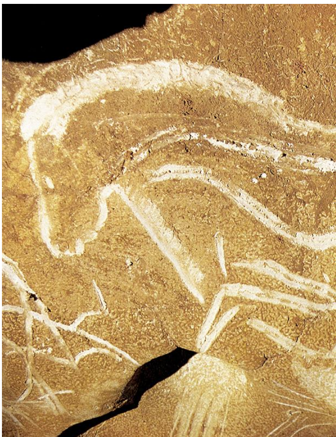
Slika. 4. Veliki konjski panel, špilja Chauvet, Francuska.

Na jednoj od slikarija iz špilje Chauvet prikazana je scena s lavovima, velik dio zida koji se nalazi desno od središnjeg udubljenja ima velik broj oslikanih životinja. Iz orinjačkog je razdoblja. Cjelokupna scena prikazuje lov. S desne se strane nalaze nosorog i mamut. S lijeve strane, tu su i četiri glave bizona, i dva nosoroga. Prikazano je sedam bizona koje ponosno goni šesnaest lavova. Prije cijele ove drame, u različitim razmjerima, vidi se lice lava mladunčeta. Gotovo sve životinje na ovoj podlozi si liče. Ovaj sastav je jedinstven u paleolitičkoj umjetnosti. 40