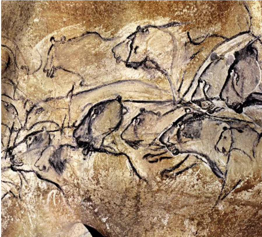
Slika. 5. Prikaz lavova na stijeni, špilja Chauvet, Francuska.

Vrlo karakterističan primjer je figura od bjelokosti mamuta pronađena na njemačkom lokalitetu Hohlenstein-Stadel koja prikazuje ljudsko biće s glavom lava. 41 Nastala je nešto kasnije nego slika u Chauvetu. Stara je oko 32.000 godina. Visina joj je 28,1 cm, a širina 6,3 cm. Pronađena je u nekoliko dijelova, dok djelovi prednjeg dijela tijela nedostaju. Stav i mišićavost čovjeka ukazuju da stoji na vrhu prstiju s rukama na bokovima. Lijeva nadlaktica označava rezove koji bi mogli predstavljati tetovaže ili ožiljke. Glava gleda prema naprijed, dok pogled naglašava snažne linije čeljusti sa uspravnim ušima. Postavlja se pitanje je li to čovjek koji je nosio “lavlju frizuru” ili neko nadnaravno biće. 42