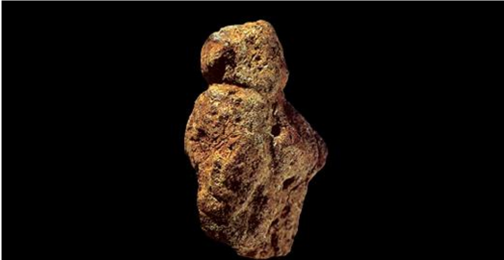
Slika 2. Figurica iz Berekhat Rama, Izrael.

pogled ne nalikuju figurici. Nastala je prirodnim putem, a onda dolazi do dodatnih namjernih izmjena ljudskom rukom. Prirodni oblik koji ukazuje na ljudski oblik oblikovan je kao ženski lik. Figurica je pronađena u Izraelu i sad se nalazi u Muzeju Izraela, u Jeruzalemu. Visina joj je 3,5 cm. 17