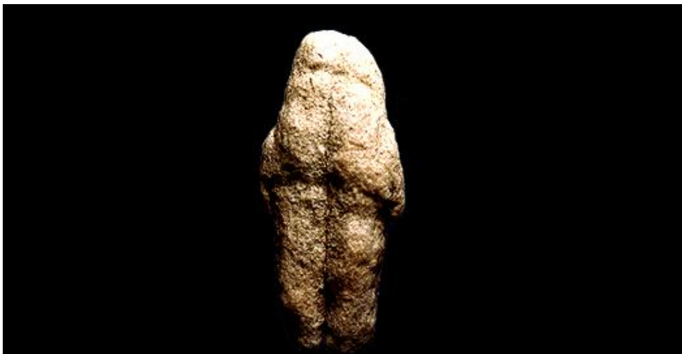
Slika 1. Figurica iz Tan-Tana, Maroko.

Figurica iz Tan-Tana, iz ašelskog razdoblja, stara 500.000 do 300.000 godina. Cjelokupni oblik ovog malog šljunčanog kamena sličij ljudskom liku. Prirodnog je materijala i čovjek ga nije mjenjao. Pronađen je u blizini kamenih alata. Moguće je da ga je sačuvao netko tko je primjetio njegov ljudski oblik. Ispitivanja pod mikroskopom govore da je ljudska ruka oblik tijela figurice vjerojatno dodatno, namjerno naglasila. Figurica je pronađena u Maroku. Visina joj je 5,8 cm, širina 2,6 cm i debljina 1,2 cm. 16