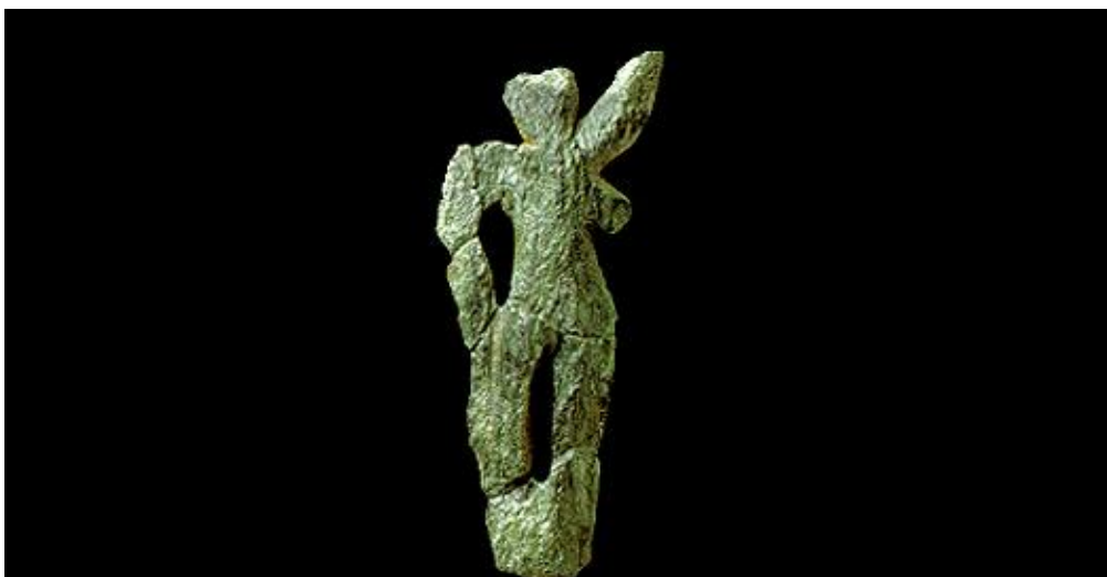
Slika 7. Figura koja pleše, Galgenburg, Austrija.

Pronađena je na nalazištu Galgenburg, u Austriji, čuva se u Prirodoslovnom muzeju u Beču. Figura je pronađena razbijena u osam komada u blizini logorske vatre na otvorenom mjestu. Napravljena je s velikom vještinom i umijećem od atraktivnog oblutka. Desnu ruku drži iznad glave, a lijeva ruka joj stoji uz tijelo. Ramena su joj malo prema naprijed, dok su koljena lagano savijena. Poza predstavlja pokret u plesu. Takvo kretanje je izuzetno među prvim skulpturama koje prikazuju čovjeka, koje češće imaju nepokretan stav. Pretpostavlja se da sudjeluje u ritualu slavlja. 43