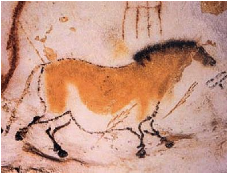
Slika 3. Prikaz konja oslikanog okerom i bioksidom mangana, špilja Lascaux, Dordonja, Akvitanija, Francuska.

Paleta boja je izuzetno reducirana, sačinjena uglavnom od mineralnih pigmenata. Većinom, paleolitičko slikarstvo je crvene i crne boje. Za dobivanje crne boje koristio se ugljen ili bioksid mangana, dok se crvena boja dobivala iz oksida željeza ili hematita. 28