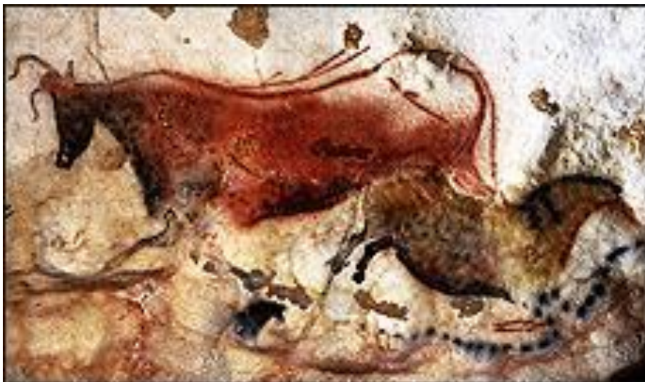
Slika 9. Bik i kineski konj, špilja Lascaux, Francuska.

Na lijevoj strani slike iz špilje Lascaux (slika 10) prikazan je crveni bik, dok se na desnoj strani nalazi kineski konj iz vremena madlenske kulture, datira se oko 15.000 godina prije sadašnjosti. Ljudi su se koristili mineralnim pigmentima kako bi oslikali ove životinje.