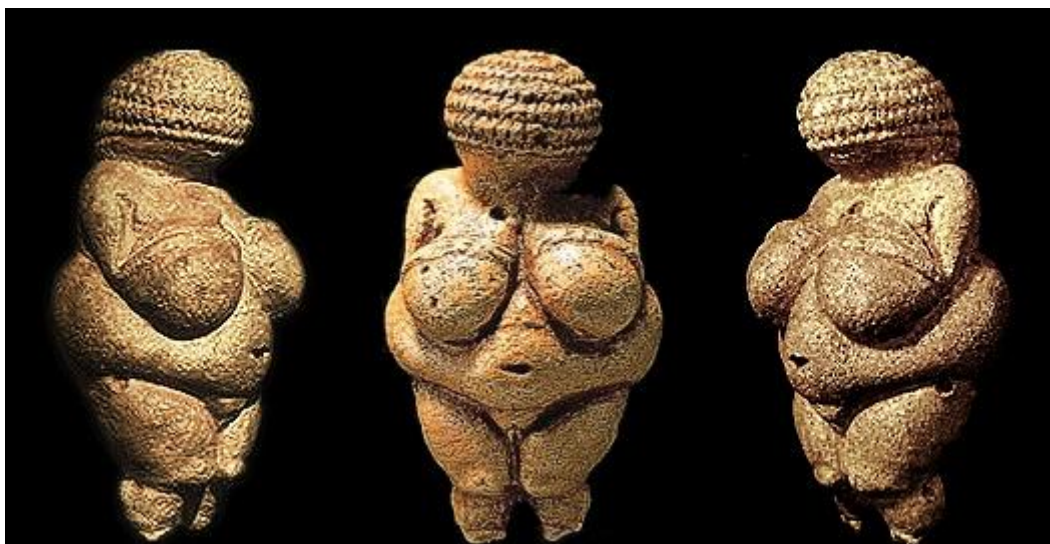
Slika 8. "Venera" iz Willendorfa, Austrija.