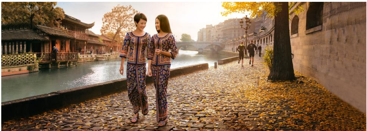
Slika 1: Singapore Girl, through the years