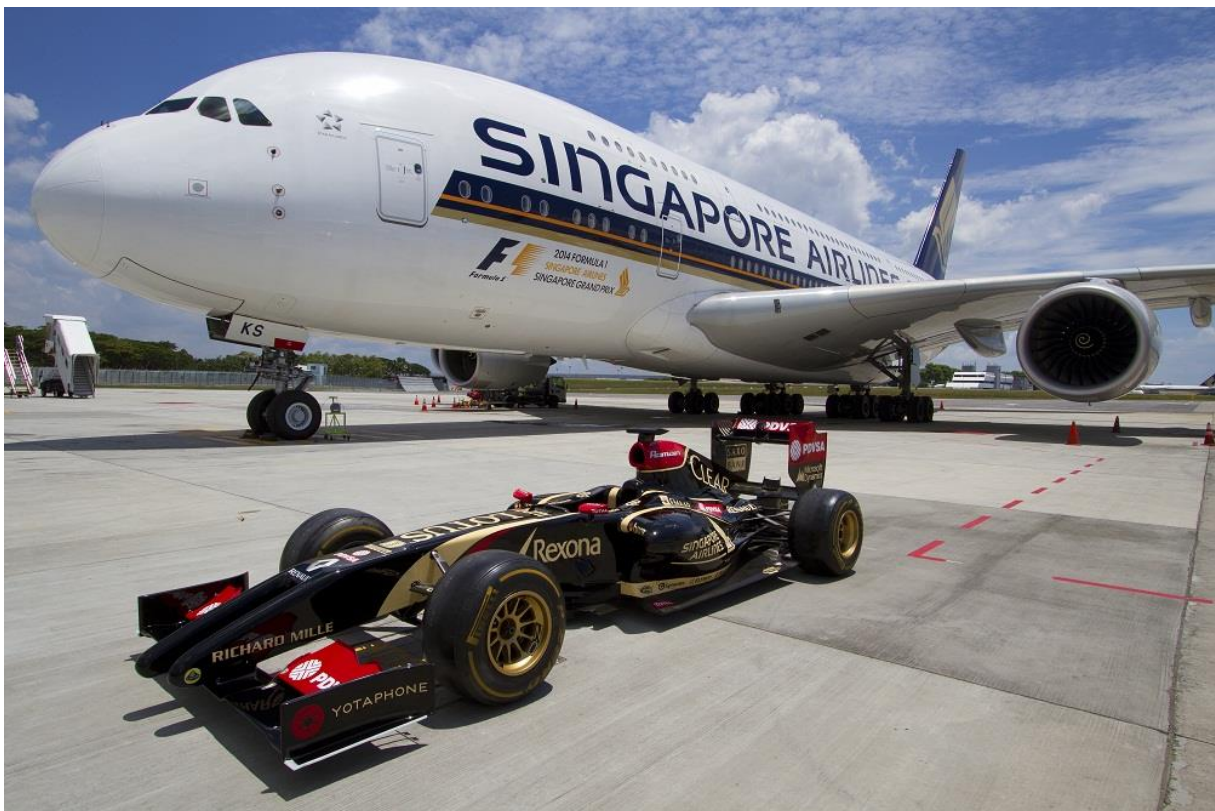
Slika 5: Singapore Airlines To Be Title Sponsor Of Formula 1 Singapore Airlines Grand Prix