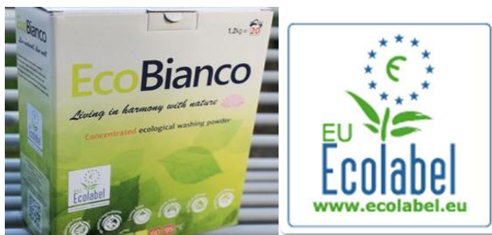
Slika 7: Prvi hrvatski proizvod kojem je dodijeljen znak EU Ecolabel, deterdžentu EcoBianco