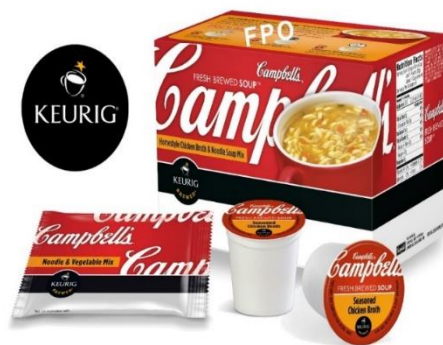
Slika 2: Primjer uspješnog proizvoda, Campbell juhe