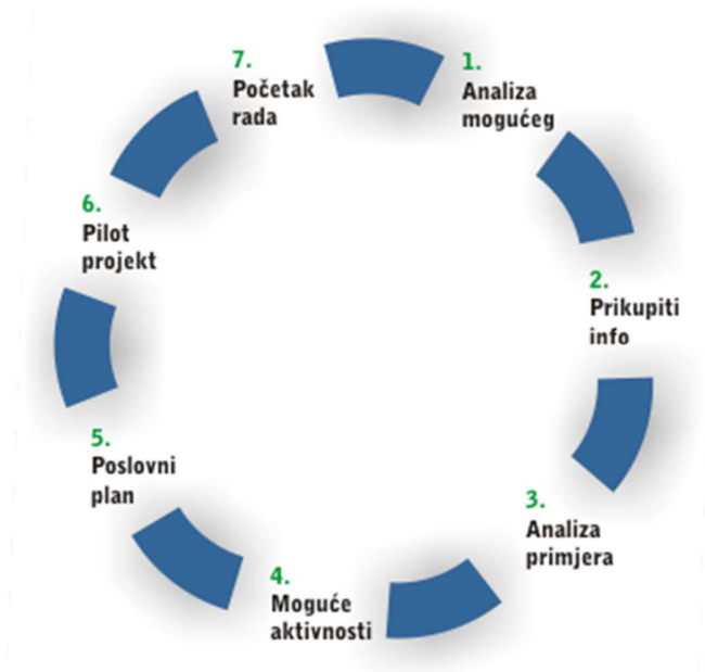
Slika 3. Koraci pri kretanju u poduzetnički projekt