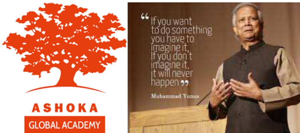
Slika 1. Ashoka logo i Muhammad Yunus, član Ashoka Global Academy