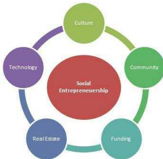
Slika 2. Stvaranje društvenoekonomskih veza koje rezultiraju koristima za društvo