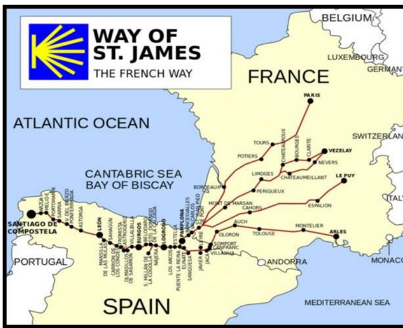
Slika 1. Četiri najvažnije kopnene rute u srednjem vijeku

drugu polovicu 12. stoljeća. 23 Iz naših su krajeva također hodočasnici odlazili u Santiago, kao jedno od tri najveća sveta mjesta, odnosno velika hodočašća.