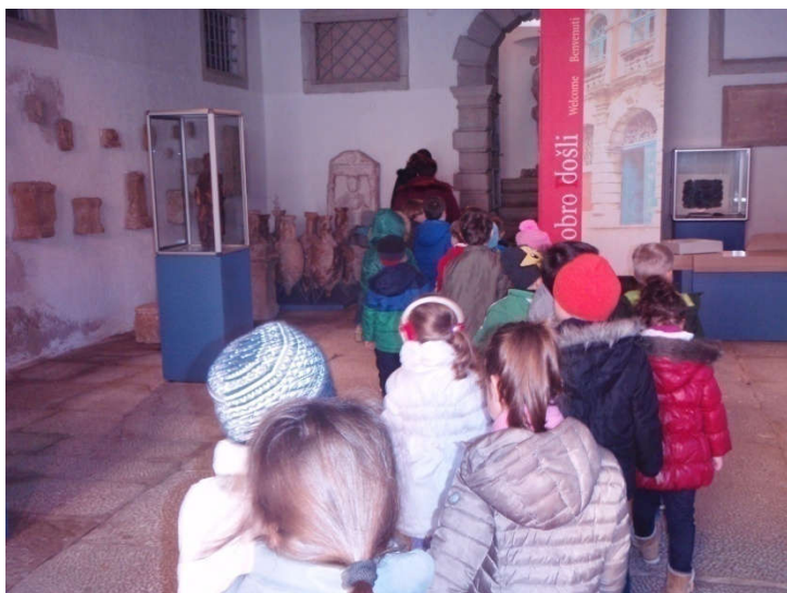
Slika 24. (pedagoška dokumentacija Dječjeg vrtića " Pjerina Verbanac", Labin.)