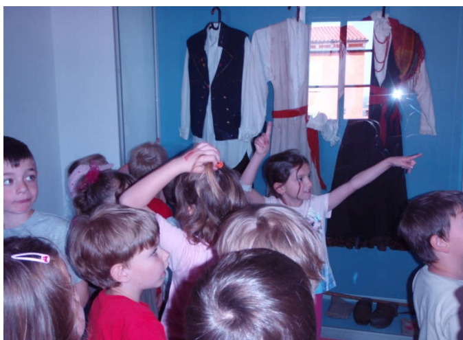
Slika 25. (pedagoška dokumentacija Dječjeg vrtića " Pjerina Verbanac", Labin.)

Kako bismo djecu potaknuli na istraživačke aktivnosti, trebalo bi s djecom posjećivati muzejske prostore kako bi u njima potaknuli kreativnosti i maštu te kako bi kroz razna istraživanja i eksperimentiranja učila na zanimljiv i interesantan način o novim spoznajama i činjenicama. Kakvoća i bogatstvo djetetova okruženja pozitivno djeluje na njegov razvoj. Struktura i organizacija okruženja utječu na djetetovo ponašanje i akcije te na komunikaciju i interakciju s vršnjacima i odraslima. Obogaćivanje ranog djetetova okruženja znači, između ostalog, i djelatniju uporabu muzejskih prostora u edukacijske svrhe. (Rosić, op. cit. str., 265-278).