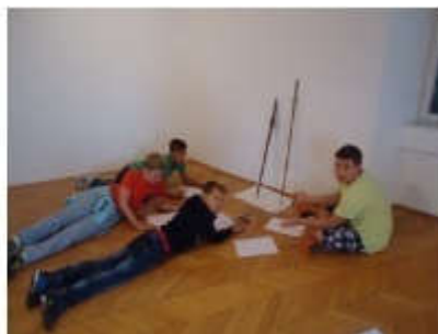
Slika 20. Dječji posjet muzeju