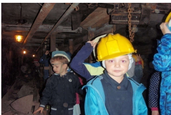
Slika 23. (pedagoška dokumentacija Dječjeg vrtića " Pjerina Verbanac", Labin.)