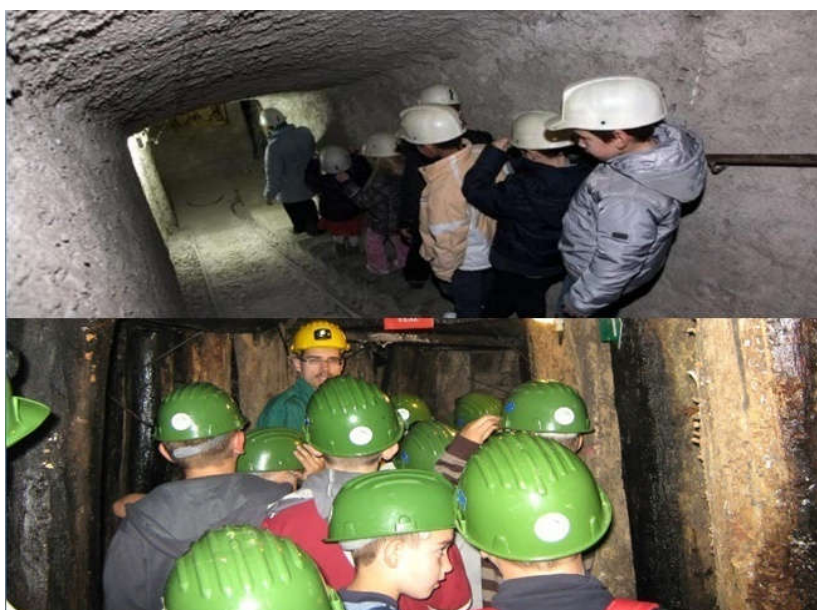
Slika 19. Dječji posjet rudniku (pedagoška dokumentacija Dječjeg vrtića " Pjerina Verbanac", Labin.)

Osim vrtića, u razne aktivnosti uključuju se i učenici nižih razreda labinskih osnovnih škola. U utorak 15. 9. 2015. učenici petih razreda Osnovne škole Matije Vlačić su se u povodu početka obilježavanja Tjedna mobilnosti pod ovogodišnjim