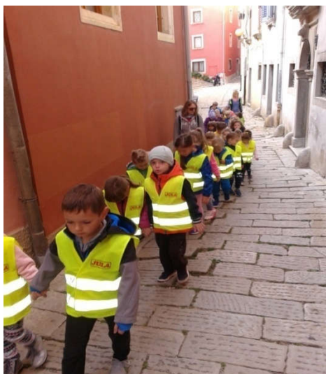
Slika 21. Obilazak Staroga grada (pedagoška dokumentacija Dječjeg vrtića " Pjerina Verbanac", Labin.)