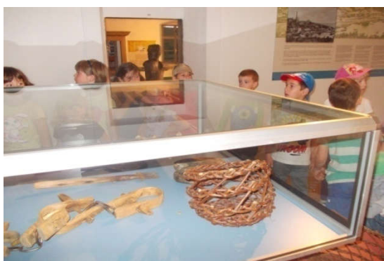
Slika 22.