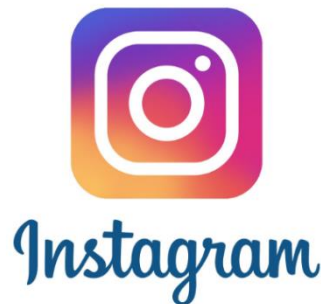
Slika 3: Instagram logo

Korisnici su od tada omogućeni da se povežu sa drugim korisnicima koji imaju Instagram profil te kao pretplatnici imaju mogućnost da prate sve njihove objave. Također, korisnici aplikacije mogu da u svoj profil „ubace“ i svoje podatke kao i da prije nego što objave neku fotografiju promijene dizajn te fotografije uz određene filtere. Ti filteri mijenjaju boju/kontrast fotografija, imamo razne okvire koji mogu znatno poboljšati izgled slike. Instagram koriste poznate ličnosti, blogeri, poznate kompanije i brendovi itd.