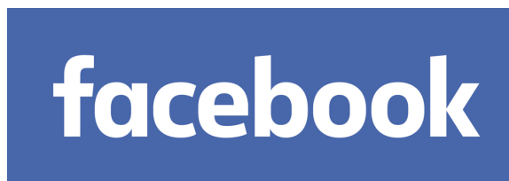
Slika 1: Facebook logo

Jedna od posebnosti Facebook-a je mogućnost kontrole privatnosti svakog korisnika. Prema vlastitim željama korisnik može sakriti svoj profil i fotografije od nepoznatih ljudi. Facebook je originalno zamišljen kao društvena mreža za umrežavanje studenata kako bi omogućila da međusobno razmjenjuju podatke, a danas je Facebook najveća društvena mreža, ali i odlična platforma za oglašavanje. Mali je broj ljudi koji nemaju napravljen svoj osobni profil. U današnje vrijeme skoro svaka tvrtka ima napravlenu Facebook stranicu svog poduzeća na kojoj objavljuje kvalitetne sadržaje na njoj. Facebook pruža i mogućnost Facebook Ads-a, usluge koja šalje poruku upravo onim ljudima koji bi mogli biti zainteresirani za proizvode ili usluge koje to poduzeće nudi. Glavna posebnost Facebook-a su brojne aplikacije koje se mogu dodati u profil. Tako je moguće igrati videoigre u Flashu sa drugim korisnicima, organizirati dražbe, rješavati psihološke testove i kvizove, dodavati omiljenu glazbu, komunicirati putem privatnih poruka te još mnogo toga.