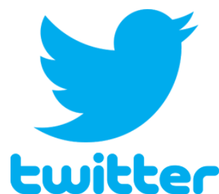
Slika 4: Twitter logo

Twitter je nastao 2006. godine. To je popularna društvena mreža i microblogging servis koji se temelji na javnom objavljivanju i primanju kratkih tekstualnih poruka/objava do 140 znakova, takozvanih "tweet-ova". Registrirani korisnici mogu objavljivati tweet-ove, dok ih neregistrirani mogu samo čitati. Korisnici izražavaju interes pretplatom na neki profil, odnosno praćenjem drugih korisnika i tako postaju njihovi pratitelji odnosno "follower-i". Naime, pomoću Twitter-a i objavama kratkih poruka može se privući veliki broj ljudi na web stranicu tvrtke, promovirati nove proizvode ili poslovne rezultate. Mogu se promovirati različiti događaji kampanje, što dovodi do jačanja brenda. Twitter se za oglašavanje može koristiti na različite načine, a vrlo lako se može priključiti veliki broj ljudi ako je osoba stalno aktivna i ako često objavljuje novi ali kvalitetan sadržaj.