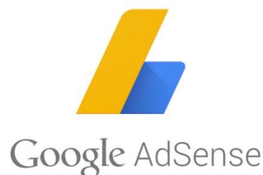
Slika 6: AdSense logo