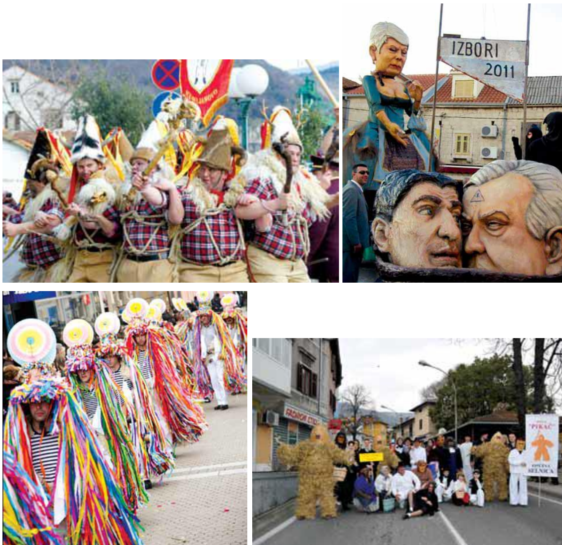
Slika 6.: Nekoliko karnevalskih likova iz različitih hrvatskih gradova