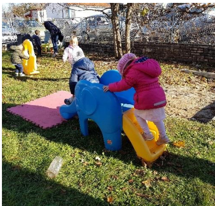
Slika 31. Igralište za djecu rane dobi