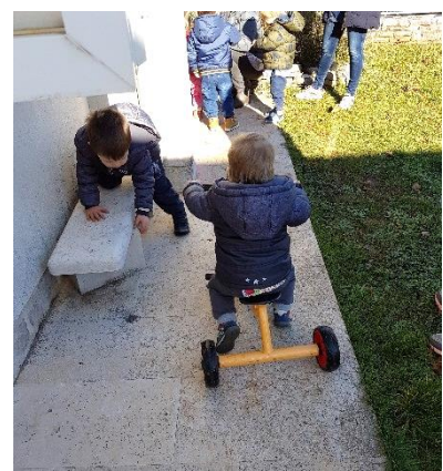
Slika 29. Dijete vozi guralicu

Da bi se izbjegle nezgode i ozljede potrebno je da sama izvedba i uređenje igrališta zadovoljavaju kriterije sigurnosti. Zato igralište za djecu rane dobi treba biti odvojeno od dijela namijenjenog starijoj, motorički spretnijoj djeci. Potrebno je redovito pregledavati prostor i ukloniti sve potencijalno opasne materijale i predmete. Igralište treba biti ograđeno i prekriveno materijalom koji će ublažiti posljedice pada (Nenadić, 2002). Na igralištu za djecu rane dobi mogu se provoditi organizirani i spontani oblici vježbanja.