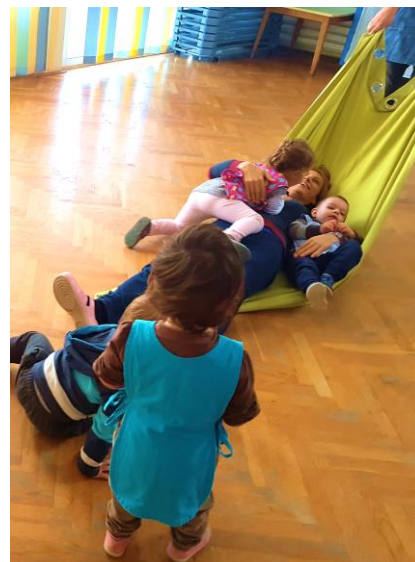
Slika 18. Povlačenje na tkanini