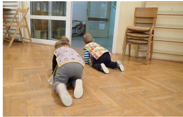
Slika 2. Spontano puzanje po dvorani