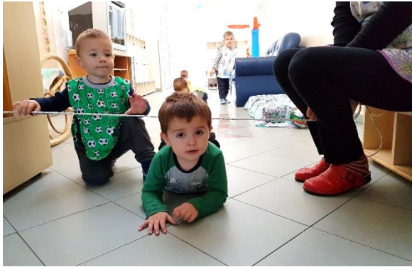
Slika 1. Provlačenje ispod špage

istezanje, npr. pljesnuti iznad glave. Puzati se može u različitim smjerovima po različitim podlogama (klupi, po tlu, po niskoj gredi), mogu se provlačiti ispod/kroz različitim prirodnih i umjetnih prepreka, ali moramo paziti da higijenski uvjeti budu odgovarajući (čisto tlo, strunjača, suh travnjak). (Findak i Delija, 2001). Puzati još možemo i uz kosinu, niz kosinu, oko prepreka, gurajući predmet ispred sebe i sl.