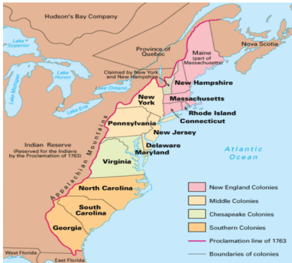
Slika 1. Trinaest britanskih kolonija 1763.g.