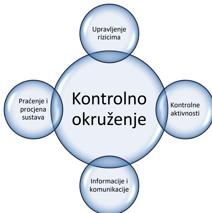
Shematski prikaz 2. Komponente sustava unutarnjih kontrola (vlastita izrada prema Zakonu o sustavu unutarnjih financijskih kontrola u javnom sektoru)

Organizacijska uspostava sustava FMC obuhvaća: