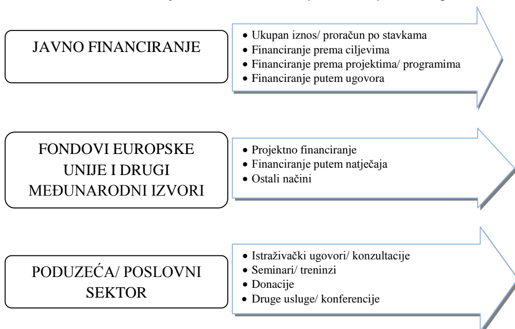
Slika 1. Izvori financiranja i načini financiranja institucija visokog obrazovanja

Prisutnost različitih izvora financiranja i raznolikosti u njihovoj zastupljenosti između europskih zemalja je velika. Sistematizacija izvora financiranja prepoznaje dvije osnovne kategorije: javno financiranje i financiranje iz drugih izvora. Javno financiranje orijentirano je na državne i lokalne proračune (ovisno o teritorijalnom ustroju i fiskalnom sustavu), a financiranje iz drugih izvora podrazumijeva: školarine, financiranje kroz pružanje usluga (savjetovanja, knjižnice, prihodi od imovine i sl.), financiranje iz ugovora s privatnim sektorom, financiranje iz donacija, financiranje iz investicijskih aktivnosti te financiranje iz fondova Europske unije.