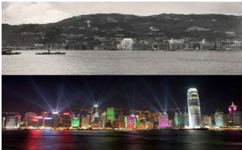
Slika 4. Hong Kong, Kina, 1920-2000.

Izvor: http://justsomething.co/before-and-after-world/ (6. svibnja 2015.)