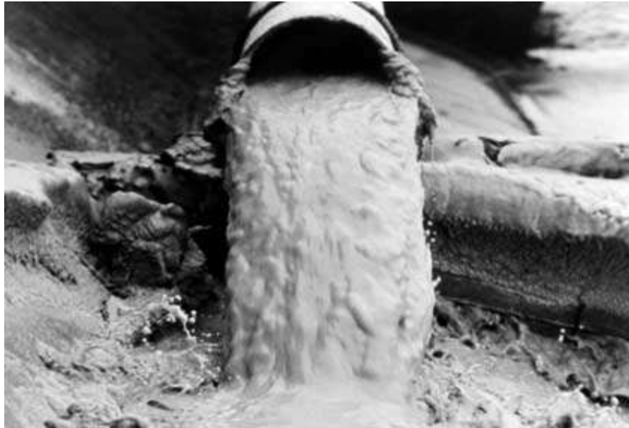
Slika 12. Minamata, 1956. godina