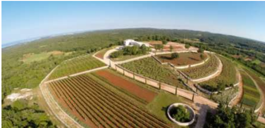
Slika 13. Park „Histria Aromatica“