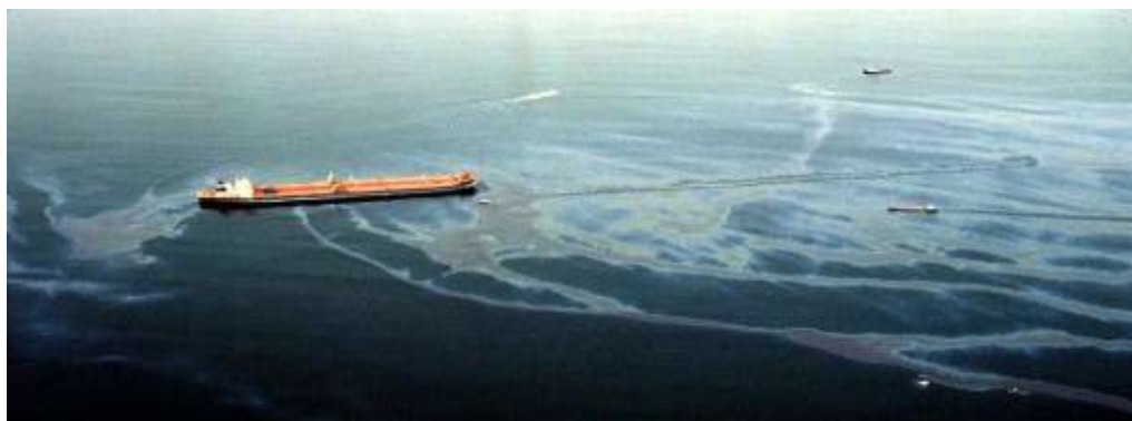
Slika 8. Havarija tankera Exxon Valdez

Izvor: http://www.hrt.hr/arhiv/ndd/03ozujak/0324%20ExxonValdez.html (10. svinja 2015.)