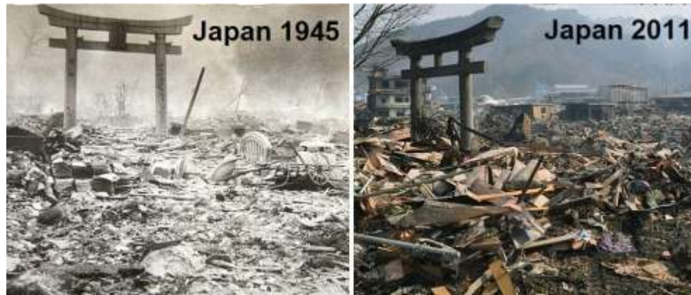
Slika 10. Nagasaki nakon bombardiranja 1945. i 66 godina kasnije