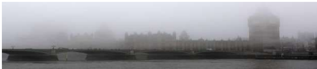
Slika 11. London, 1952. godine