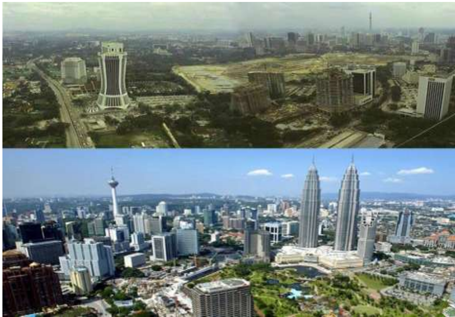
Slika 3. Kuala Lumpur, Malezija, 1990-2014.

Izvor: http://justsomething.co/before-and-after-world/ (6. svibnja 2015.)