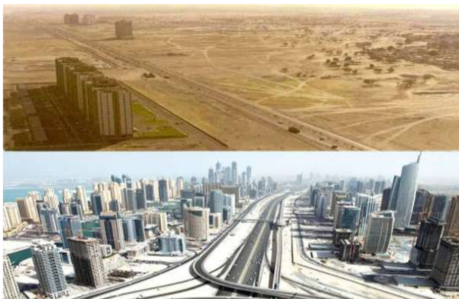
Slika 2. Dubai, Ujedinjeni Arapski Emirati, 1990-2013.