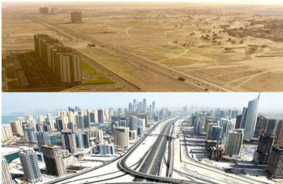
Slika 2. Dubai, Ujedinjeni Arapski Emirati, 1990-2013.

Izvor: http://justsomething.co/before-and-after-world/ (6. svibnja 2015.)