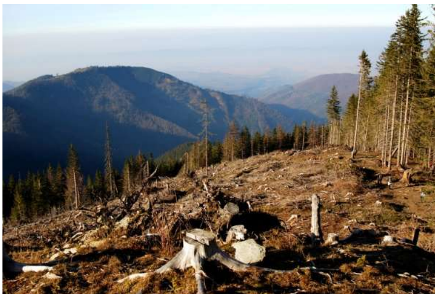
Slika 6. Deforestacija