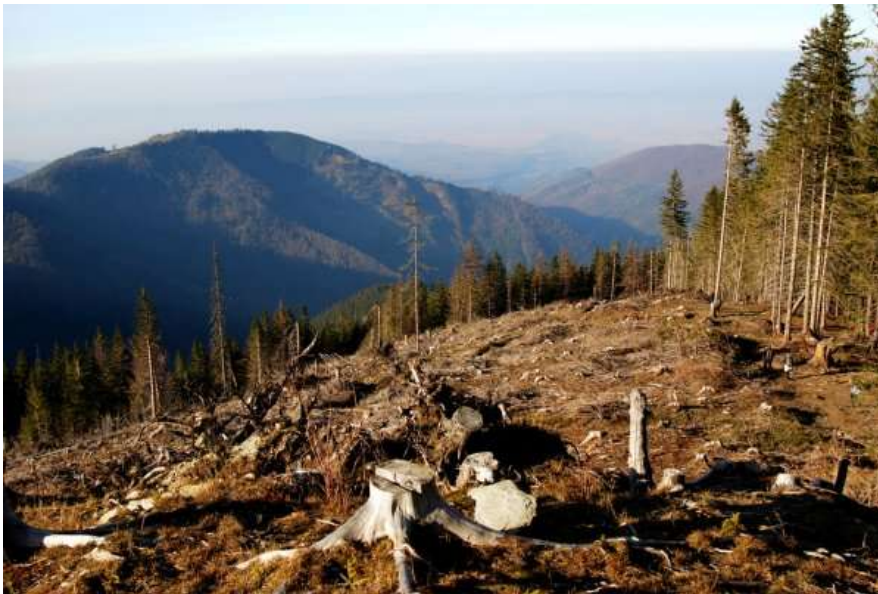
Slika 6. Deforestacija