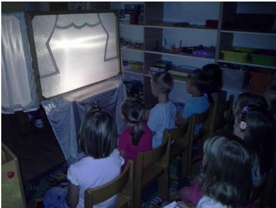
Slika 7: U iščekivanju predstave