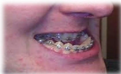
Slika 3. Progenija ili prognatija donje čeljusti