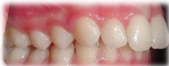
Slika 2. Protruzija gornje čeljusti

(Dostupno na: http://www.ferident.com/service/ortodoncija-ispravljanje-zuba-novi-sad/ )