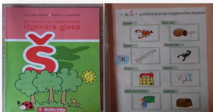
Slika 5. Vježbenica za uvježbavanje izgovora glasa /š/ (vanjski izgled i unutarnji sadržaj)

Počele smo raditi vježbe iz tablice 4., a nakon tih vježbi koristile smo vježbe iz knjige Izgovor: kako ga poboljšati (Posokhova, 2005.) za formiranje artikulacije glasa /š/. Djevojčica je otvorila malo usta i podigla jezik iza gornjih zuba, ali nije smjela dodirivati jezikom zube niti nepce, jezik je trebao visiti. U tom položaju trebala je puhati na jezik. Ispitivala sam je čuje li kako puše vjetar. Tijekom ove metode čuo se zvuk koji nalikuje na glas /h/ više nego na glas /š/. Dala sam joj uputu da puše na vršak jezika i istovremeno izgovara glas /s/. Ponavljale smo vježbu nekoliko puta. Nakon vježbanja, krenule smo s radom u vježbenici. Započele smo s riječima koje počinju slogom ša-. Riječi koje sam djevojčici izrekla, mogu se vidjeti u tablici 5. Ana je ponavljala riječi za mnom i tako poboljšala svoj izgovor. Na kraju je djevojčica bojala bojanku.