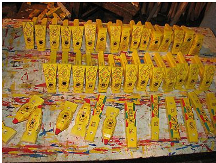
Slika 6. Svirala žveglice

Igračke izrađuju majstori drvorezbari, koji su u ovom umijeću samouki stanovnici zagorskih sela. Budući da je u 19. stoljeću na tom području bilo teško živjeti, sela su pronalazila način kako održavati svoju egzistenciju, te su se pronašli u ovoj djelatnosti koja im je i danas prilično bitan faktor u egzistenciji. Spretni samouki muškarci rezbarili su drvo te su izrađivali svirale pod nazivom žveglice (slika 6.). U početku su izrađivali jednostavnije jedinke ili dvojnice, te su ukrašavali paljenjem površine drva i time dobivali različite šare na instrumentima. Ova metoda paljenja površine drva se upotrebljava i danas te se pomoću željezne šipke zvane štruk, koja ima savijen kraj i pomoću drvenog držača stavlja šipka u vatru i usijanim dijelom se pali površina svirale.