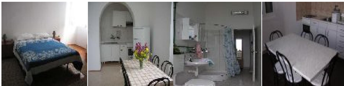
Slika 16: Unutrašnjost svjetionika Struga