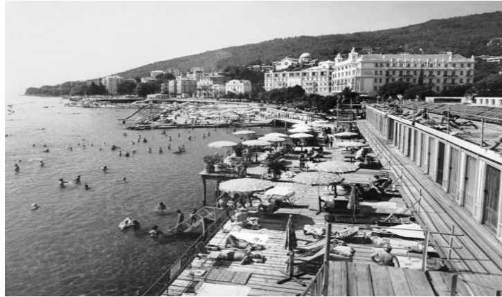
Slika 3. Kupalište Slatina u Opatiji

Primjer početnog artikuliranja kupališnog prostora je i drveni objekt koji je bio podignut na predjelu Slatine (Slika 3) i sagrađen u stilu drvenih koliba.