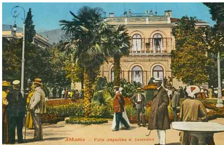
Slika 1. Villa Angiolina

Štoviše, početak hrvatskog hotelijerstva započinje upravo u njoj, gradnjom Ville Angioline 1844. godine (Slika 1).