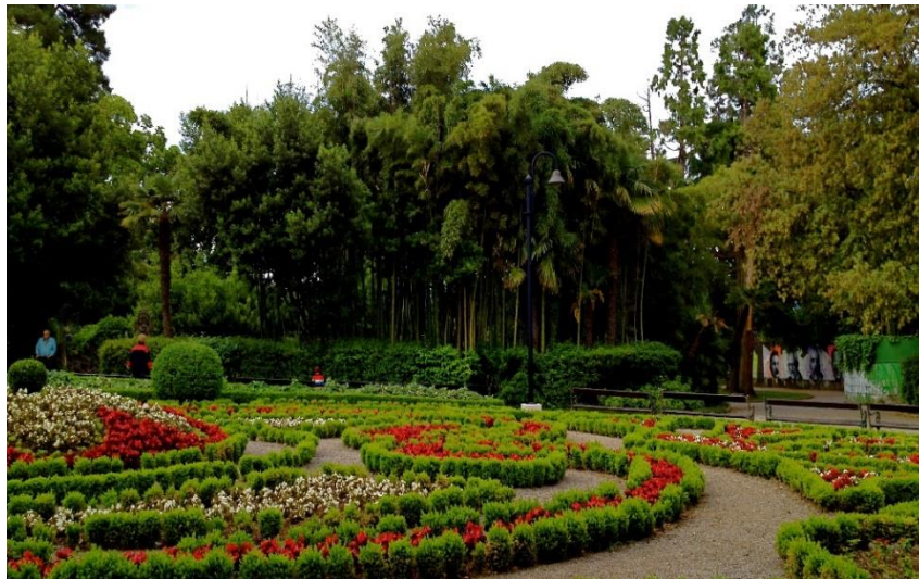
Slika 4. Botanički vrt

Na imanju je posebno uređen egzotičan park, botanički vrt (Slika 4) s rijetkim primjercima suptropske flore. 55 U neposrednoj blizini elegantne ville zasađene su magnolije, sekvoje, libanonski cedar te himalajski čempres. Turisti su se za vrijeme boravaka u ovoj prekrasnoj villi mogli okrijepiti u mliječnoj konobici uz morsku obalu gdje je bilo i malo pristanište s ostavom za brodice.