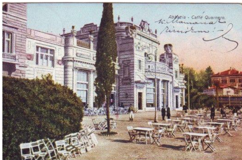
Slika 2. Hotel Kvarner

Usporedno s time iduće se godine događa izgradnja hotela Kvarner (Slika 2). Književni časopis Vijenac u broju 50 iz 1882. godine govoreći o važnosti koju Opatija ima za zdravlje, piše: „Bolesna duša i mlohavo tijelo i krvareće srdce naći će tuj pokoj, lijeka, prirodne svježine, koja jače i sigurnije oporavlja nego i jedno ljudsko sredstvo.“ 11 U sezoni 1883-84. Opatija je imala 1.412 posjetitelja, pa se tako ta sezona smatrala i začetkom modernog turizma u Opatiji. Opatija je na taj način prozvana kamenom temeljcem za razvoj turizma na Kvarneru.