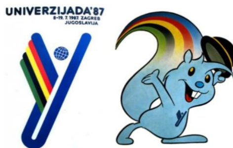
Slika 8. Logotip i maskota Univerzijade Zagi

Univerzijada je imala veliki značaj radi bogatog sportskog programa, ali bitne stavke bile su organizacija i pripreme. Gradili su se mnogi objekti: Rekreativno sportski centar Jarun, Plivački i vaterpolo centar ASD mladost, Rekreativno sportski centar Šalata, stadion Dinamo i Dom sportova. Radi bolje infrastrukture izgradio se autobusni kolodvor, dok je željeznički kolodvor bio obnovljen. Unatoč krizi i inflaciji, Zagreb i njegova okolica doživjeli su „infrastrukturnu renesansu“. Realizirali su se poslovi na raznim područjima djelatnosti: sport, organizacija izgradnje, financije, marketing, organizacije boravka, informiranja i propagande, tiska i izdavaštva, kulture i zabave, općih poslova, elektroničke tehnologije itd. (Zekić, 2007: 3) Veliki značaj dobio je i kulturni program kao promidžba organizatora. Značajan dio vezan za kulturu bilo je otvaranje velikog broja muzeja i galerija s mnogo različitih izložbi u tijeku trajanja Univerzijade. Teme nisu isključivo bile sportske već se prezentirala nacionalna baština i tradicija što je privuklo velik broj domaćih i stranih posjetitelja.