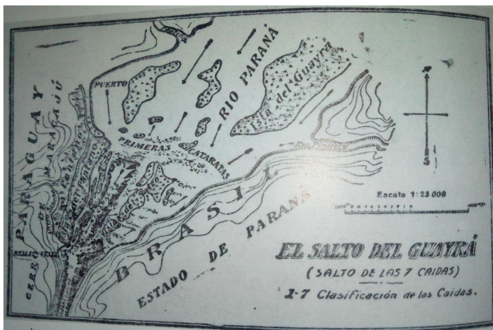
Slika 3. Karta slapova El Salto del Guayra

Punih osam dana su fotografirali i izrađivali crteže tih slapova. Braća Seljan smatrala su da se takvo čudo na zemlji može promatrati samo jedanput.