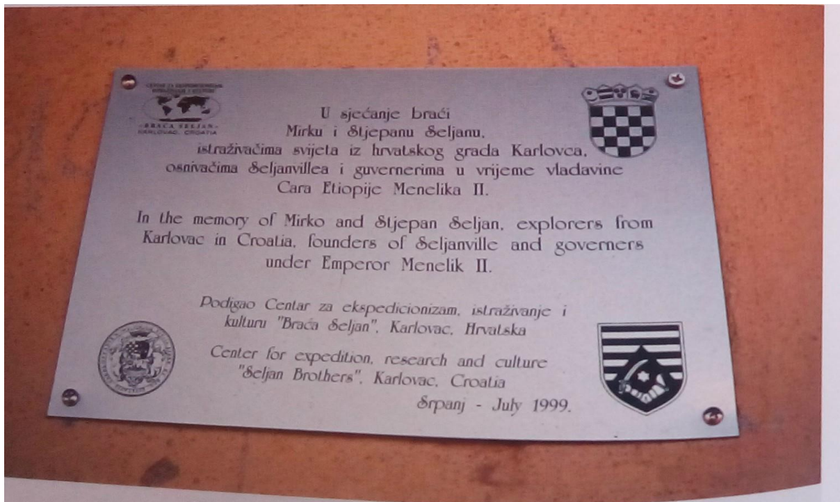
Slika 2. Ploča u spomen Seljanvilla i njegovih osnivača