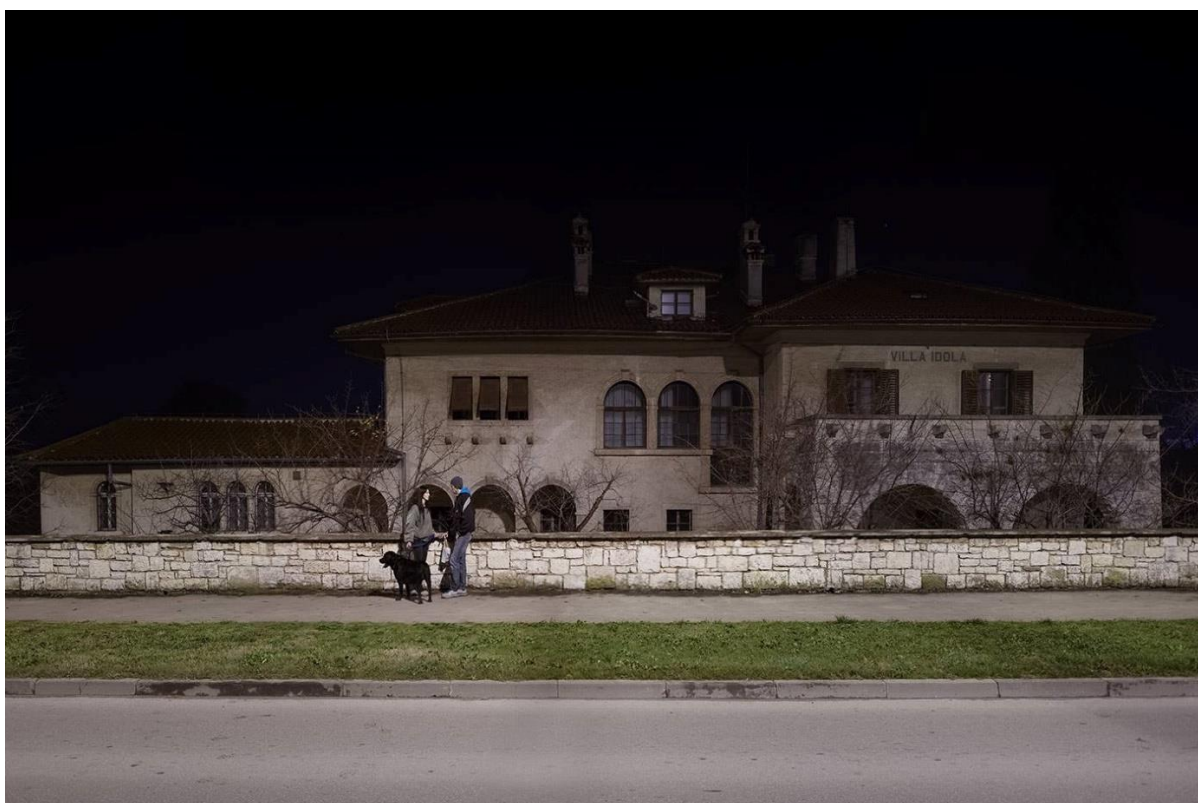
Slika 10: Vila Idola

Kasnije, plemkinja Eleonora za svojeg izabranika uzima mladog austro-ugarskog časnika Alfonsa von Klossa, tada na dužnosti u Puli. Kloss se rodio 1880., a školovanje završava u obližnjoj Rijeci na Pomorskoj akademiji. Mladi Kloss bio je na mnogim dužnostima na brodovima mornarice, a 1914. iz zastavnika promaknut je u čin poručnika linijskog broda. Dužnosti je nastavio obavljati u Puli, a bio je zadužen za obranu lokalnog područja na brodovima torpedne grupe. Kloss je, sa suprugom princezom Eleonorom i obitelji, do pada Monarhije živio u Puli, a potom se cijela obitelj seli u Austriju.