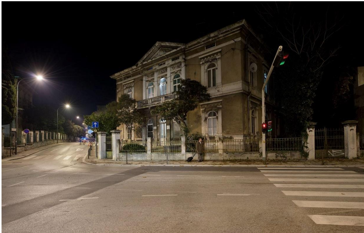
Slika 3: Vila Monai

S vremenom se u tom okruženju dižu još dva građevinska zdanja koja zaokružuju prostor, oba veća i veličanstvenija. Vila Monai pored palače nadvojvode Karla Stephana Habsburg-Lotringen izgledala je čak i skromno.