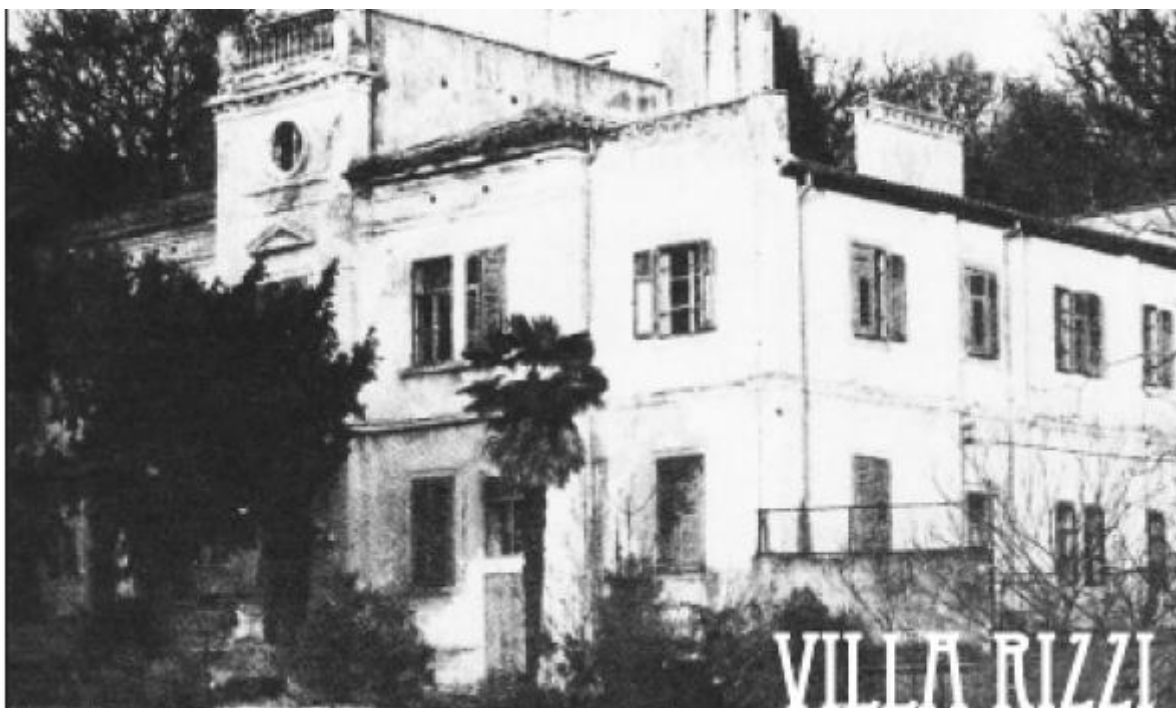
Slika 12. Vila Rizzi