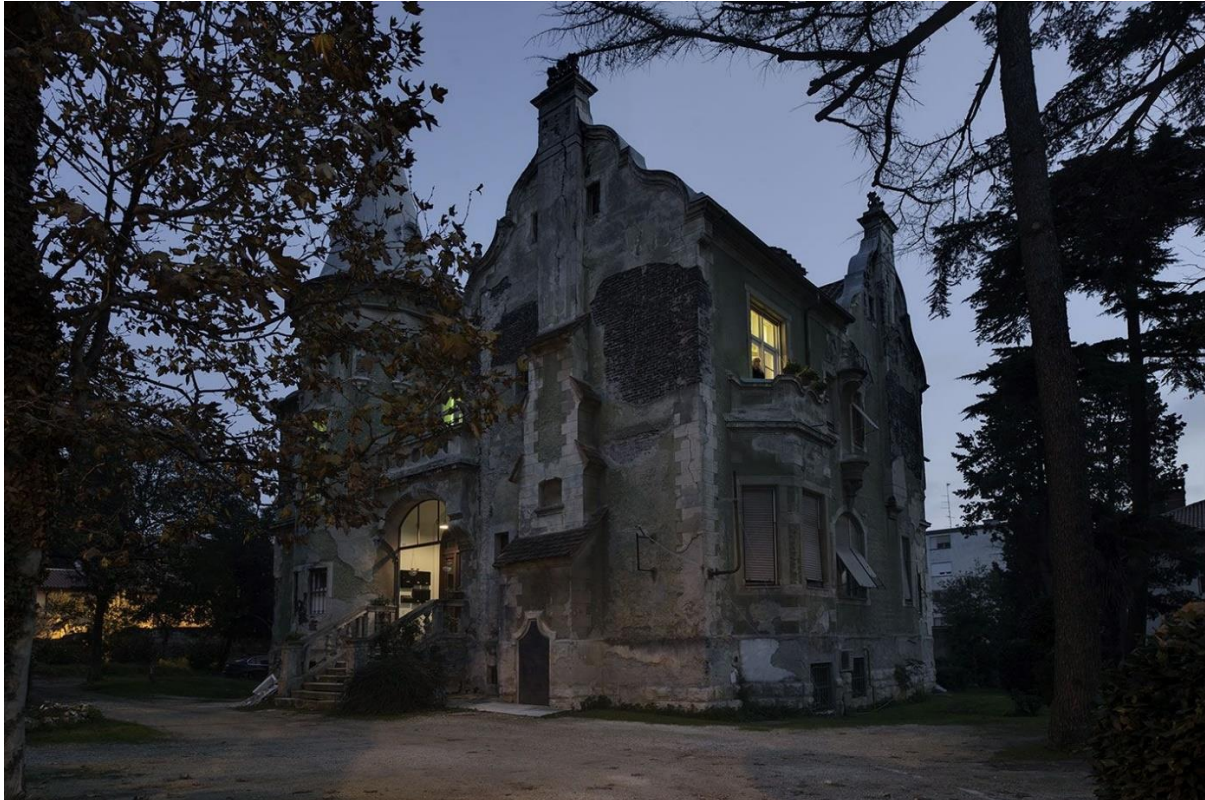
Slika 7: Vila Horthy

Nakon svojeg vojnog napretka, Horthy seli u novoizgrađenu vilu koja po njemu dobiva i ime. Nalazila se u novoj gradskoj elitnoj četvrti na Verudi i bila je okružena drugim elitnim vilama. Sve su te vile bile iznimno bogate, namijenjene isključivo višem sloju građanstva, onima koji su si mogli priuštiti izgradnju samostojećih stambenih objekata.