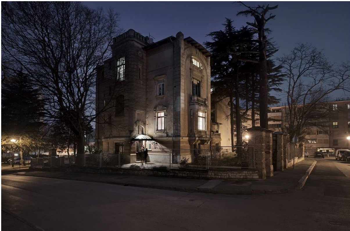
Slika 9: Vila Mendelein