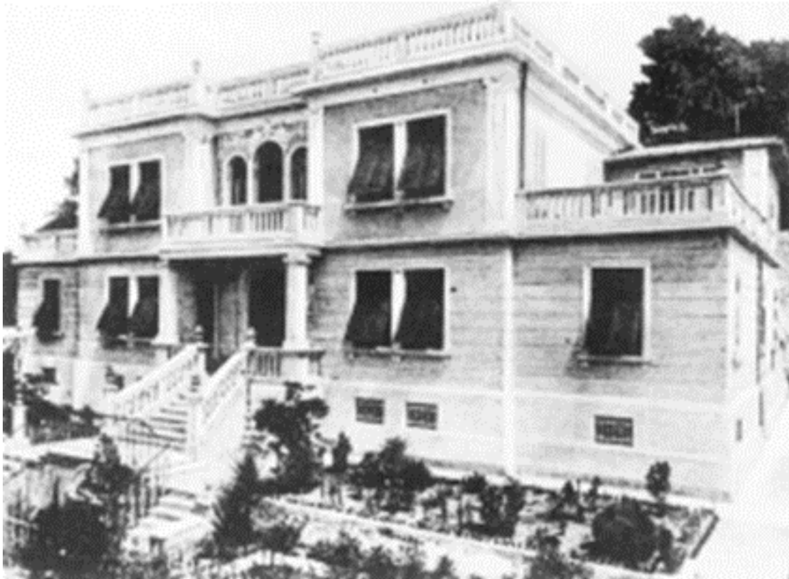
Slika 11. Vila Petinelli