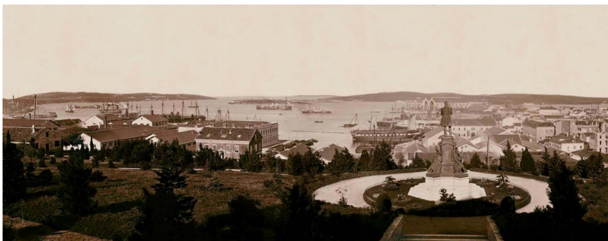
Slika 1. Panorama pulske luke s Monte Zara 1890.

Urbanistički razvoj od tog dana nadalje razvijao se sukladno ulozi grada u Monarhiji. Glavno uporište bila je luka koja je imala prednost kod izgradnje, a potom se nastavio graditi arsenal za izgradnju brodova i njihovu opskrbu te fortifikacijski sustav za obranu luke s kopna i s mora. Pula je postala sjedište lučkog admiraliteta, lučke kapetanije, zapovjedništva pomorskog okruga, tvrđavnog zapovjedništva, hidrografskog zavoda te povremeno sjedište biskupa Poreča i Pule. Sve su te institucije zahtijevale građevinsku infrastrukturu (Trogrlić i Stepanić, 2007: 19).