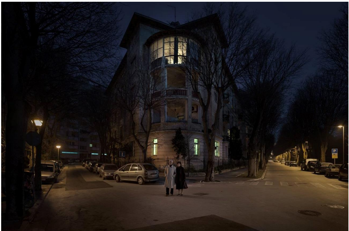
Slika 6: Vila Münz

Zanimljivo je da se u arhitektonski historicizam ovih zgrada upliće moderan secesijski stil koji prepoznajemo po nizu dekoracija na pročeljima, pogotovo po florealnim motivima. Još nekoliko Münzovih građevinskih objekata izgrađeno je u tzv. mladenačkom stilu, odnosno jugendstilu, a radi se upravo o aglomeratu građevina nedaleko željezničkog kolodvora (Perović, 2011).