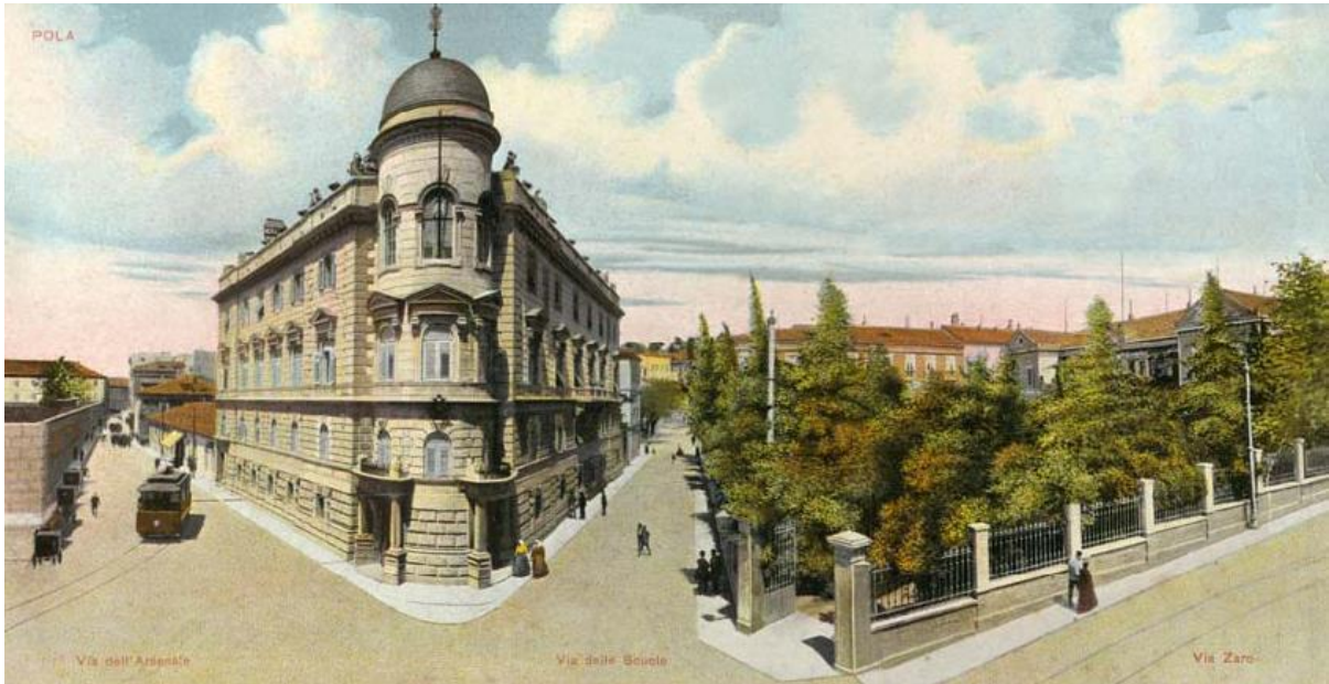
Slika 4: Palača Karla Stephana u ulici Zaro

Nadvojvoda Karl Stephan bio je ujedno i kontraadmiral i komodor K. u. K. jahtaškog kluba, a njegova palača stajala je odmah njemu preko puta. Bila je to onovremeno najprepoznatljivija građevina u gradu, pravokutnog oblika, trokatnica izgrađena 1892. blokovima istarskog kamena. Prednju glavnu stranu pročelja krasio je okrugli oblik, a na vrhu i kupola.