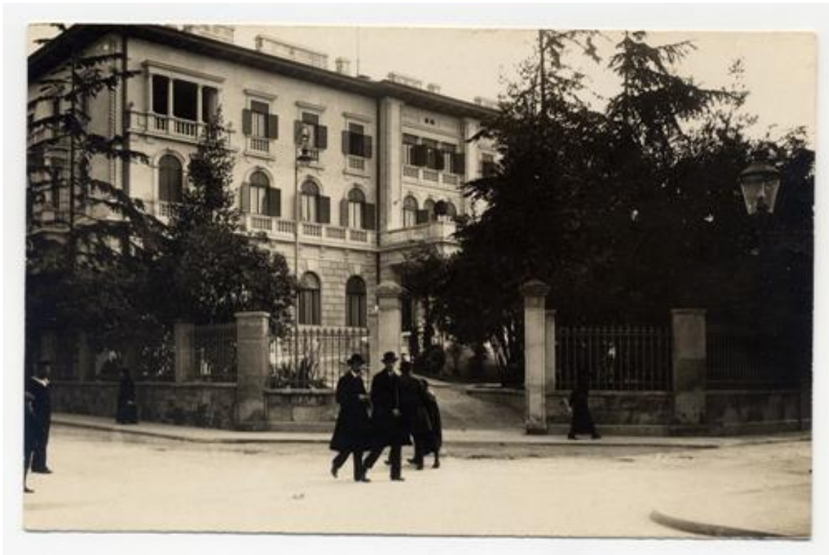
Slika 5: Marine Casino