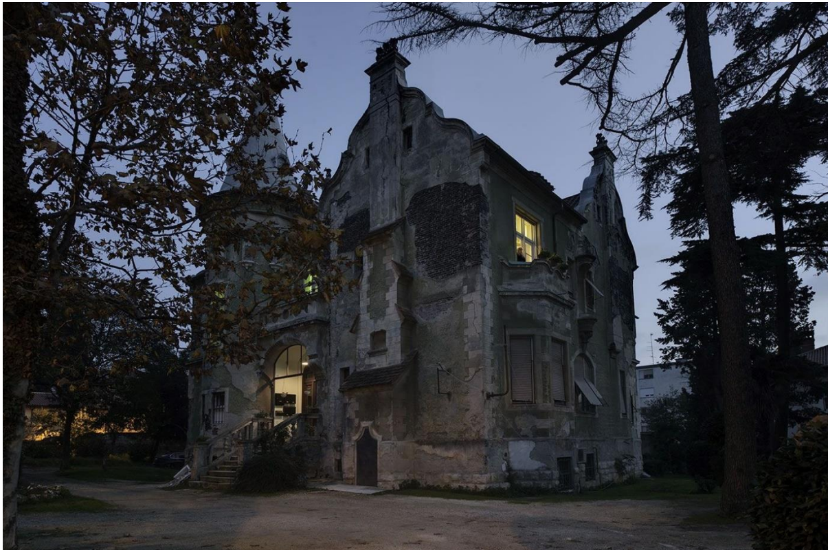
Slika 7: Vila Horthy

Nakon svojeg vojnog napretka, Horthy seli u novoizgrađenu vilu koja po njemu dobiva i ime. Nalazila se u novoj gradskoj elitnoj četvrti na Verudi i bila je okružena drugim elitnim vilama. Sve su te vile bile iznimno bogate, namijenjene isključivo višem sloju građanstva, onima koji su si mogli priuštiti izgradnju samostojećih stambenih objekata.