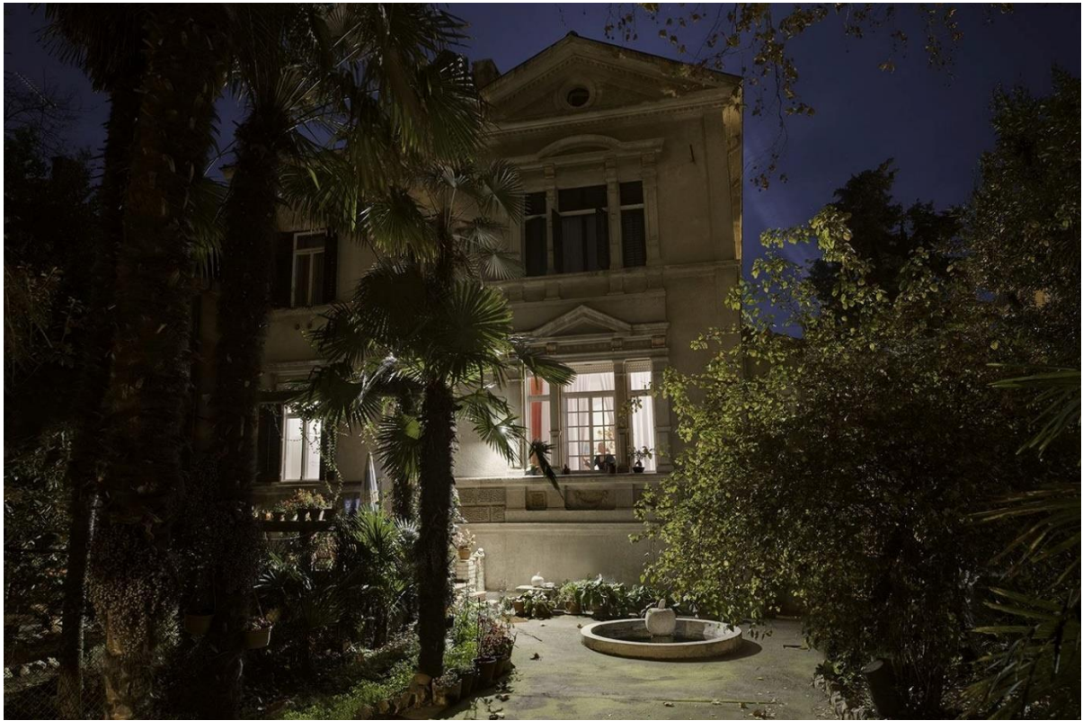
Slika 8: Vila grofa Maximiliana Bissingena und Nippenburga

suglasnosti za izgradnju objekta koji je potpisao ugledni susjed Herr K. u. K. Kaemmerer und Corvetten Capitan von Pietruski (Perović, 2011: 190-191).