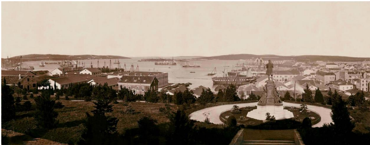
Slika 1. Panorama pulske luke s Monte Zara 1890.

Urbanistički razvoj od tog dana nadalje razvijao se sukladno ulozi grada u Monarhiji. Glavno uporište bila je luka koja je imala prednost kod izgradnje, a potom se nastavio graditi arsenal za izgradnju brodova i njihovu opskrbu te fortifikacijski sustav za obranu luke s kopna i s mora. Pula je postala sjedište lučkog admiraliteta, lučke kapetanije, zapovjedništva pomorskog okruga, tvrđavnog zapovjedništva, hidrografskog zavoda te povremeno sjedište biskupa Poreča i Pule. Sve su te institucije zahtijevale građevinsku infrastrukturu (Trogrlić i Stepanić, 2007: 19).