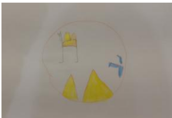
Slika 34. Luna, 4,5 godina: „ Čizme su oputovale u pustinju, u pustinji su zezale devu. “