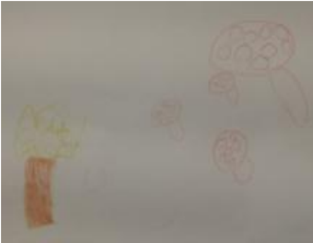
Slika 41. Franka, 5 godina: „Čizme su u šumi i beru gljive.“