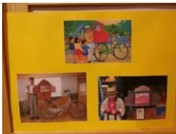
Slika 28. Kamishibai pripovjedači