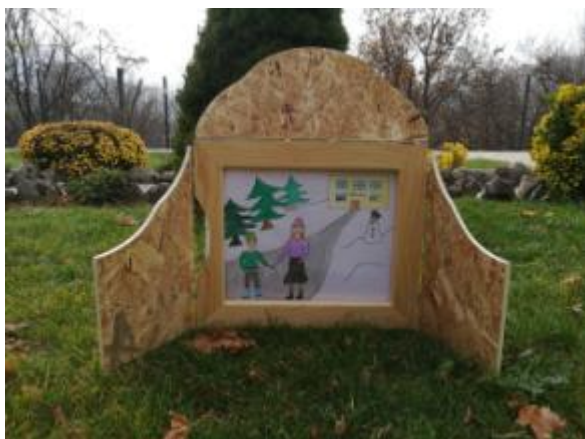
Slika 15. Ilustracija 2.