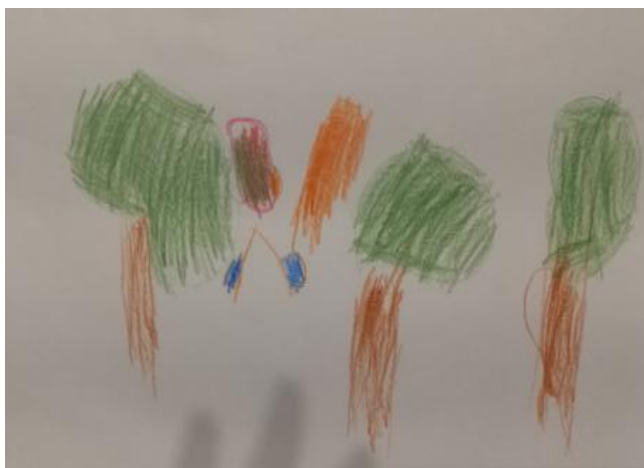
Slika 40. Ena, 5 godina: „Čizme idu kroz šumu i traže prijatelje za se igrati.“