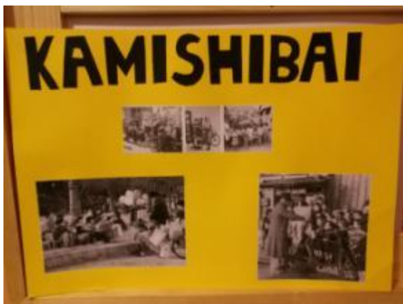
Slika 27. Kamishibai pripovjedači