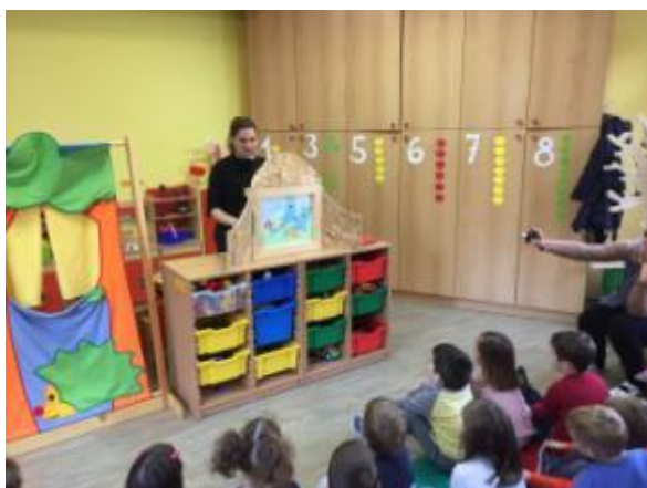
Slika 29. Izvedba Izvor: Odgojiteljica, 27.11.2017.