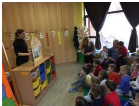
Slika 30. Djeca prate priču