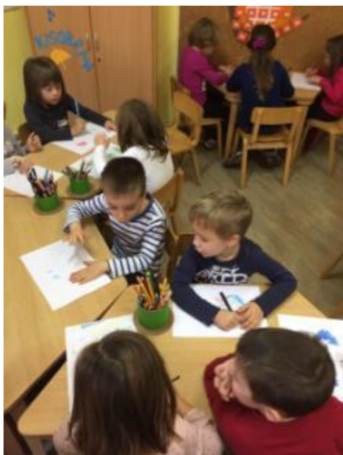
Slika 33. Rad na nastavku priče