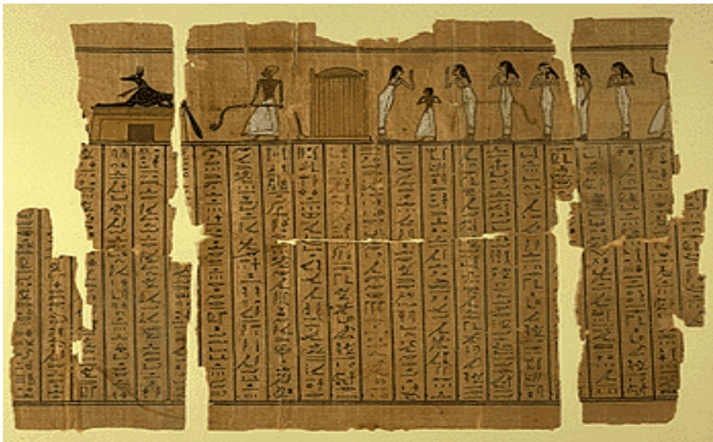
Slika 1. Papirus Knjige mrtvih