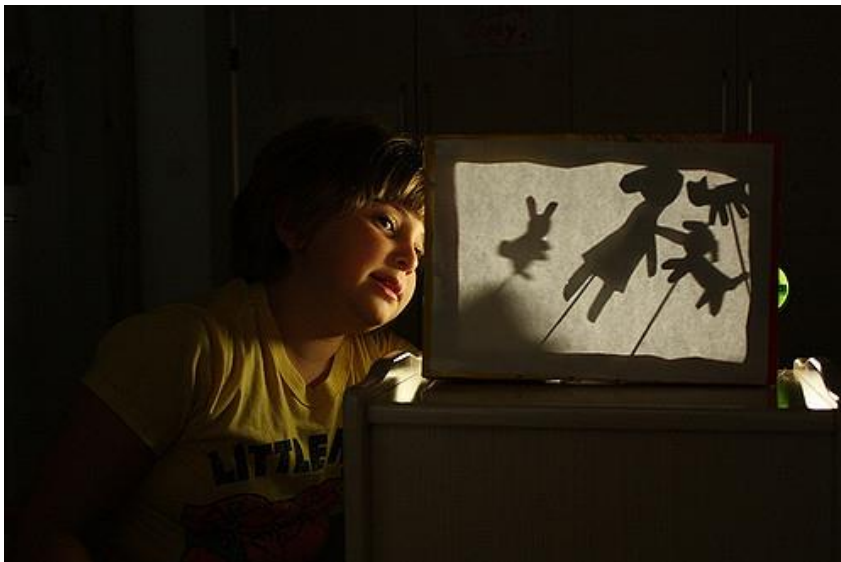
Slika 4. Fotografija prikazuje dječaka u izvedbi lutkarske predstave sjena, (Izvor: https://www.flickr.com/photos/jimmiehomeschoolmom/sets/72157614153262538/ , datum: 29.1.2017.)