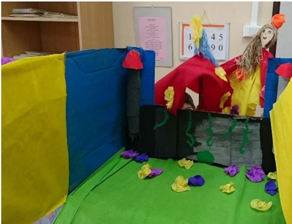
Fotografija 12. Dijalog o plesu između dječaka i djevojčice