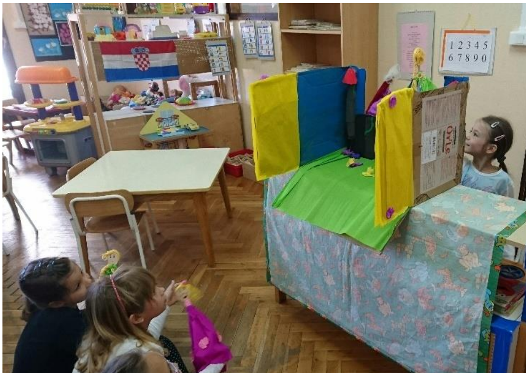
Fotografija 10. Kratak dijalog o prijateljstvu koji prikazuju dvije djevojčice uz pomoć vlastitih cvjetnih lutaka, a ostala djeca gledaju i predstavljaju publiku