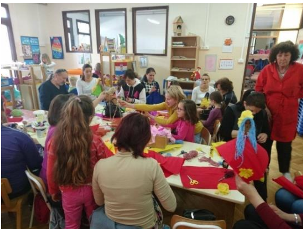
Fotografija 8. Djeca i roditelji u aktivnosti izrade lutaka