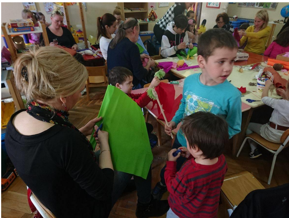
Fotografija 7. Djeca i roditelji u aktivnosti izrade lutaka