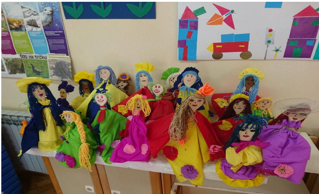
Fotografija 9. Izrađene cvjetne lutke na štapu