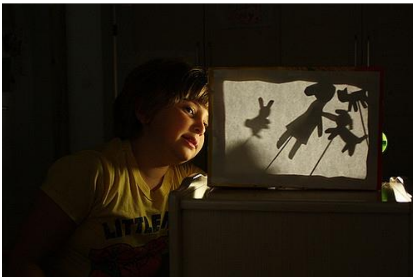
Slika 4. Fotografija prikazuje dječaka u izvedbi lutkarske predstave sjena