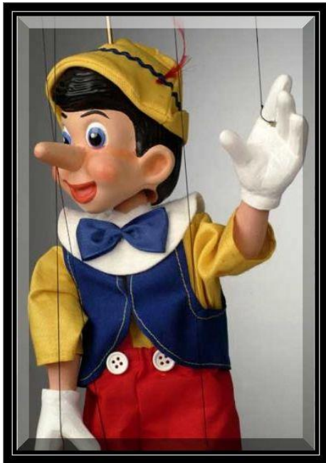
Slika 1. Lutak Pinocchio; vrsta lutaka – marionete