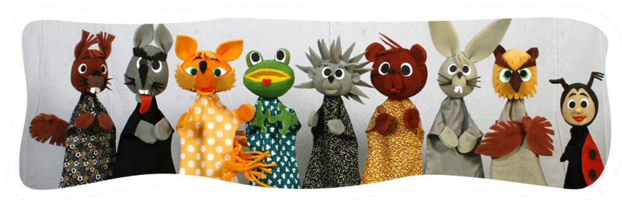
Slika 2. Ginjol ručne vrste lutaka izrađene od tkanine, motivi životinja