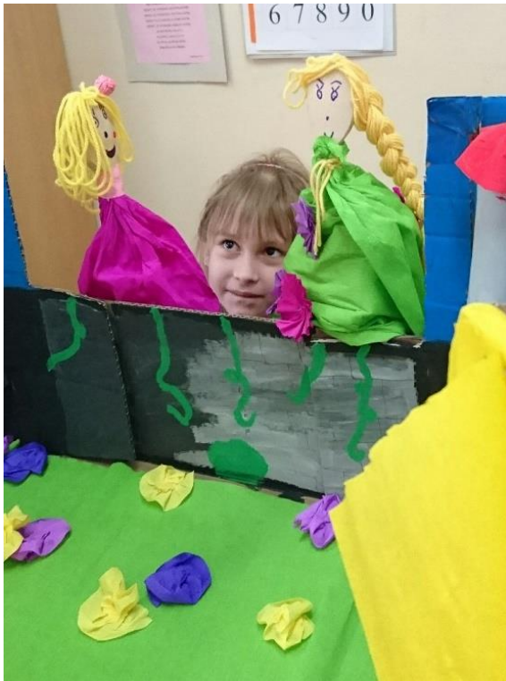
Fotografija 11. Dvije djevojčice vode dijalog uz pomoć cvjetnih lutaka