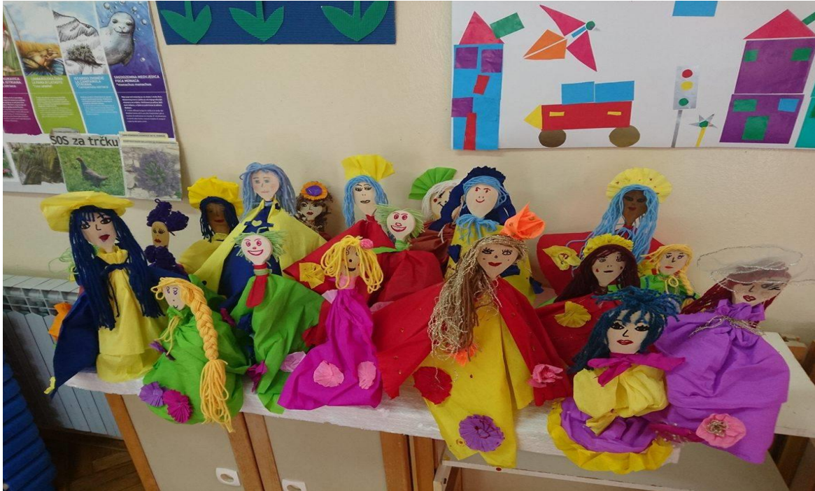
Fotografija 3. Fotografija prikazuje ručne štapne lutke izrađene na aktivnosti u dječjem vrtiću „Kaštanjer“, motivi su cvijet, plesna haljina cvijeća

žica. Lutke na štapu pripadaju skupini najjednostavnijih lutaka te ih može izraditi svako dijete tako da nacrtani lik pričvrsti na štap. One imaju najviše mogućnosti od svih dosad opisanih, te se pojavljuju u različitim oblicima. Iako mogu biti složene, s druge su strane vrlo jednostavne i praktične u radu s djecom. Klasična Javajka animira se odozdo. Štap kojim se pokreće glava fiksiran je sa stražnje strane na vrat i lutka se može okretati i rotirati. Fotografija 3. prikazuje ručne štapne lutke u vrtiću.