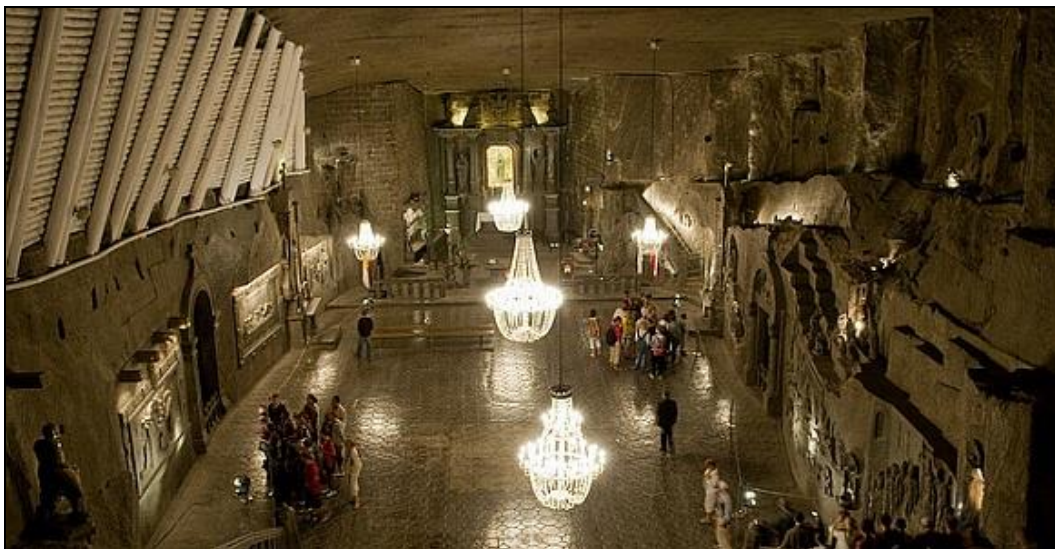
Slika 5. Podzemni grad od soli u rudniku u gradu Wieliczka u Poljskoj