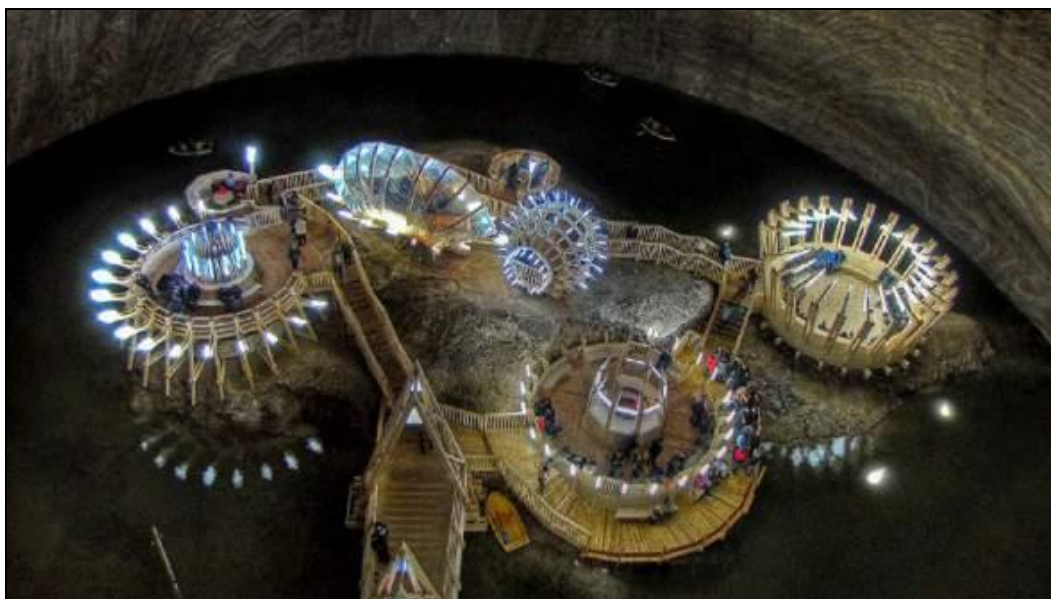
Slika 4. Rudnik soli blizu grada Turda u Rumunjskoj