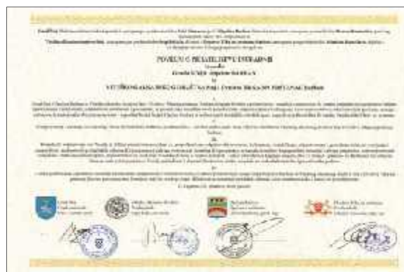
Slika 24. Povelja o prijateljstvu i suradnji Grada Sinja i Općine Barban te Viteškog alkarskog društva Sinj i Društva Trka na prstenac Barban

O uvanju i nastavku tradicije održavanja ovih dviju konjičkih igara svakako pridonose i inaice koje su se razvile po njihovom uzoru. Tako su se razvile mototrke i morske trke na prstenac, dje je alke i razvojem suvremene tehnologije robotrke i robotika alka.