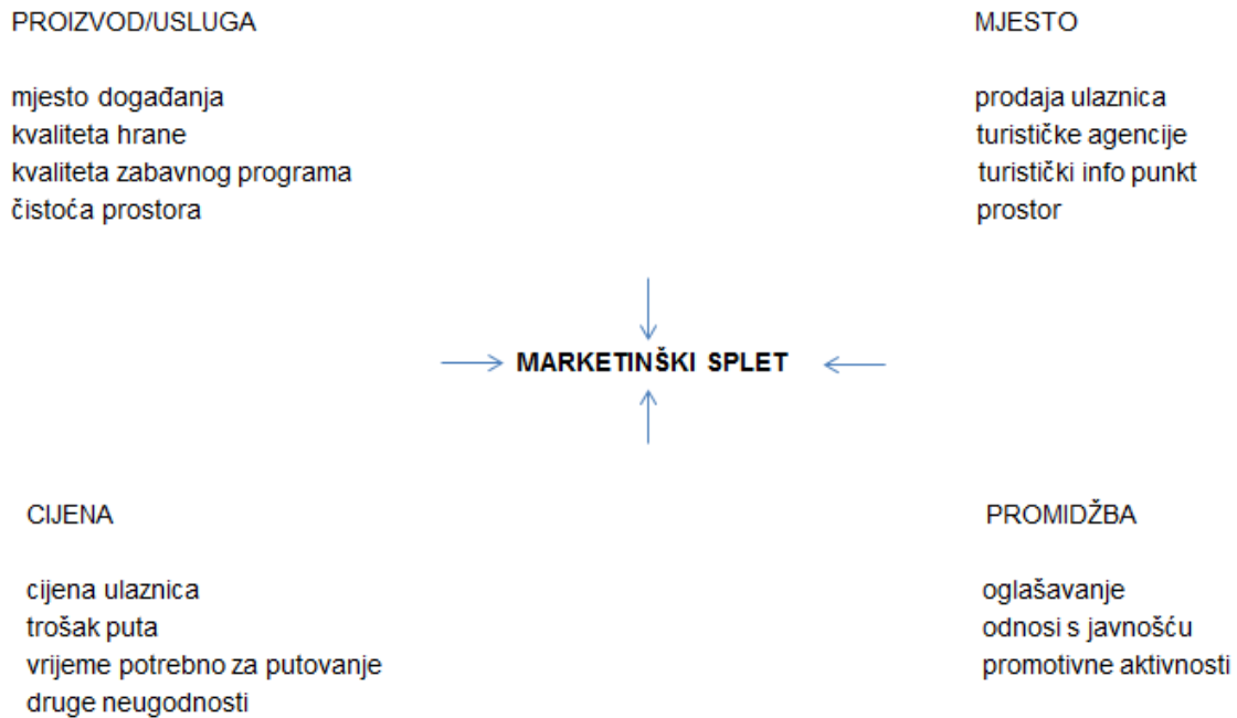
Slika 3. Marketinški splet