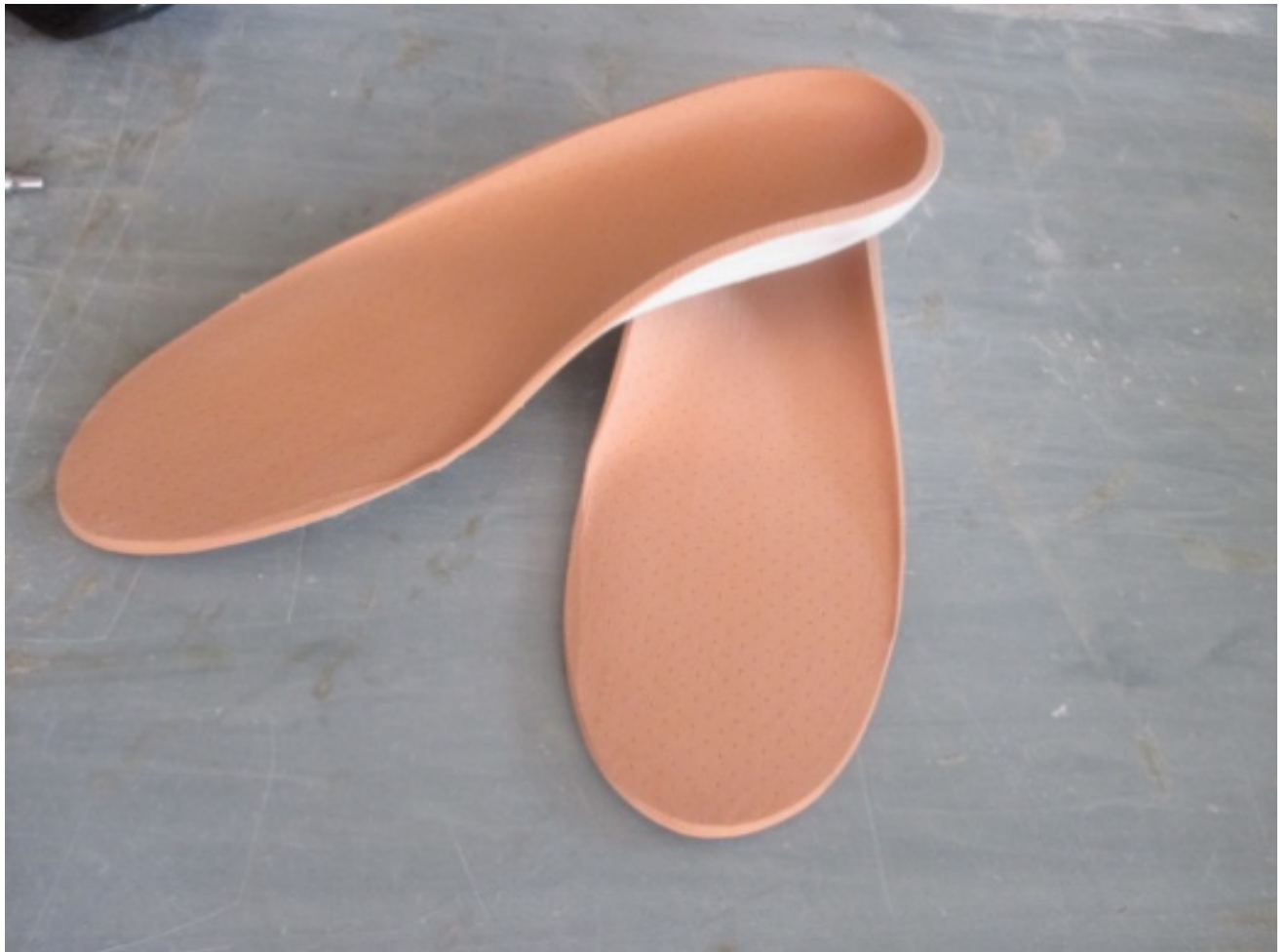
Slika 7: Sportski ulošci