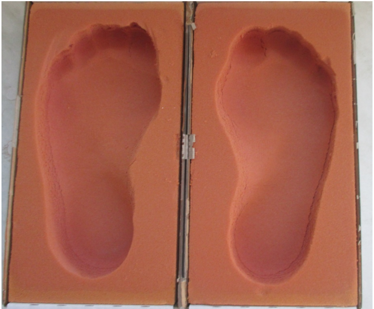
Slika 5: Otisak ljudskog stopala, od kojeg kreće proces izrade uložaka