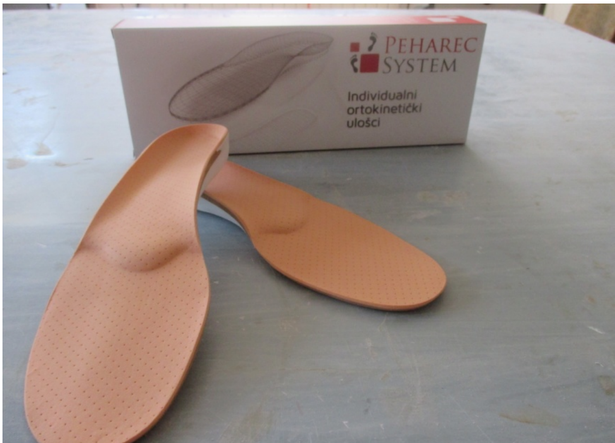
Slika 2: Individualni ortokinetički ulošci Peharec System

Ulošci Poliklinike Peharec rezultat su dugogodišnjeg istraživanja biomehanike ljudskoga tijela i stopala kao i 20-godišnjeg iskustva u njihovoj izradi. Dokazano je da je korištenjem individualnih ortokinetičkih uložaka moguće prevenirati različite deformacije stopala, gležnja, koljena i kralježnice, a isto tako i terapijski utjecati da se uočene nepravilnosti ili deformacije smanje i vrlo često otklone. Njihovom primjenom prvenstveno se ostvaruje fiziološki položaj stopala, a postizanjem tako neutralnog položaja stopala, individualni ortokinetički uložak omogućava kvalitetniju: stabilnost, amortizaciju i adaptaciju stopala u kretanju.