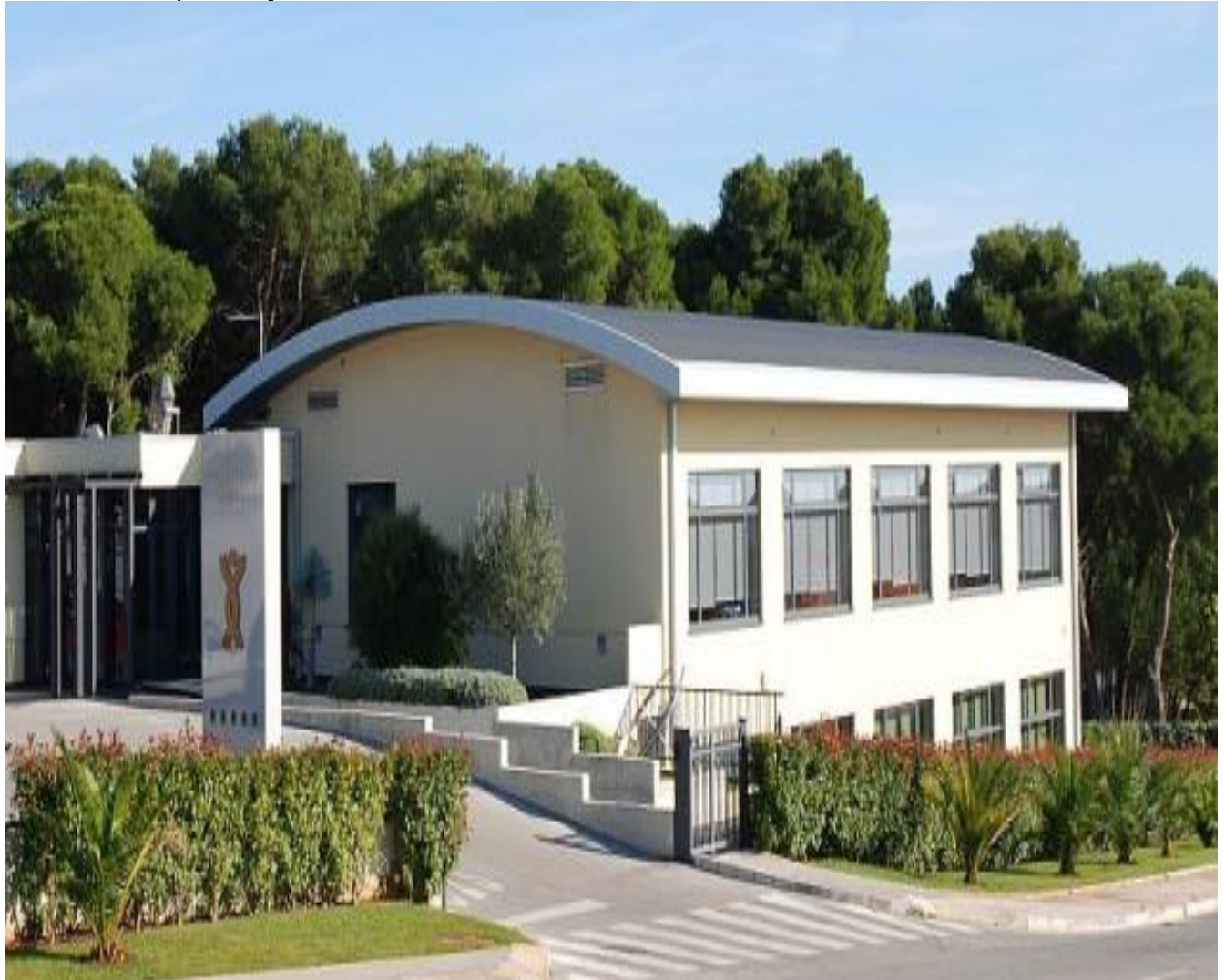
Slika 4: Slika prikazuje Polikliniku Peharec