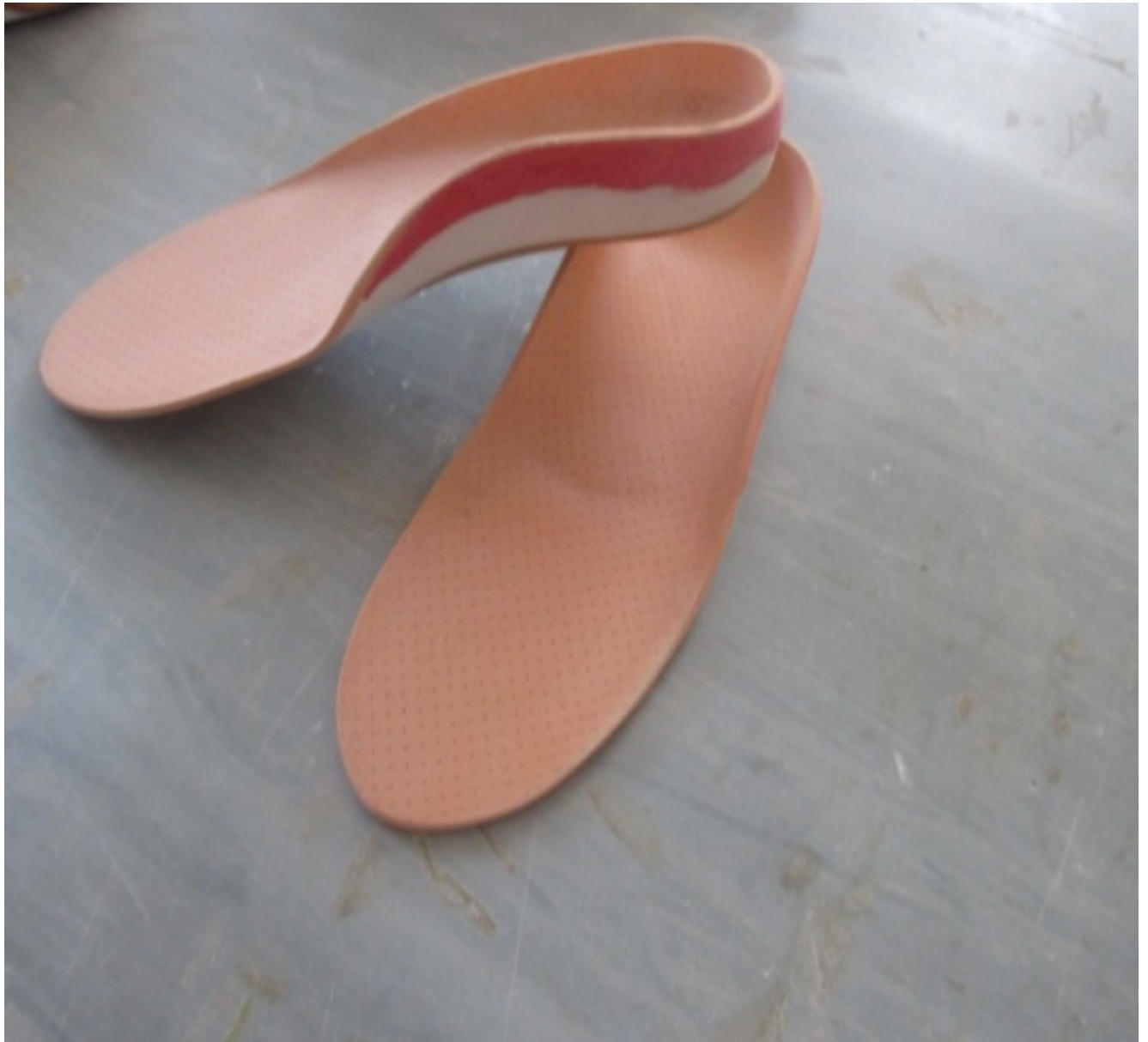
Slika 6: Dječji ulošci