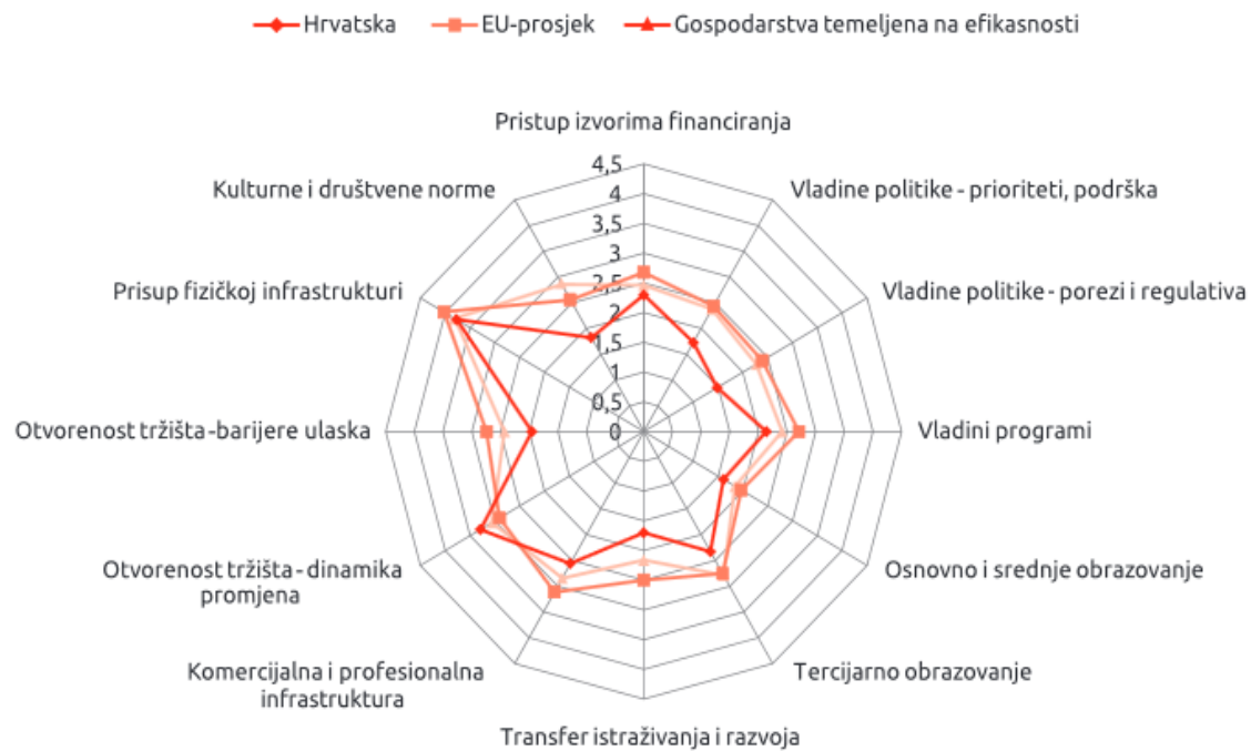
Slika 1. Usporedba poduzetničkog ekosustava u Hrvatskoj s onim na razini Europske unije i gospodarstava koja se temelje na efikasnosti u 2016. godini

Izvor: Singer, S. et al. (2017.) Što čini Hrvatsku (ne)poduzetničkom zemljom? Dostupno na: http://www.cepor.hr/wp-content/uploads/2017/05/GEM2016-FINAL-za-web.pdf (03.06.2017.), str. 56.