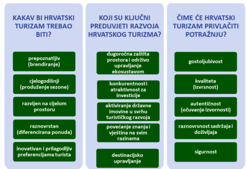
Slika 2. Vizija razvoja turizma RH do 2020.