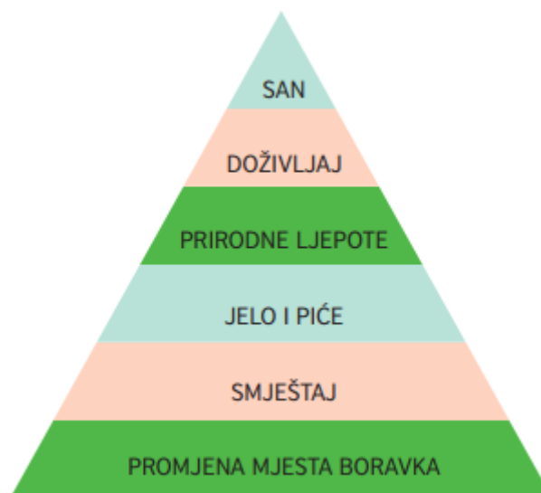
Slika 1. Piramida turističkih potreba