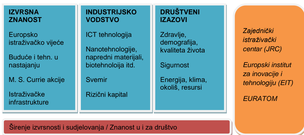
Slika 2. Obzor (Horizont) 2020 kao program poticanja inovativnosti u Hrvatskoj

Izvor: Izrada autora prema: Ministarstvo znanosti i obrazovanja (2017.) Obzor 2020. Dostupno na: http://www.obzor2020.hr/obzor2020 . Datum posjete: 12. rujna 2017.