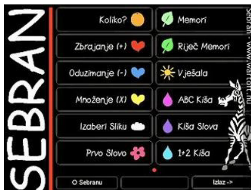
Slika 6. Sebran

Sebran je besplatan edukativni softver izvorno napravljen na engleskom jeziku, ali je preveden na nekoliko drugih jezika, uključujući i hrvatski.