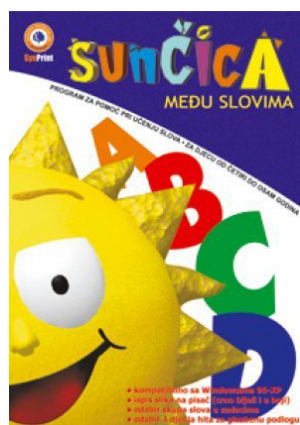
Slika 1. Sunčica među slovima