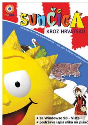
Slika 3. Sunčica kroz Hrvatsku