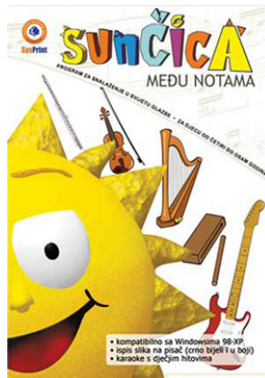
Slika 4. Sunčica među notama

melodiju. U igri Ritam mašina , dijete razvija osjećaj za ritam i takt, a Karaoke je igra za sve one koji vole pjevati.