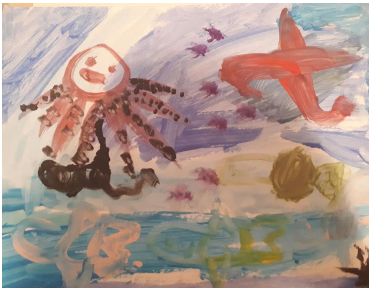
Slika 1. Morsko dno, dječak T., 6 god. 9 mj.

Tijekom razgovora o crtežima djeci sam postavljala pitanja na koja su ona odgovarala.