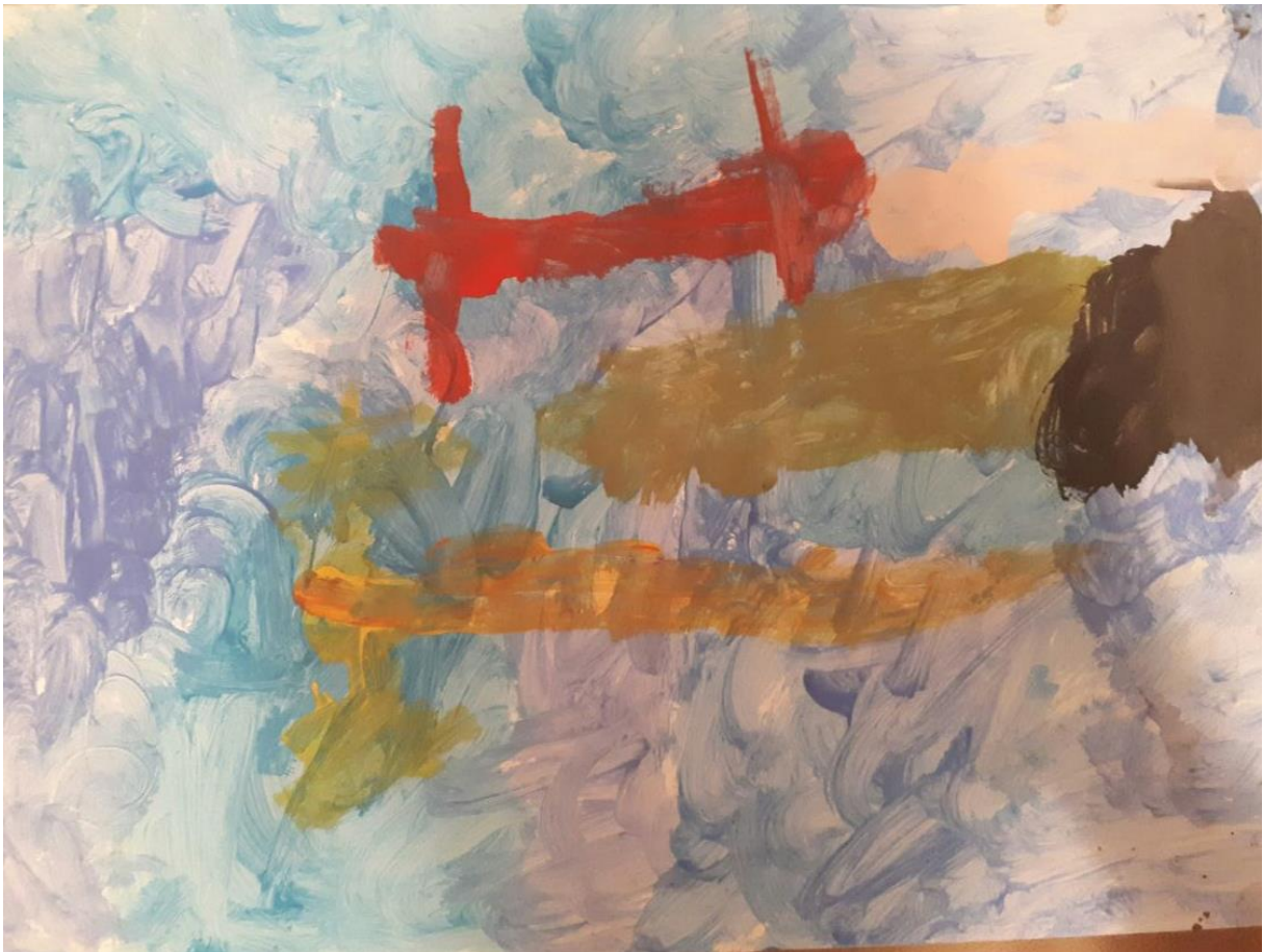
Slika 5. Morsko dno, djevočica E., 4 god 3mj.