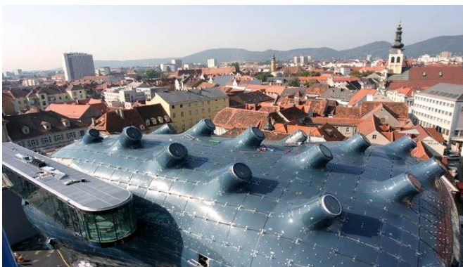
Slika br. 3 Muzej suvremene umjetnosti „Kunsthause“