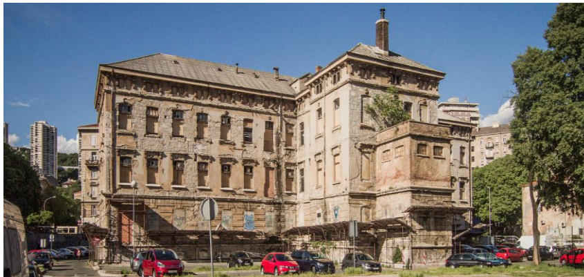
Slika br. 4 Dio tvorničkog kompleksa Rikard Benčić