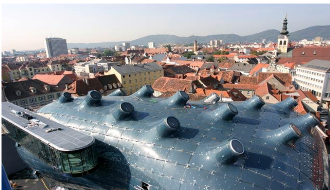
Slika br. 3 Muzej suvremene umjetnosti „Kunsthause“