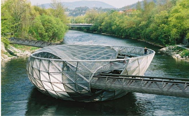
Slika br. 2 Umjetni otok na rijeci Muri