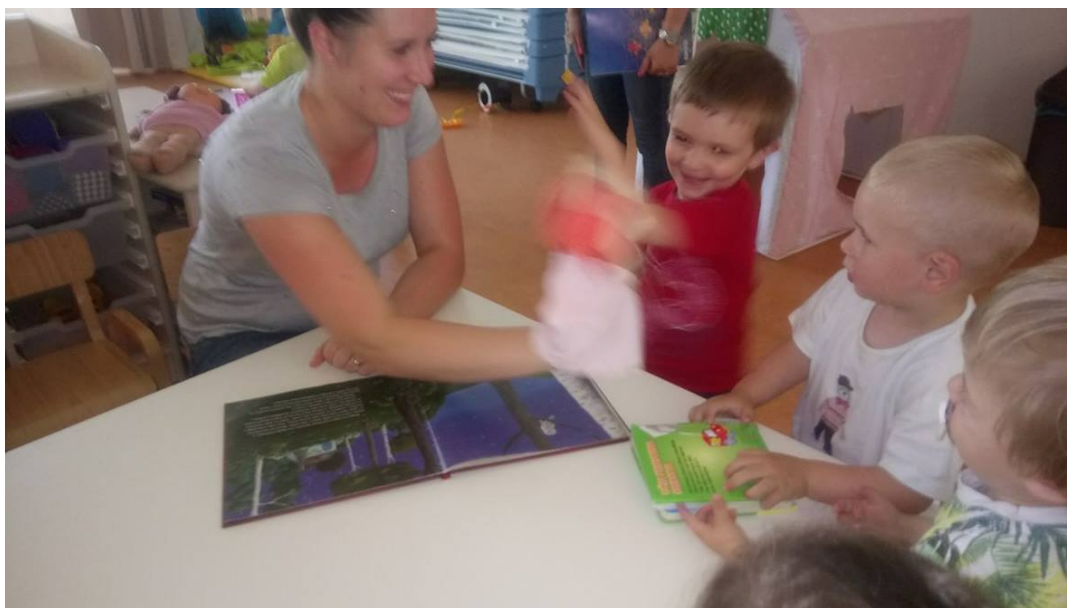
Slika 11. Čitanje priče uz pomoć lutke