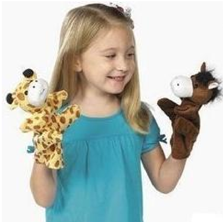
Slika 9. Lutka, partner u igri