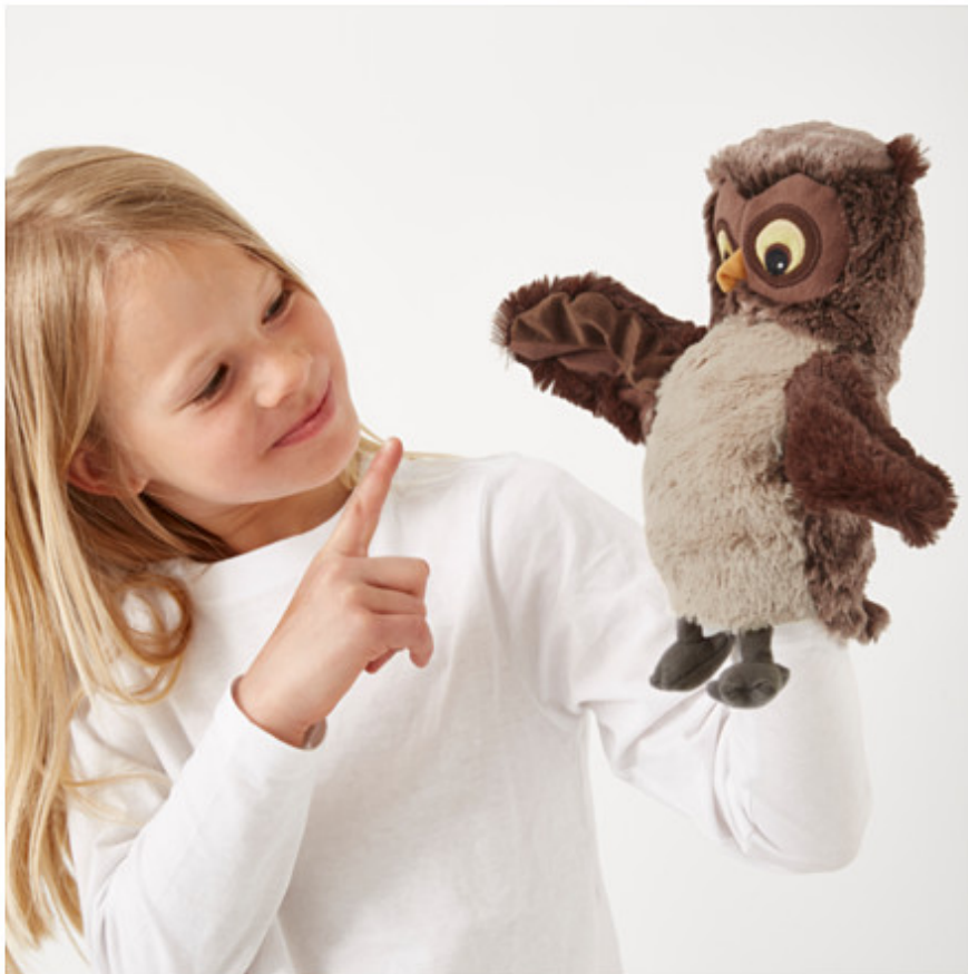
Slika 8. Dijete i lutka