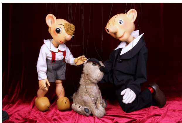
Slika 4. Spejbl i Hurvinek, češke tradicionalne marionete