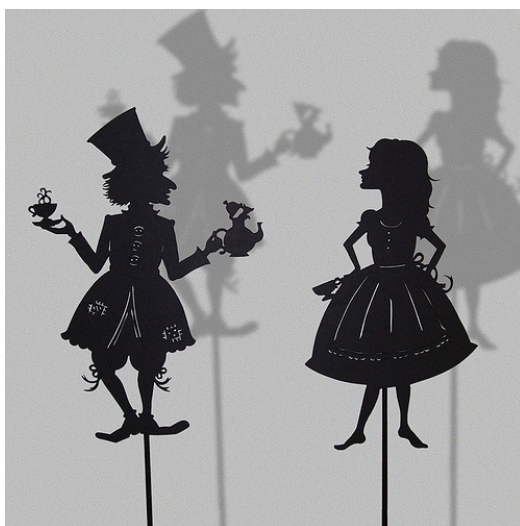
Slika 5. Lutke sjene

Lutka sjena ima veliku povijesnu tradiciju. Lutka sjena ima dugu tradiciju u Indiji i Kini odakle se širi na Indoneziju, Tajland, Bali, a otuda u Europu preko Turske, Grčke i drugih zemalja Sredozemlja. Nasuprot tome, kod nas nema tradiciju i vrlo se malo koristi, no popularna je u predškolskim ustanovama u svom najjednostavnijem obliku. Ona za razliku od ostalih scenskih lutaka u predstavi zapravo nikada nije direktno vidljiva publici, već je vidljiva samo njezina sjena, alter ego. Ona je, dakle, samo iluzija lutke.