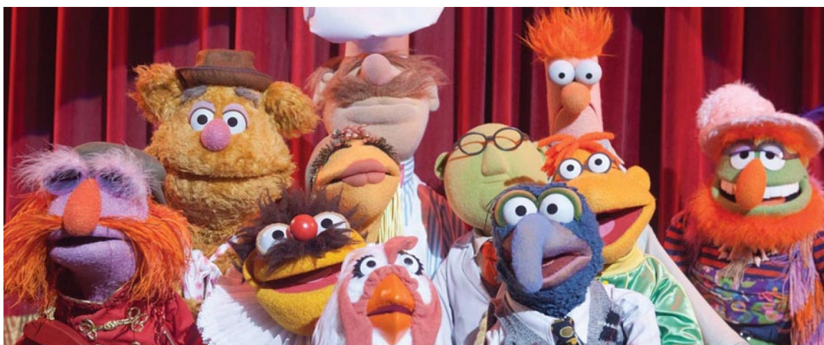
Slika 2. Lutke zijevalice- Muppet lutke