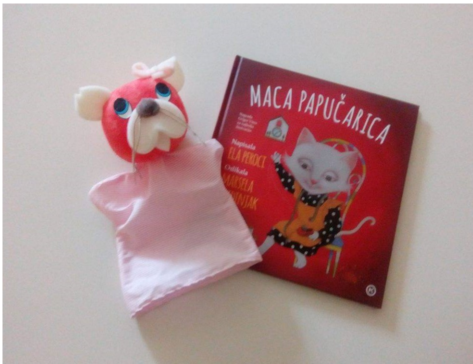
Slika 10. Ginjol lutka Maca Papučarica i istoimena slikovnica

Tako upotrebljavajući lutku, prema Hiceli, odgojitelji najčešće žele uspostaviti i održati pozitivnu komunikaciju s djecom, te poticati razvoj kulturno-higijenskih i radnih navika djece. Lutka zaokuplja te usmjerava pažnju djeteta, najavljuje ponašanje koje se očekuje od djeteta u određenoj situaciji. (Hicela, 2010.) Na taj način lutka postaje dio svakodnevnih stvarnosti u vrtiću, poseban prijatelj u igri i iskustvu djeteta.