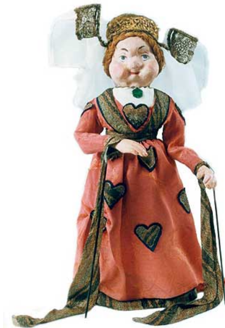
Slika 6. Lutka Javajka

Lutka Javajka također je poput svoje prethodnice, lutke sjene, lutka koju se pokreće i kontrolira štapom. To je velika, predimenzionirana lutka čije tijelo pokreće nekoliko animatora pomoću dugačkih štapova. Lutka javajka ima jako dugu tradiciju koja dolazi s Dalekog istoka. „ Tradicionalna javajka ime je dobila po otoku Javi s kojega potječe, a na području Indonezije poznata je pod imenom Wayang golek. Wayang golek je trodimenzionalna štapna lutka, za razliku od lutaka sjena koje su plošne, a nazivaju ih Wayang kulit. “ (Županić Benić, 2009: 74.)