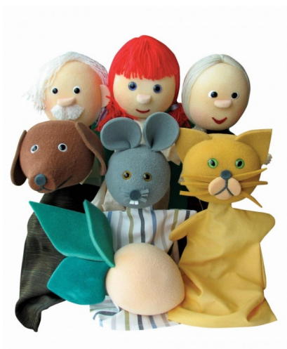
Slika 1. Ginjol lutka

Lutka se na ruku stavlja tako da kažiprst drži i upravlja lutkinom glavom dok su na srednjem ili na malom prstu i na palcu lutkine ruke. Ukoliko mičemo rukom i sagibamo je u ručnom zglobu i lutka izgleda kao da se sagiba i miče.