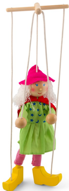
Slika 3. Marioneta