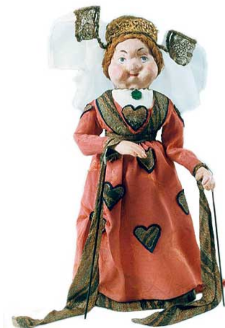
Slika 6. Lutka Javajka

Lutka Javajka također je poput svoje prethodnice, lutke sjene, lutka koju se pokreće i kontrolira štapom. To je velika, predimenzionirana lutka čije tijelo pokreće nekoliko animatora pomoću dugačkih štapova. Lutka javajka ima jako dugu tradiciju koja dolazi s Dalekog istoka. „ Tradicionalna javajka ime je dobila po otoku Javi s kojega potječe, a na području Indonezije poznata je pod imenom Wayang golek. Wayang golek je trodimenzionalna štapna lutka, za razliku od lutaka sjena koje su plošne, a nazivaju ih Wayang kulit. “ (Županić Benić, 2009: 74.)