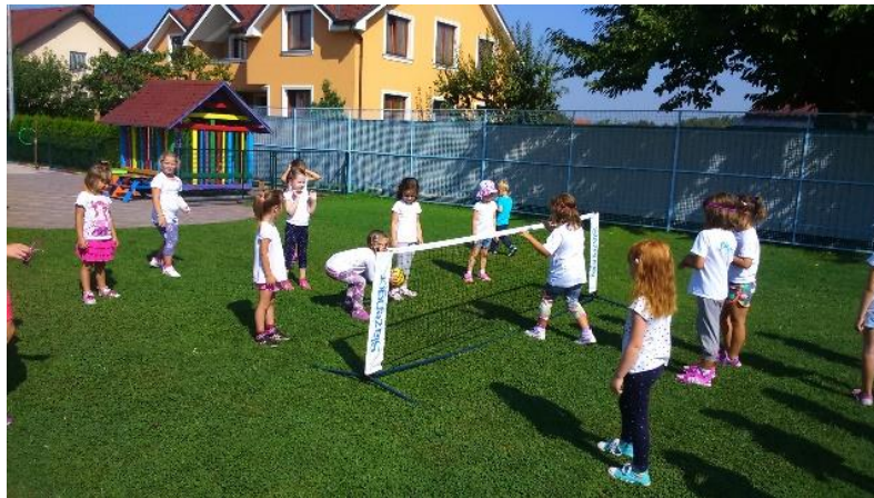
Slika 9. Odbojka

Posljednja cjelina, igranje utakmice , od velike je važnosti jer se primjenjuje sve prethodno naučeno. Usmjerava se djecu na prepoznavanje različitih situacija u igri te sposobnost da dijete samo odabere najpogodnije rješenje za ostvarenje cilja.