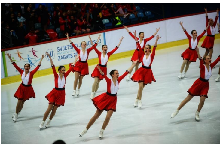
Slika 6. Klizanje (estetska aktivnost)