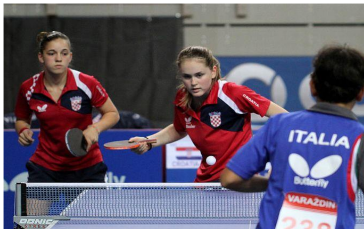
Slika 4. Stolni tenis (polistrukturalna aktivnost)

Izvor: http://sport.hrt.hr/280045/sjajna-forma-brace-sinkovic (10.06.2018.)