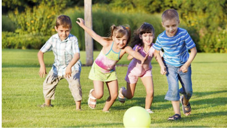
Slika 11. Igra