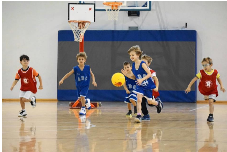
Slika 8. Košarka

Usvajanje jednostavnijih „posebnih zaduženja“ igrača odnosi se na upoznavanje djece s pozicijama (branič, krilo, centar) te individualno usmjeravanje na određenu poziciju. Nakon usvajanja pojedinih tehnika djecu se usmjerava na igranje utakmice . Potiče ih se na prepoznavanje različitih situacija u igri te uočavanje najboljeg rješenja za određene situacije (Sindik, 2008).