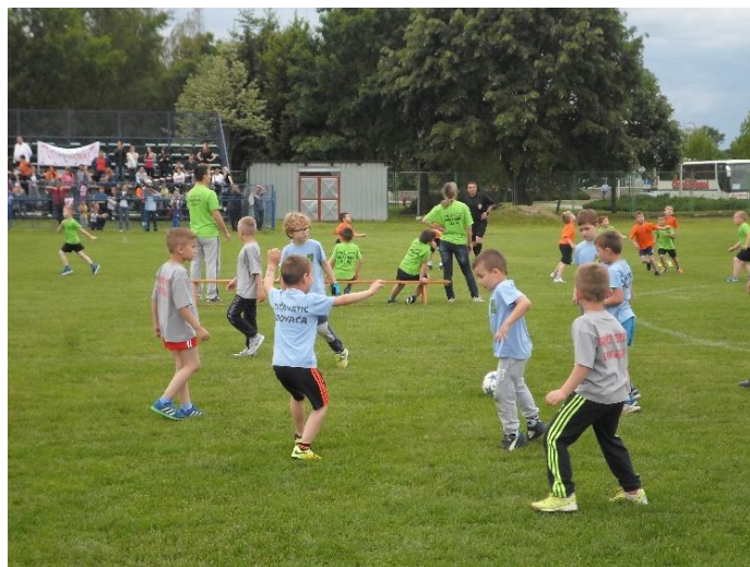
Slika 7. Mali nogomet

Na samom kraju, nakon što djeca savladaju prethodne elemente, započinje usmjeravanje djece na samo igranje utakmice . Usmjerava ih se na prepoznavanje različitih situacija u igri te principi odabira najpogodnijeg rješenja za neke situacije (Sindik, 2008).