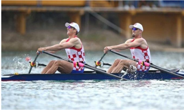
Slika 3. Veslanje (monostrukturalna aktivnost)