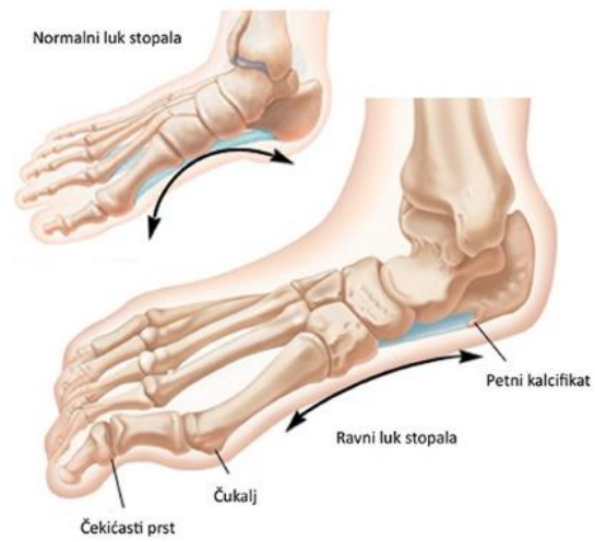
Slika 2. Spušteno stopalo