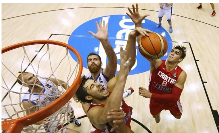
Slika 5. Košarka (kompleksna aktivnost)