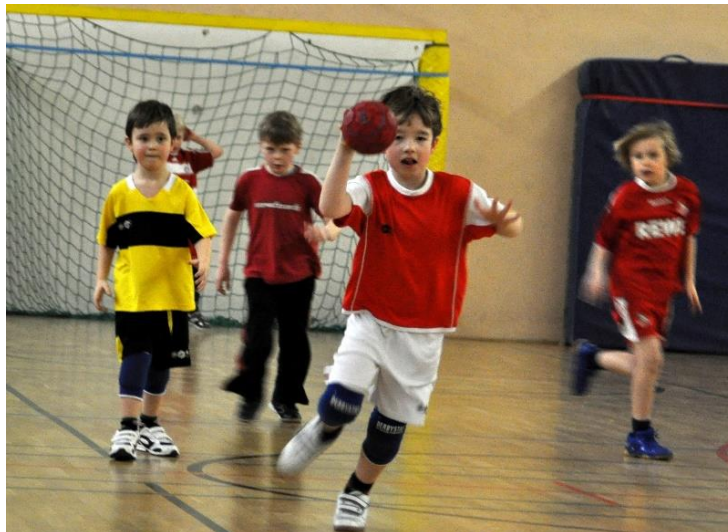
Slika 10. Rukomet

I za kraj, nakon usvojenih osnovnih pojmova i kretnji, djecu se usmjerava na igranje utakmice . Potiče ih se na vlastito prepoznavanje različitih situacija u igri, na odabir najkorisnijih rješenja tijekom igre te na međusobnu komunikaciju i suradnju (Sindik, 2008).