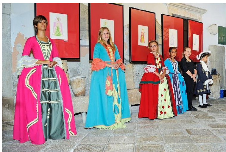
Slika 8. Budimo kreatori mode iz doba Giostre