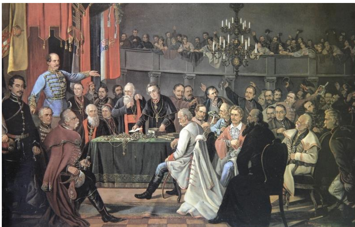
Prilog 4. Hrvatski sabor 1848. 49

zajamči potpuna unutarnja neovisnost i uporaba hrvatskog jezika. 48 Mađari odbijaju uvjete i postaje samo pitanje vremena i trenutka kada će Jelačić sa svojom vojskom prijeći Dravu i povesti svoju je u rat protiv Mađarske.